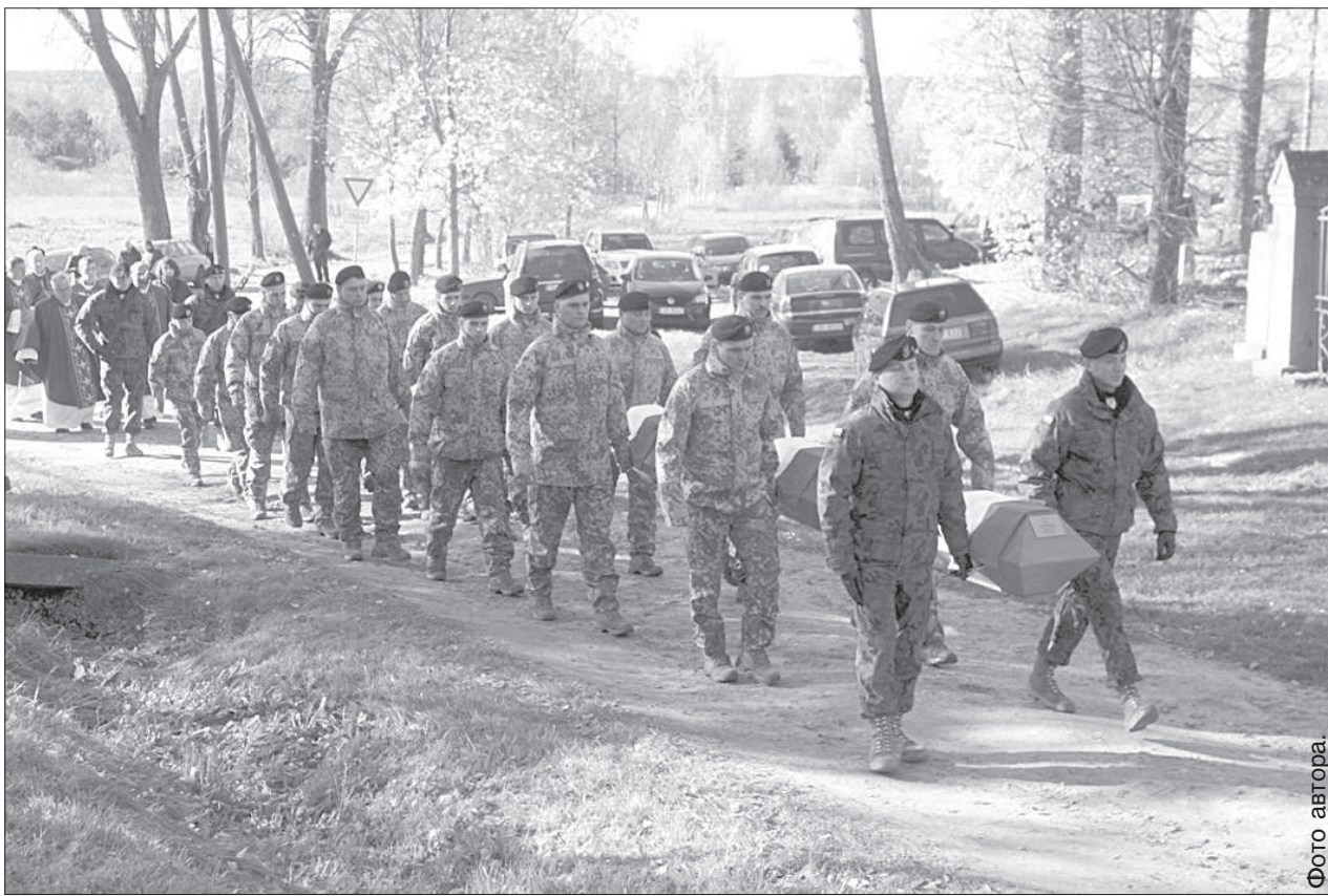
Процессия к месту захоронения.