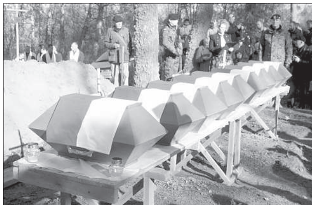
Прощание с воинами.