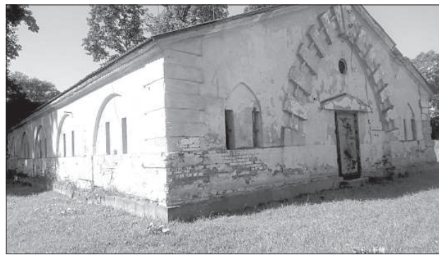
Малый пороховой склад Даугавпилсской крепости совсем недавно перешел в собственность города.

Мероприятие «Пустые пространства», организованное Институтом Гете и Региональным образовательным центром немецкого языка и изучения Германии при Гуманитарном факультете ДУ, состоялось 14 октября в малом пороховом погребе Даугавпилсской крепости. Увы, собрались на встречу лишь единицы заинтересованных.