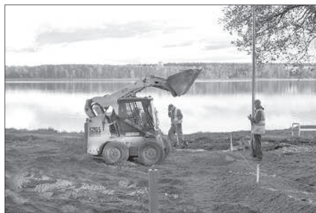
Променады в этом году достроен не будет.