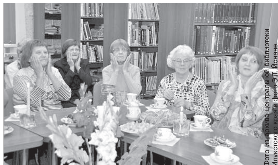
Аптекари участвуют в играх.