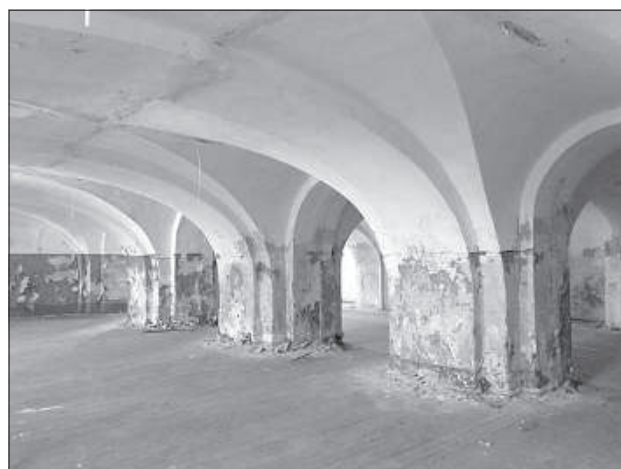
Огромные пространства – особенность заброшенных зданий в крепости.

В разных частях страны периодически появляются инициативные группы, готовые использовать заброшенные постройки для разных творческих, социальных или туристических нужд. Однако, уже на стадии планирования своей деятельности, подавляющее большинство из них сталкиваются с двумя большими проблемами, главные из которых хитросплетения законодательства и апатия владельцев недвижимости.