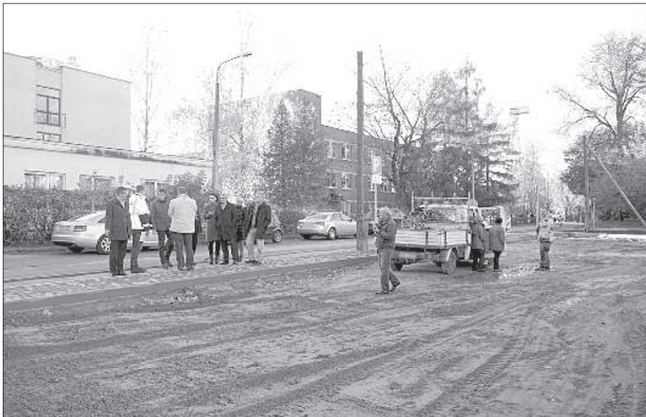
Стоянку у СГД не могут завершить уже с осени 2016 года.