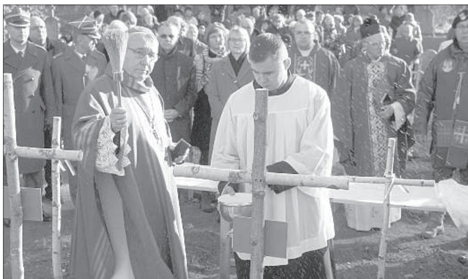
Захоронение останков польских солдат.