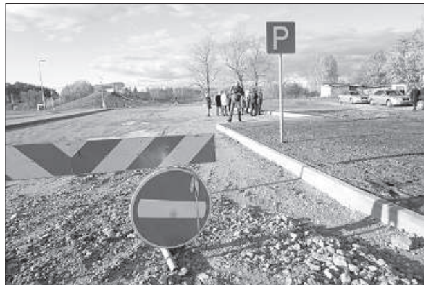
Депутаты обсуждают парковку на ул. Кандавас, 1.

Аналогичная ситуация создавалась на парковке в центре города рядом с су-