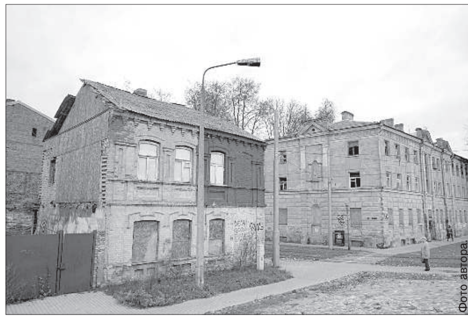
Здания на перекрестке улиц 18 Ноября и Виенибас давно портят облик города.