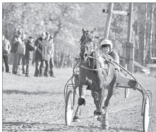
Последний забег американского скакуна Business Traveler.