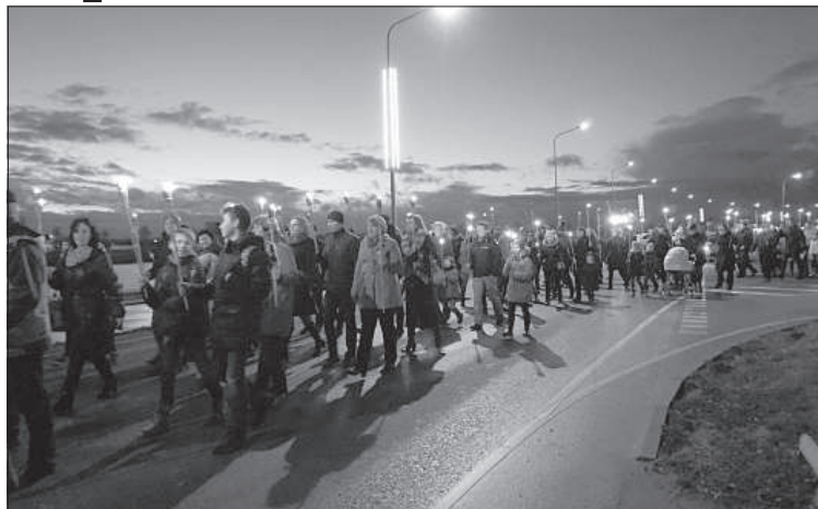
В шествии участвовали тысячи человек.

Торжественный круг по центральным улицам и до площади Виенибас, возглавляемый представителями 34-го артиллерийского батальона Земессардзе и танцевального ансамбля «Laisteme», начался вовремя. Торжественную музыку играл профессиональный духовой оркестр «Даугава». По ходу маршрута участников ожидало несколько приятных сюрпризов. У здания муниципальной полиции в честь легендарного полковника Фридриха Бриедиса был поставлен почетный караул, а старый корпус Даугавпилсского университета порадовал специальной праздничной иллюминацией.