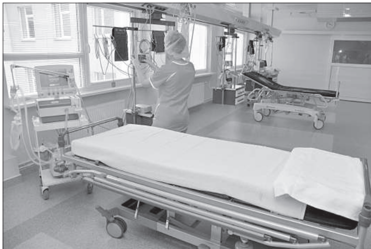
Самоуправление оплачивает лечение пенсионеров первые 3-4 дня.

Упомянутые виды поддержки получают отдельно живущие пенсионеры, имеющие статус малообеспеченных, и доходы которых не превышают 170-265 евро в месяц. Самоуправление присуждает компенсацию 15 евро на транспортные расходы, если пенсионер лечится