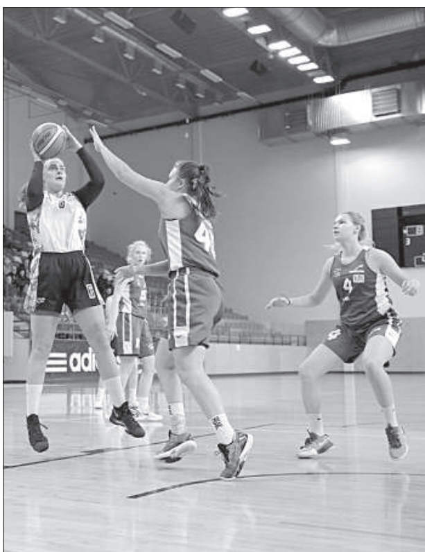
Лига Лигита Головки.