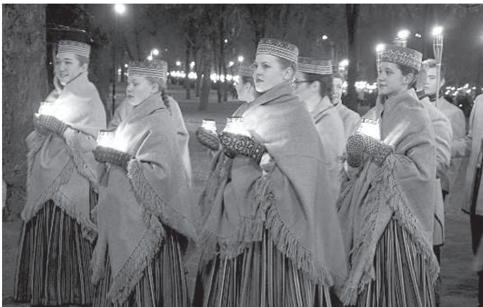
Участницы танцевального ансамбля «Laismeņa».

11 ноября в Даугавпилсе в пятый раз состоялось торжественное факельное шествие, посвященное Дню Лачплесиса. Сотни людей, десятки организаций и представители разных государственных структур не испугались промозглой погоды и собрались вместе, чтобы вспомнить о победе армии независимого Латвийского государства над войском Бермонта-Авалова в ноябре 1919 года.