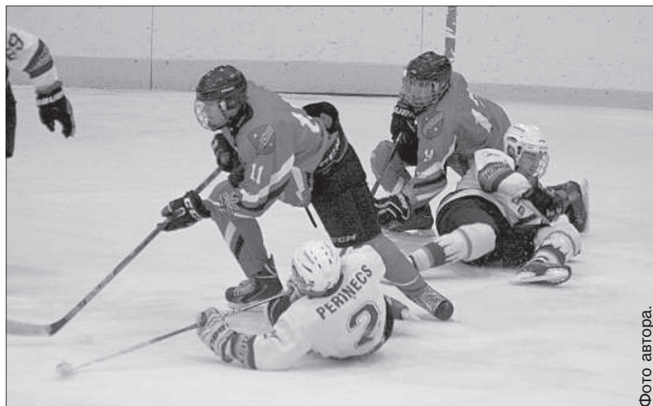
Жесткое противостояние латвийских и литовских хоккеистов.

В третьем периоде обстановка на льду стала