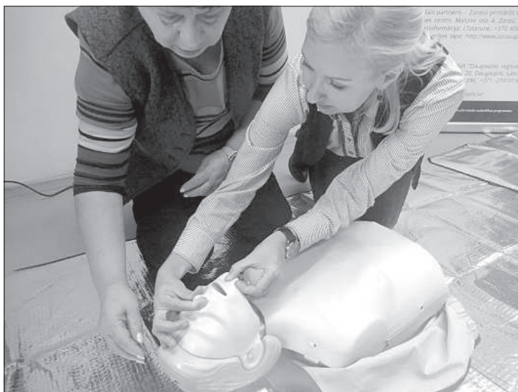
Уроки первой помощи.

В рамках проекта для Зарасая приобретается машина «скорой помощи». Даугавпилсская региональная больница для улучшения услуг неотложной помощи приобретает тромбозластометр, портативные аппараты искусственной вентиляции легких, 3 ларингоскопа для обеспечения лучшей работы при труднопроходимости дыхательных путей и система видеоинтубации для обучения медицинского персонала. Планиру-