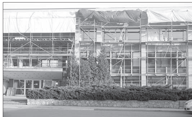
Ремонт идет по плану.

Весной 2017 года начался ремонт Даугавпилского дворца культуры. По договору ремонт здания должен быть завершен к концу февраля 2018 года.