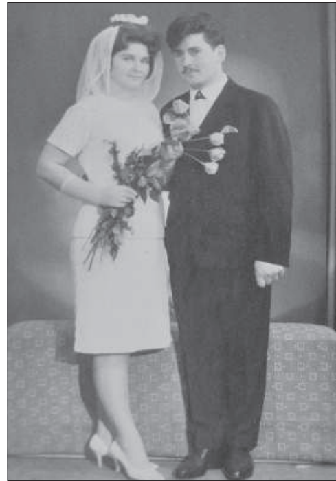
День свадьбы 18 ноября 1967 года.