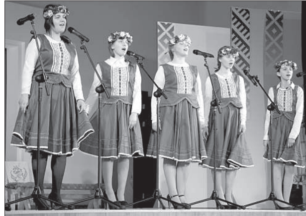
Ансамбль «Пралески» из Резекне.