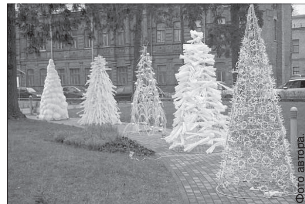
Белые елочки украшают серый пейзаж.