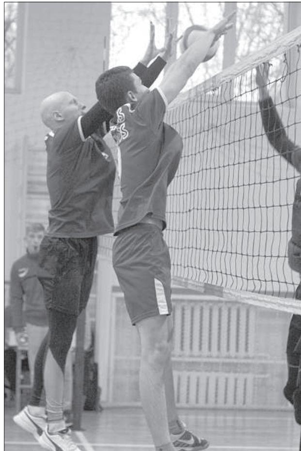
Встреча Вецумниекс и Вилякской краевой ДЮСШ завершилась со счетом 3:0.