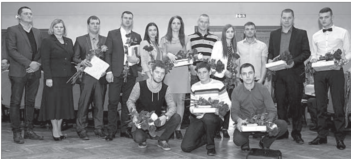
У молодых крестьян больше всего наград.

24 ноября Краславская краевая дума поздравляла крестьян, победителей конкурсов и партнеров по сотрудничеству.