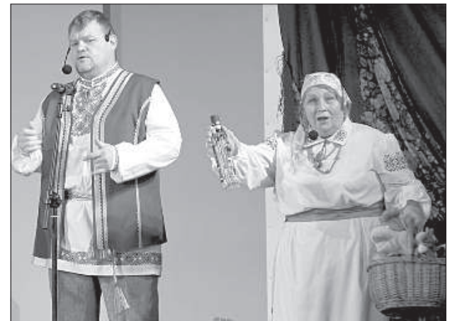
Тетральная студия ЦБК «Паулинка» смешила гостей фестиваля.