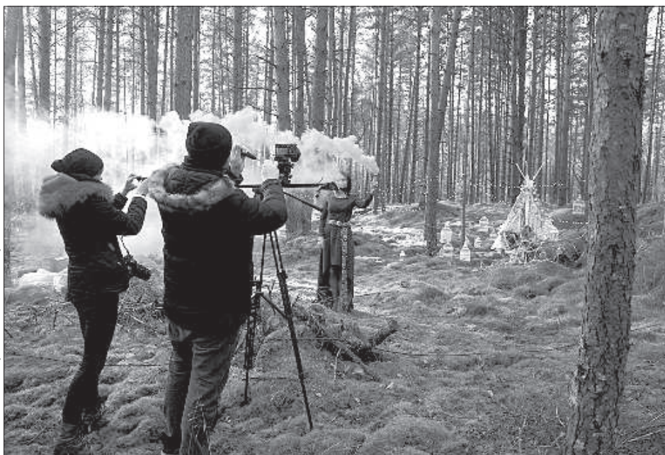
Съемки видеоклипа на Андрупенской болотной тропе.

Несмотря на то, что оба в свое время учились в Даугавпилсской музыкальной средней школе