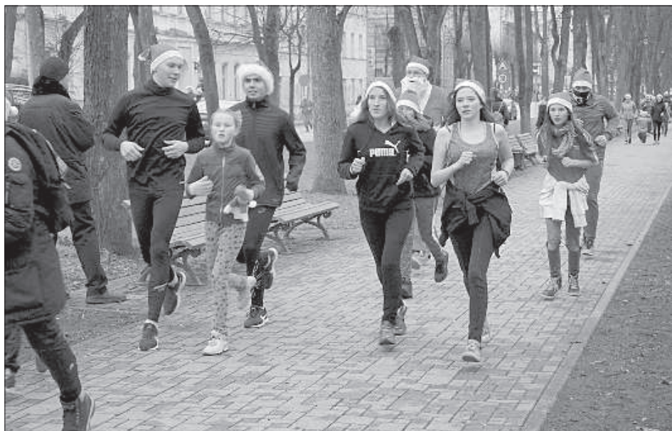
Пробег по парку Дубровина.