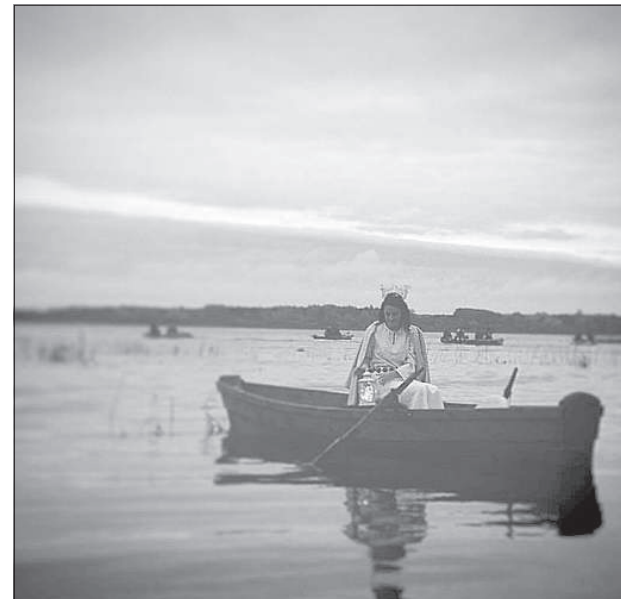
Агате в лодке на Вишкском озере, вдалеке — рыбаков.

не оставила, а брала дополнительные занятия.