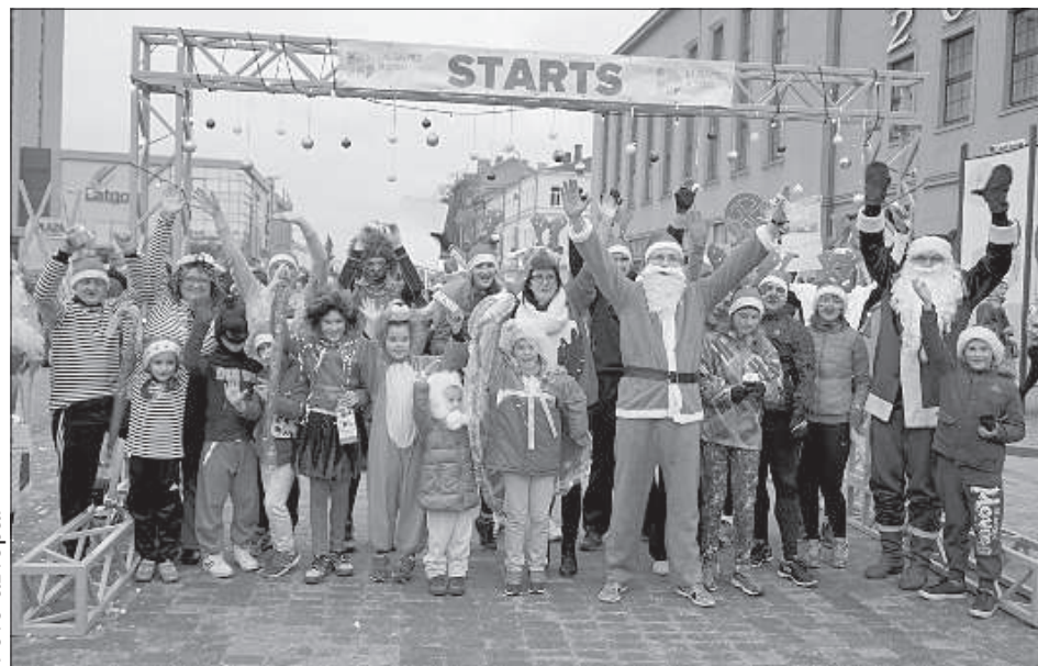
Участники конкурса костюмов: «Бегайте в новом году!».