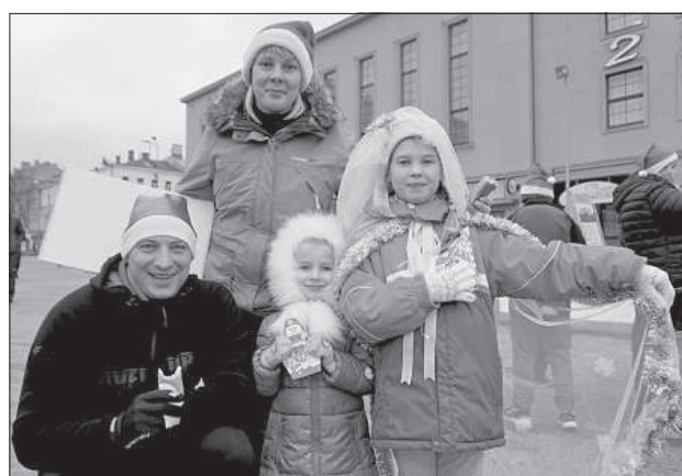
Семья Высоцких: «Это праздник для детей, поэтому мы бежим все вместе».