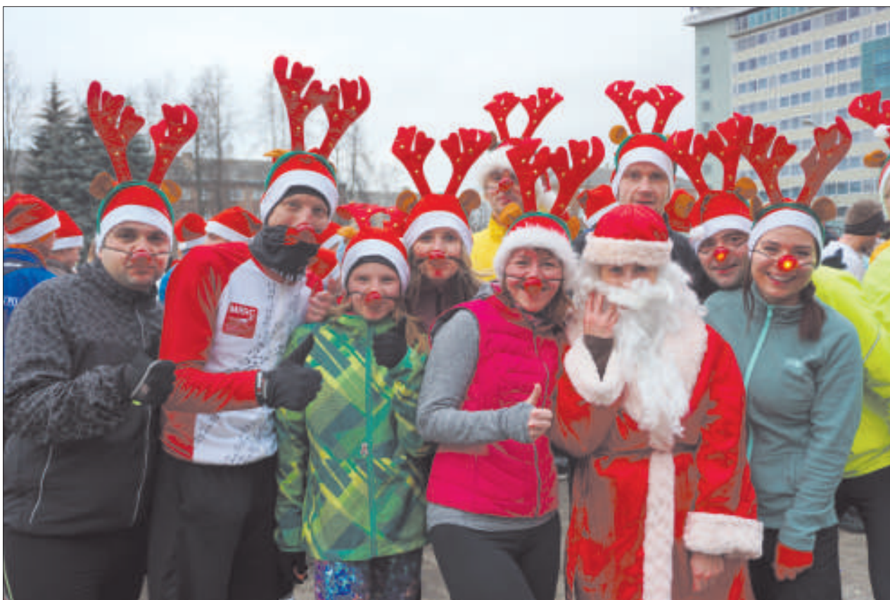
«Олени» из спортивного сообщества «Daugavpils Running Group» бегают по 5-10 км каждую среду.