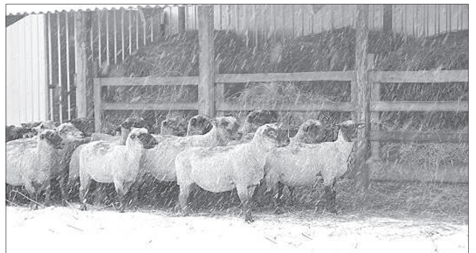
Порода «Латвийская черноголовая» устойчива к местному климату.