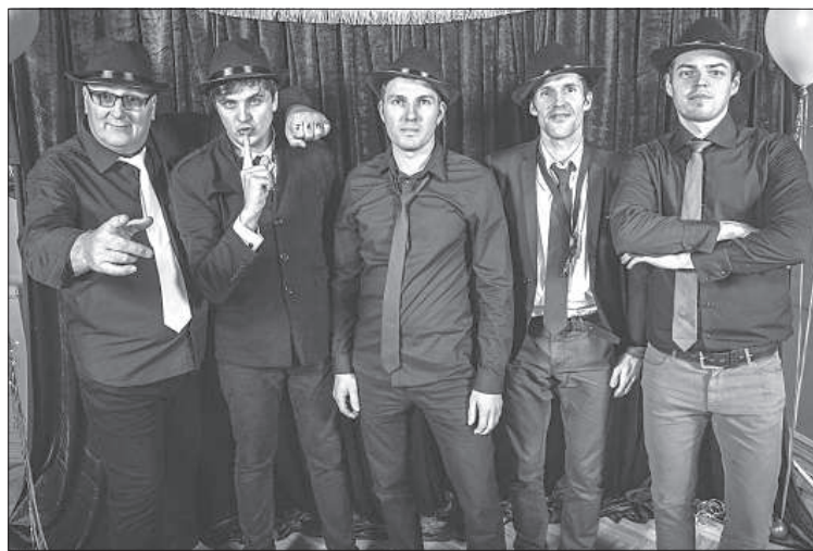
В составе «Dabasu Durovys» (первый слева).