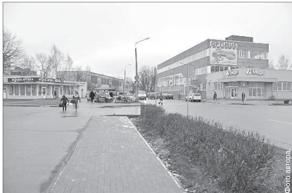
Совсем скоро на новой брусчатке появятся столы и скамейки.

Также устно продавцы должны предупреждать о веществах или продуктах, вызывающих аллергию или непереносимость, а также соблюдать требования гигиены и иметь при себе документ о происхождении продуктов, подчеркнула В. Гринберга.