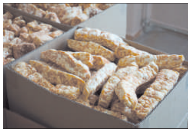
После разогрева сырного сухарика в микроволновке он превращается в более мягкое лакомство для собак — попкорн.

Оказалось, что в Непале в суровые времена похожие сушеные и прессованные молочные изделия едят и люди. В других местах мира, например, в США, произведенные в Непале продукты для собак весьма востребованы, а на европейском рынке они попросту недоступны, поскольку из Непала в Европу экспорт молочных продуктов запрещен. Похожее предприятие есть во Франции, но оно экспортирует только в Великобританию. «Свои секреты производства никто не раскрывает», — пояснила Лига. «Например, в Непале эти сухарики сушат просто на солнце, нарезают своеобразными кинжалами. «Разуме-