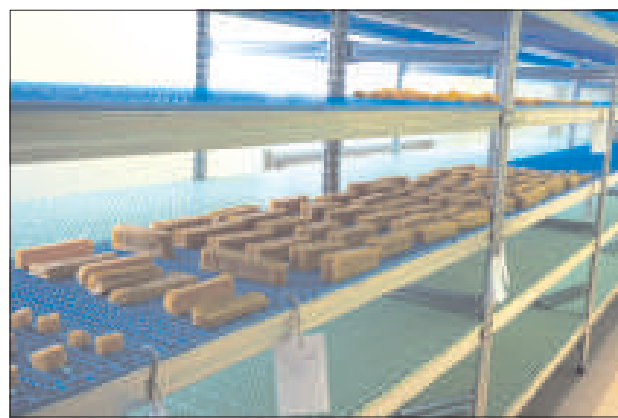
Игрушка должна сохнуть 20-40 дней.