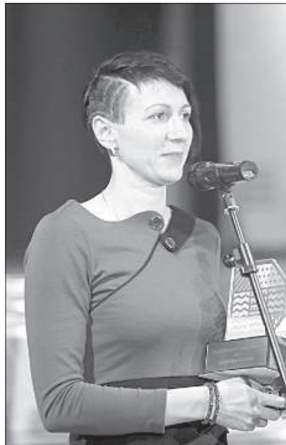
Паралимпиец года – Жанна Цвечковская (академическая гребля)