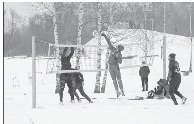
Снежный волейбол настолько увлекает, что с рук слетают перчатки.