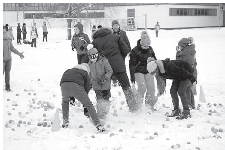
Смешная эстафета с цветными мячиками.

празднике, что вызывало у них приятное удивление. Судя по отзывам, люди будут только рады, если подобное мероприятие будет проходить каждое воскресенье».