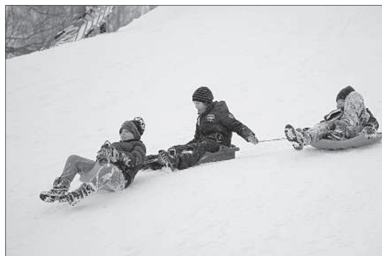
И все же самое любимое — это горка!