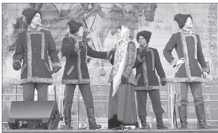
Выступление гостей из Ростова-на-Дону — казачий ансамбль «Успех».

Традиционный праздник, организованный Центром русской культуры и управлением культуры Даугавпилсской думы, собрал большое количество жителей города, несмотря на мороз и снегопад.