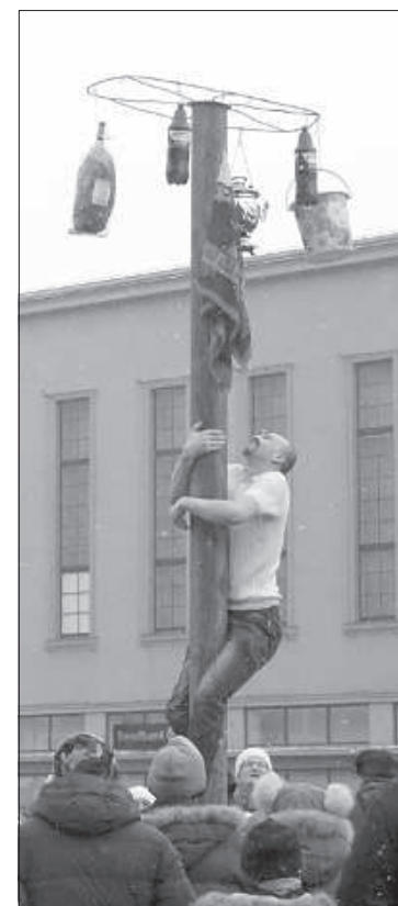
Первым с ледяного столба был снят самый дорогой подарок — самовар.