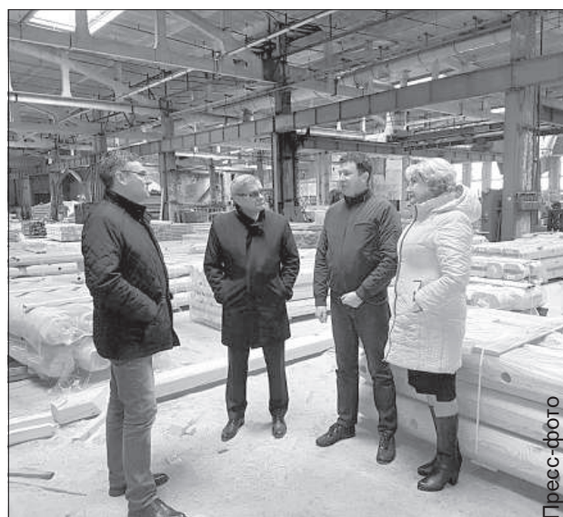
Комиссия по надзору Латгальской СЭЗ побывала в Ливанах на фирме «Еко памс».

На данный момент Комиссия по надзору Латгальской СЭЗ направила предложения Министерству финансов, какие еще инструменты могут улучшить предпринимательскую среду в Латгалии. «Мы предложили поддерживать предпринимате-