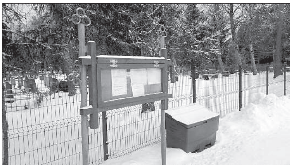
Вокруг Илукстского католического кладбища в прошлом году поставили забор.

Сравнительно новой проблемой для отдельных самоуправлений является нехватка мест для захоронений. До сих пор родственники могут выбрать место для захоронения сами, не согласовав это с самоуправлением. ГК подсчитал, что расширение кладбищ самоуправлениями обойдется до 0,5 млн евро, а создание новых кладбищ – до 1 млн евро.