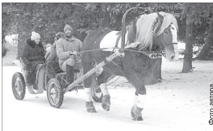
Катание на лошадях обеспечило хозяйство «Klaļumi» из Краславского края.