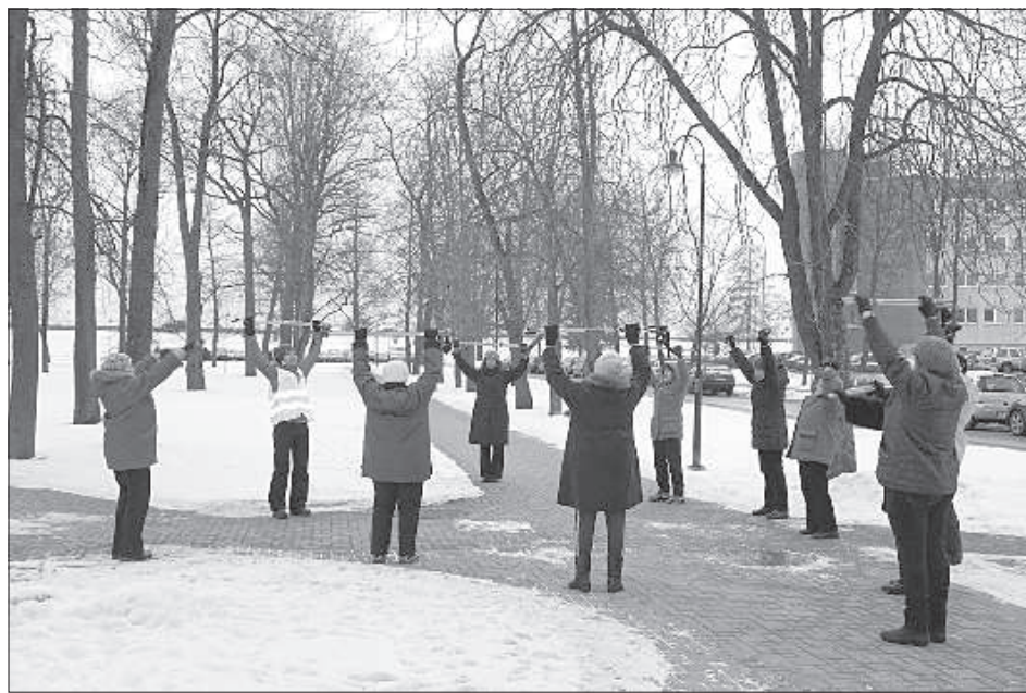
Позитивный настрой при выполнении любого упражнения.

Скандинавскую ходьбу от других видов спорта отличает целый ряд пре-