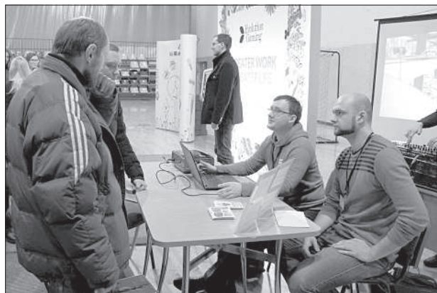
Представители молодежного отдела Даугавпилской думы старались привлечь рабочую силу с помощью видеопрезентаций.

Даугавпилский филиал ГАЗ вводит традицию проводить подобное мероприятие 2 раза в год. Следующая ярмарка труда «Darbs un Karjera 2018» намечена на осень. ■