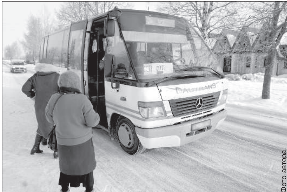
На маршруте Науене — Цирши рейсы можно не закрывать, а лишь изменить время их курсирования.

Рассмотрев предложения, пришлось признать, что во многих случаях с ними можно согласиться. Например, на маршруте Науене — Цирши рекомендовано закрыть рейсы в выходные и в некоторых рейсах изменить время курсирования. На отдельных рейсах пассажиров может быть и не много, но для них доступность об-