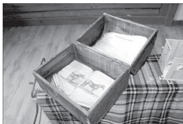
Сундучок с редкими книгами уцелел в пожаре.

миром, весь край пришел на помощь, жители собирали вещи и деньги, самоуправление выделило семье дом. «Даже эти теплые куртки, которые сейчас на нас, предоставила Резекненская краевая дума». В пожаре семья потеряла свой дом, но коношни уцелели, рысаков бросились спасать первым делом. Ни одна из 60 лошадей не пострадала.