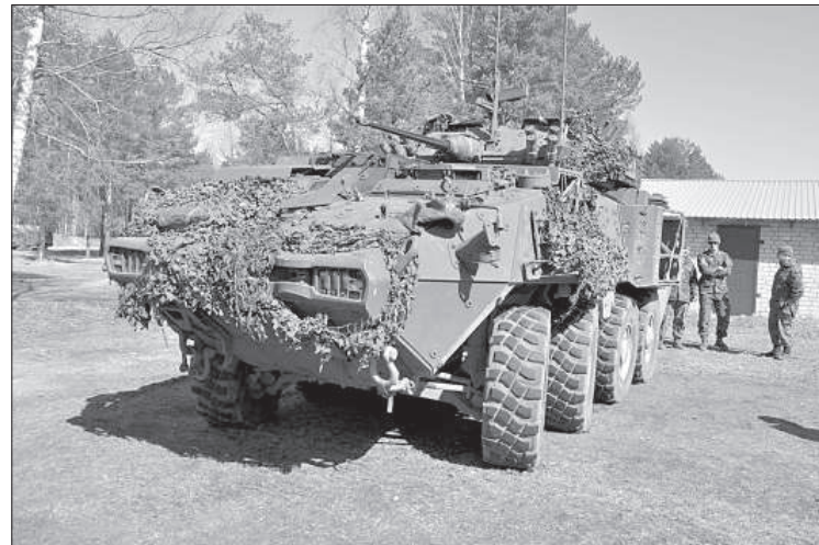
Демонстрация танков, бронированных машин и медицинского транспорта.