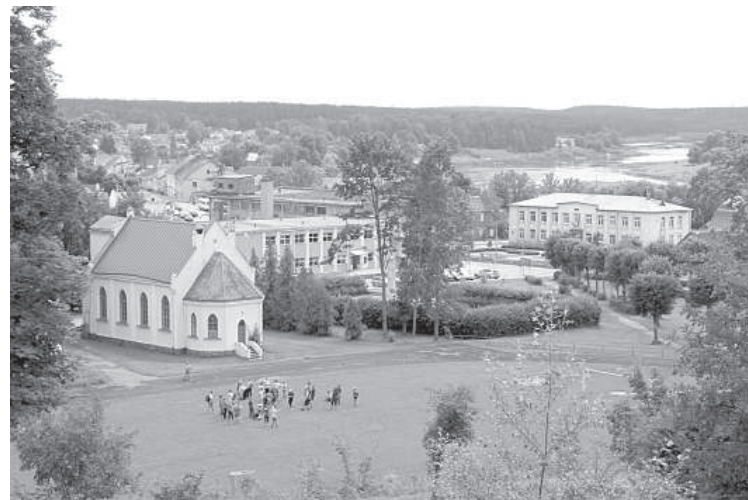
Со смотровой площадки открывается вид на город.