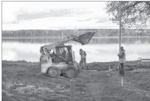
Завершению Стропского променада больше ничего не мешает.

В прошлом году в городе по ряду обстоятельств не были заасфальтированы многие стоянки, а также новый променад вдоль озера Большие Стропы. Теперь строители надеются на скорое начало работ асфальтобетонного завода и возобновление ремонта.