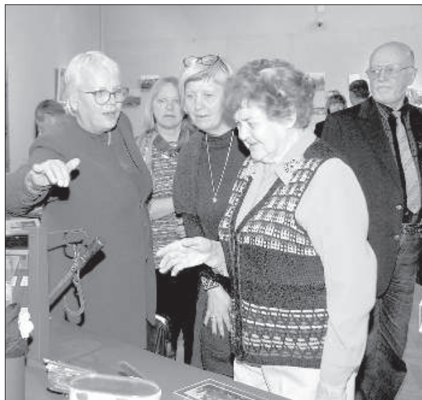
Посетители выставки с интересом слушают истории горожан.

Сама экспозиция выставки весьма символична. Ее автор художница Майрита Фолкмане сказала, что в процессе создания выставки выкристаллизо-