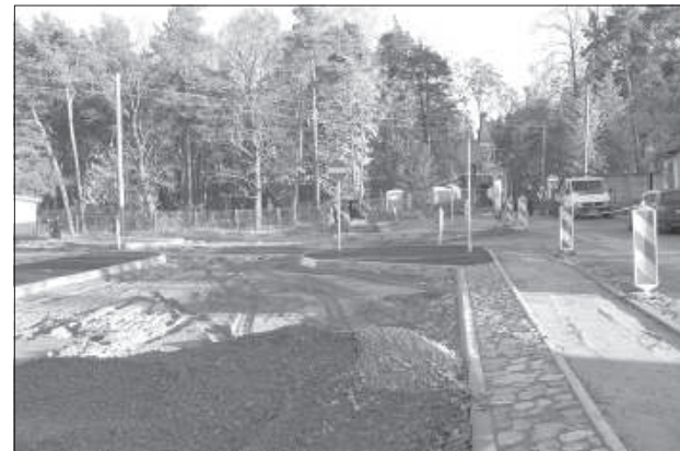
Стоянку на ул. Клуся не могут доделать уже почти 2 года.