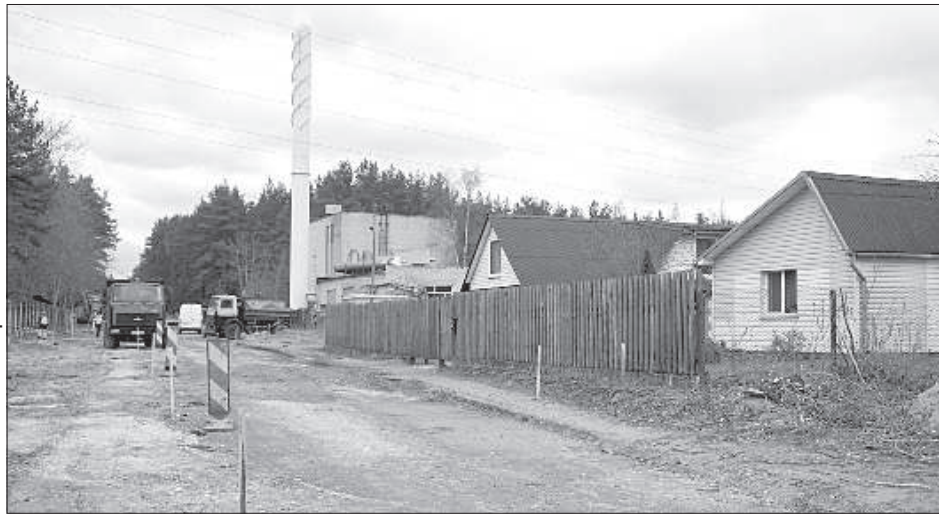
Забор, который стоит на пути строительства, будет снесен.