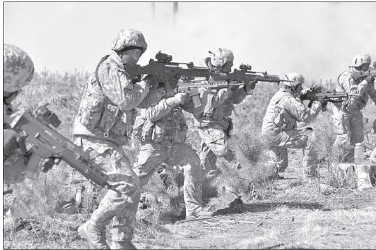
Латвийские и итальянские военные пошли в наступление.

12 апреля в лесах Вабольской волости звучали выстрелы и взрывались учебные дымовые гранаты. Это была одна из совместных операций по военному обучению «Claymore Soaring» боевой группы расширенного присутствия НАТО в Латвии, которую посетили гости – партнеры по сотрудничеству из Латвийской армии и прессы.