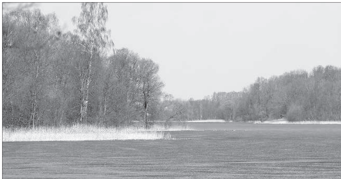
Озеро Бригенес в этом году пополнится мальками щуки.