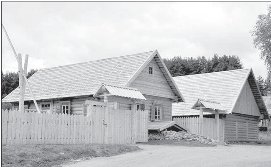
Завершить поездку можно в деревне Слутишки.

Карту маршрута можно посмотреть на сайте www.visitdaugavpils.lv в разделе «Маршруты».