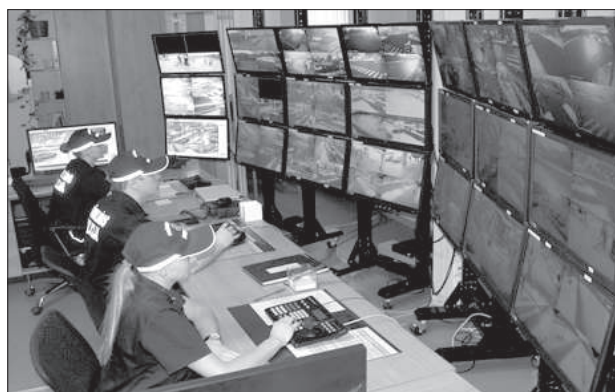
Сотрудники видеопоста ведут наблюдение.

Пока едем на Гриву, полицейские рассказывают о себе. Юрию 27 лет, родом из Зилупе, работает в полиции самоуправления 3 года. В Даугавпилсе закончил институт транспорта и связи, однако найти работу по профессии трудно, да и мало платят. Поэтому подался в ПС: «Это служба для настоящих мужчин.