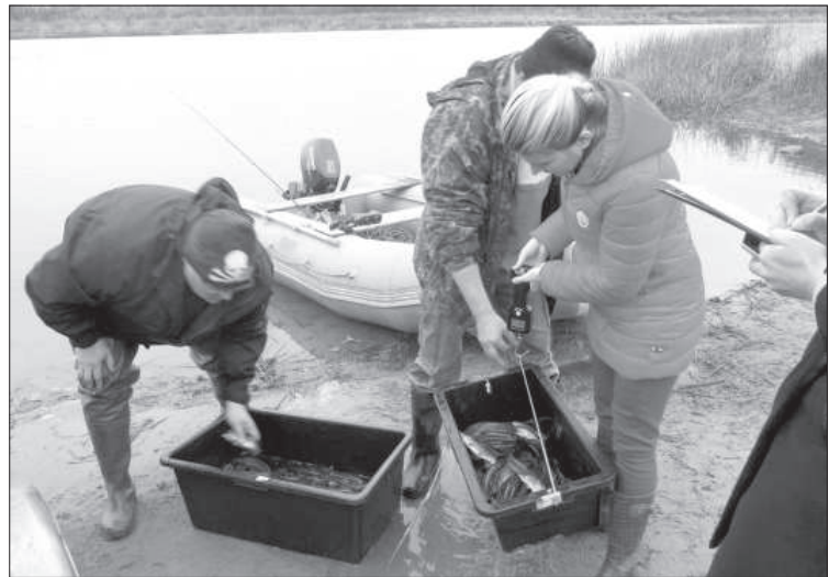
Пополнение рыбных ресурсов в Ливанском крае.

Статистика Латвийского рыбного фонда за 2017 год говорит о том, что латгальские самоуправления и общества успешно реализуют проекты по размножению рыб, финансируемые как фондом, так и самоуправлениями и обществами из доходов за лицензированную рыбалку. Всего из 138 проектов, получивших поддержку, в Латгалии реализованы 29.