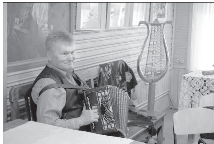
Аkkордеонист Янис Гиптерс.