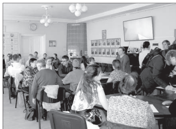
Диктант собирает многих желающих проверить свою грамотность.