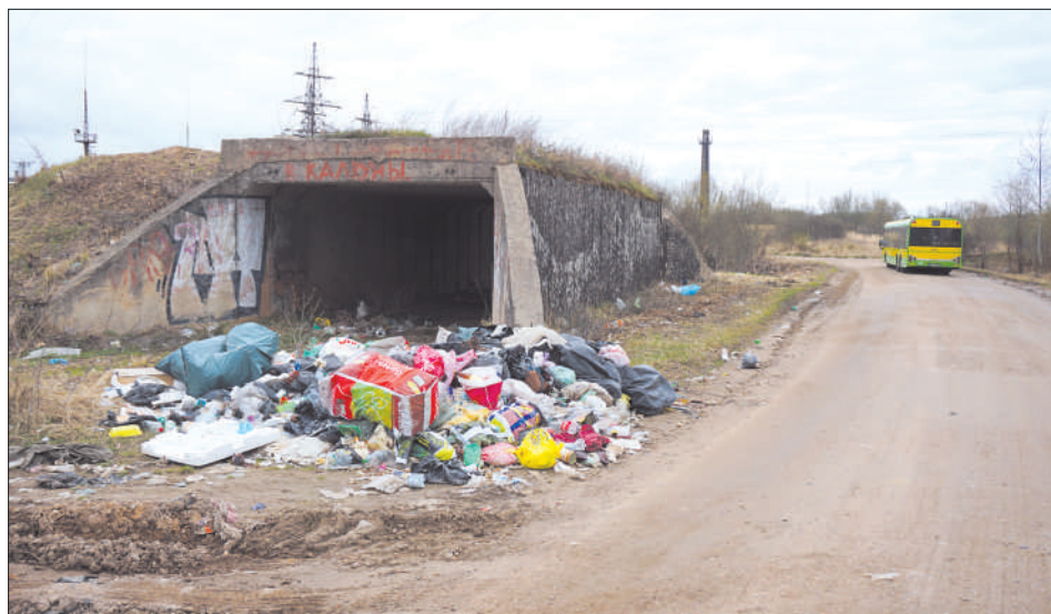
Неизменная свалка бытового мусора в Калкунах около дачного кооператива «Мичуринец».

В преддверии весенней толоки, которая состоится в субботу, 28 апреля, газета «Латгалес Лайкс» устроила «мусорную фотоохоту» в черте Даугавпилса и окрестностях. Побывав в разных микрорайонах, мы увидели самые «живописные» места, которые, возможно, исчезнут после толоки.