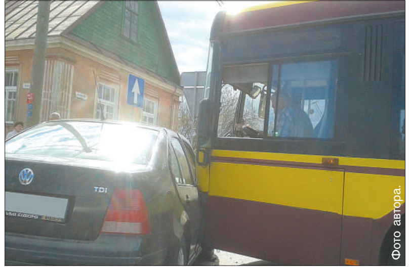
Удар пришелся по правой части легкового авто, поэтому водителю удалось избежать травмы.

Александр Рубе В полдень, 22 апреля, совершая выезд с улицы Амату на улицу Селияс на Гриве, водитель легкового автомобиля «Volkswagen» 1943 г. р. не уступил дорогу и стал причиной столкновения с рейсовым автобусом «Solaris».