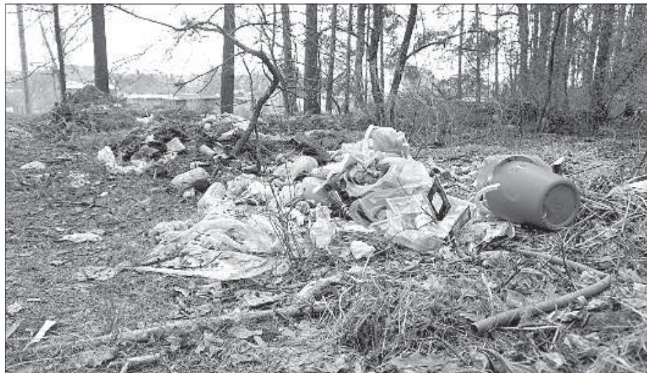
В Ругельском лесу можно найти несколько больших бытовых свалок.