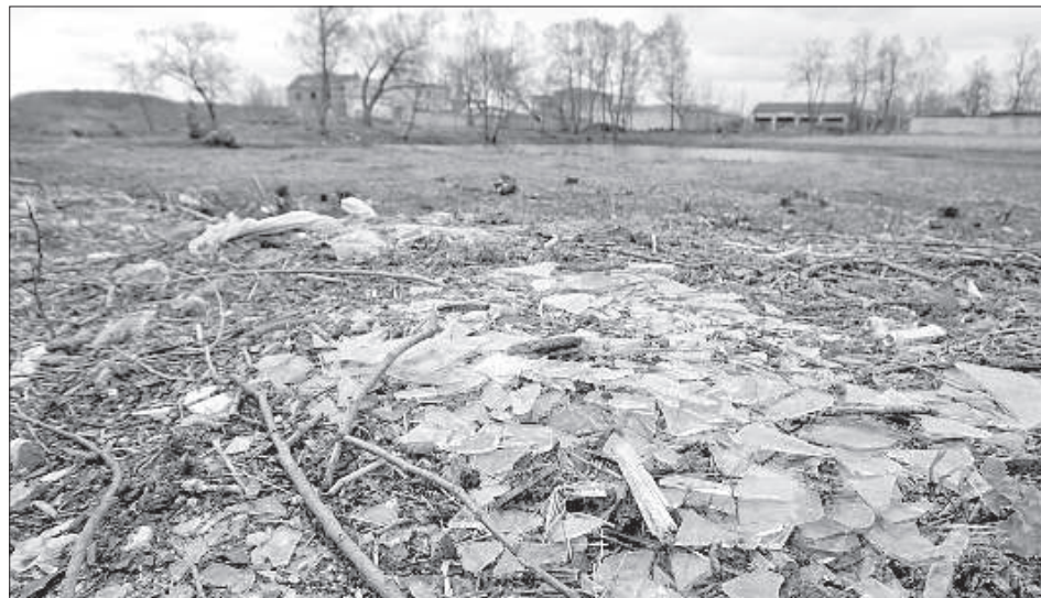
Освобожденная от деревьев и кустов зеленая зона на ул. Лигинишку (Грива) обнажила землю, покрытую битым стеклом и строительным мусором.