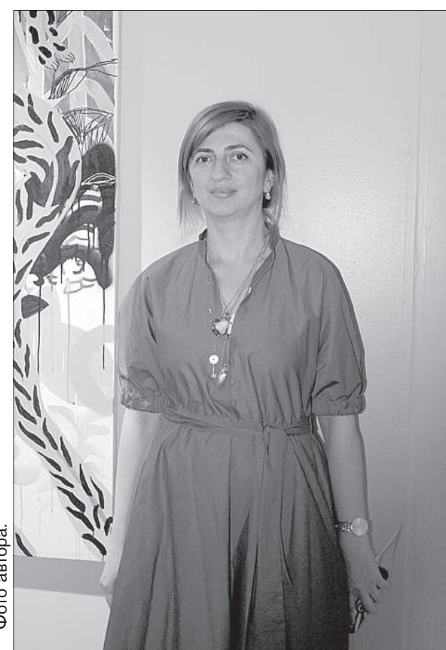
Грузинская художница Русудан Кизанишвили.