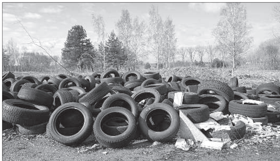
Поле покрышек вблизи улицы Лидотаю за Даугавпилсской крепостью – излюбленное место автомобилистов, которые приезжают сюда на самодельную смотровую яму.