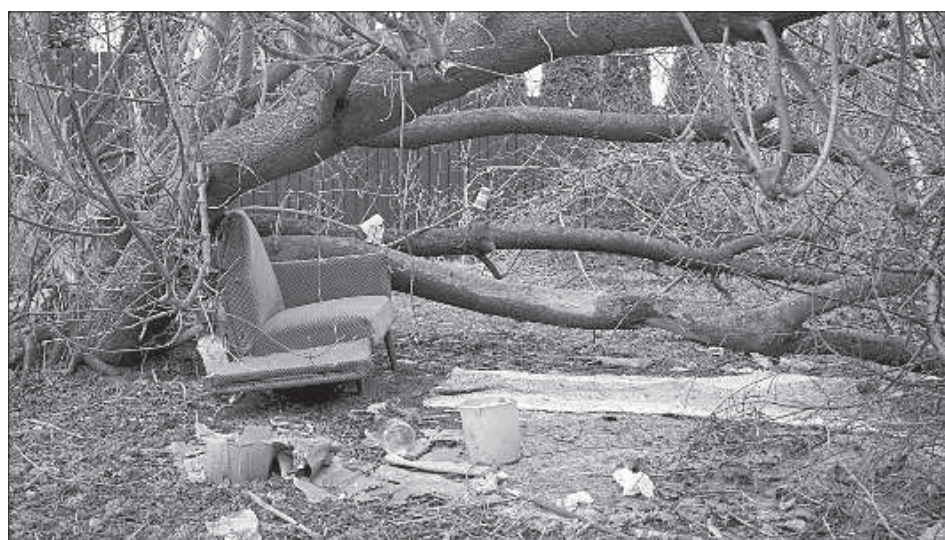
Пристанище бомжей за Даугавпилсской синагогой в центре города.