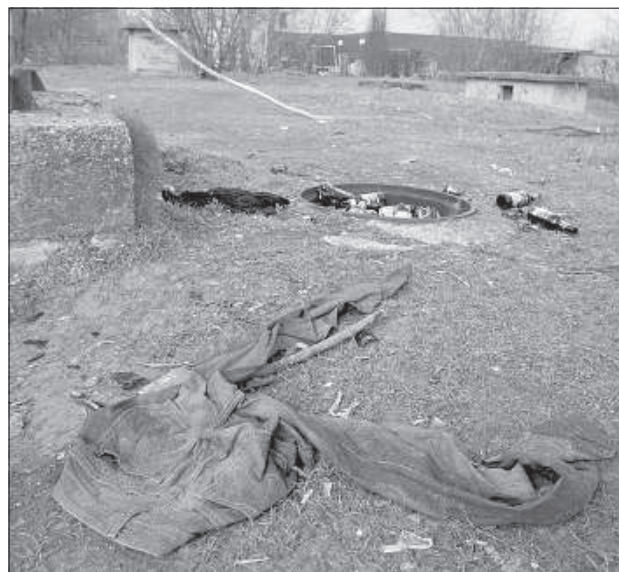
«Алкогольная культура» за Дворцом культуры в микрорайоне химиков.

2 года назад репортер проводил аналогичное исследование человеческого свинства. По сравнению с 2016 годом, ситуация почти не изменилась, хотя налицо приятная тенденция – в тех местах, где вырубают деревья и кусты, мусора становится заметно меньше. При этом по весне разного рода отходы сгорают в результате поджога старника, однако вывоз строительного и крупногабаритного мусора по-прежнему имеет стихийный характер. ■