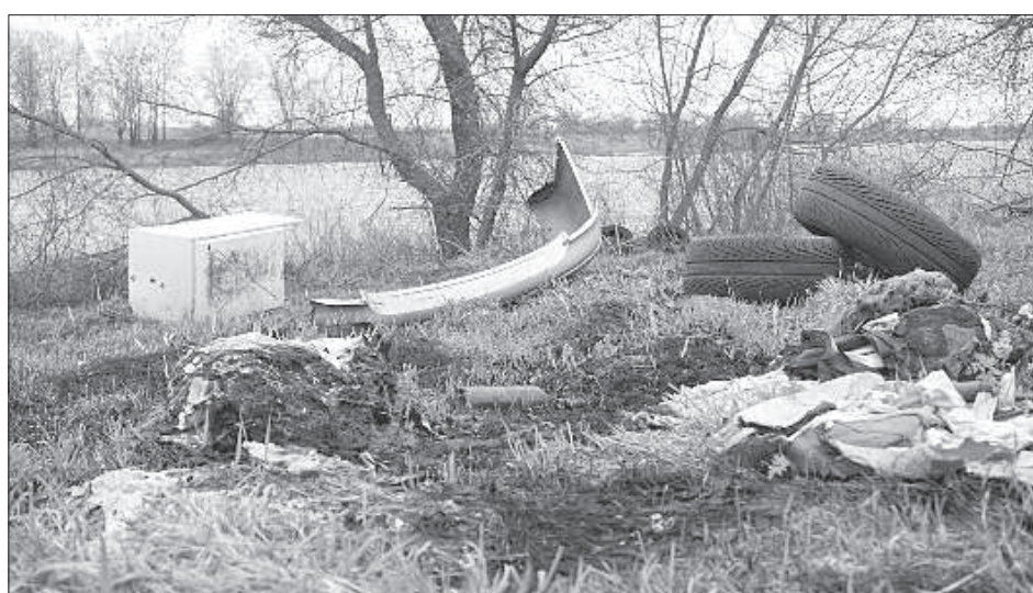
Съезды у Даугавы на улице Лиела (вблизи аэроклуба).