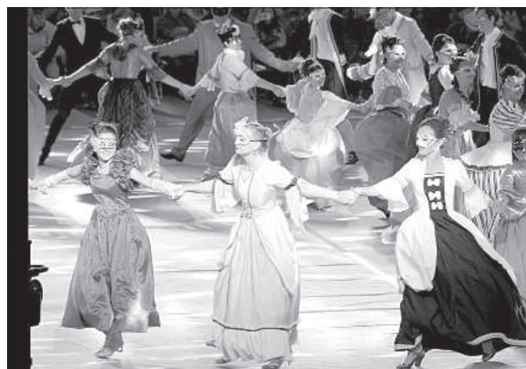
Многообразие костюмов и танцев на балу у Марты.

кровенно разочаровали даугавпилчан. «А где же мыши?», — так был возглас недовольных, решивших посетить Центр летучих мышей, и для этого, по совету путеводителя, прихвативших фонарики. Увлекательного изучения жизни крепостных летучих обитателей не случилось. Огорчил и Дроболитейный завод, где людям предлагали лишь погулять на территории без посещения самых главных объектов — башни и тира. Работники объяснили такой подход большим количеством гостей, а посещение башни рассчитано на небольшие группы, поэтому подробную экскурсию по заводу лучше заказать в любой другой день.