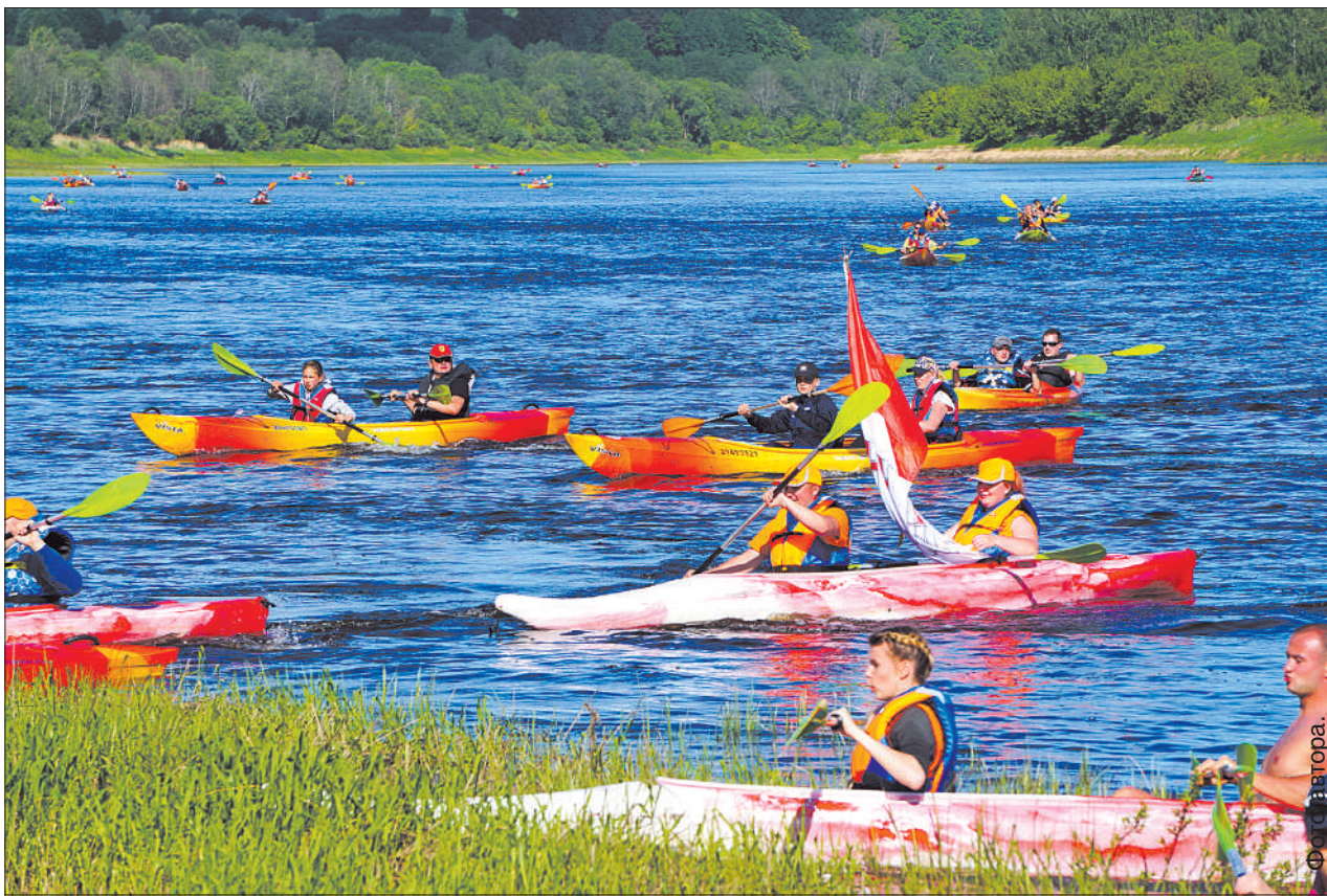
Путь из Краславы в Слутиски в лодках одновременно преодолели более 200 участников.