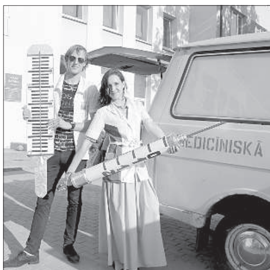
Студенты ДМК знакомят юных посетителей с огромным медицинским инвентарем.