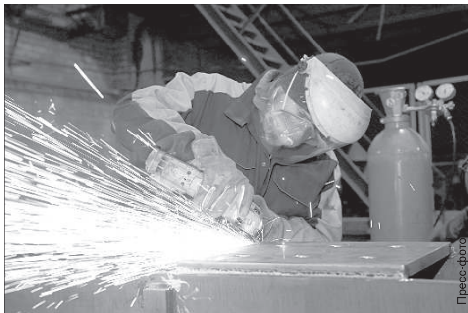
Сварочные и шлифовальные работы.

экспортирует 90% продукции. Входя в цех металлообработки, удивляет, как в производственное помещение можно занести металлические конструкции длиной в несколько десятков метров и плиты площадью с двухэтажный дом. Люди режут, шлифуют, сваривают.