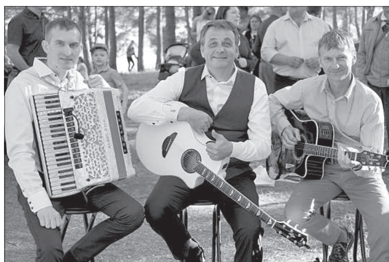
В конце вечера выступила группа «Baltie lāči».

Посетители могли участвовать в различных развлекательных мероприятиях, например, в битве подушками, или испытать силу своего голоса. Вечером