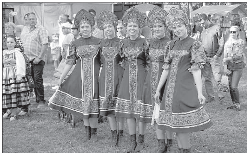
Танцевальный коллектив «Узоры» Центра русской культуры