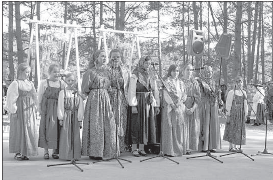
Выступают особые гости праздника – фольклорный ансамбль «Ильинская пятница».