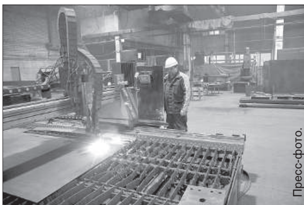
Нарезка металла на плазменном оборудовании.

Спросом пользуется сварка сельхоз техники и дробеструйная очистка металла от ржавчины. Например, металлические стены Ерсикского православного