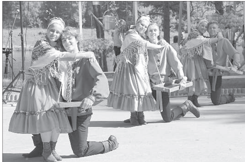
На сцене фестиваля царило радостное настроение.