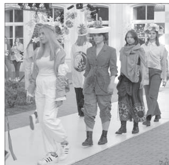
Показ нетрадиционной моды от учеников школы «Саулес».