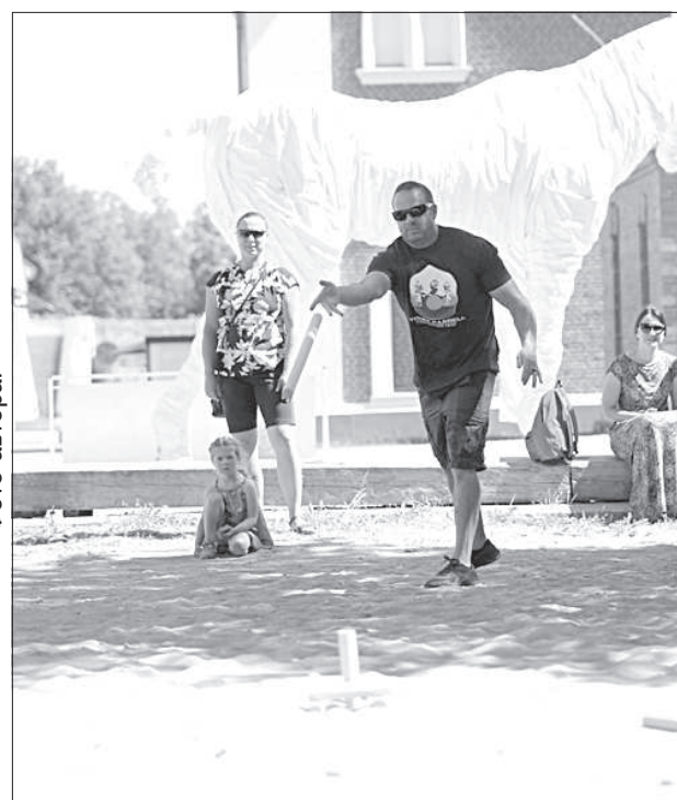
Сбить фигуру с первого раза мало кому удалось.

В этих играх не требуется ничего специального. Во дворе всегда у кого-то был мяч, находился бадминтон, а резиночка – самый простой предмет. Решили вспомнить и показать младшему поколению, что так можно проводить свободное время. Сейчас многие катаются на роликах и велосипедах, а такие простые игры забываются».