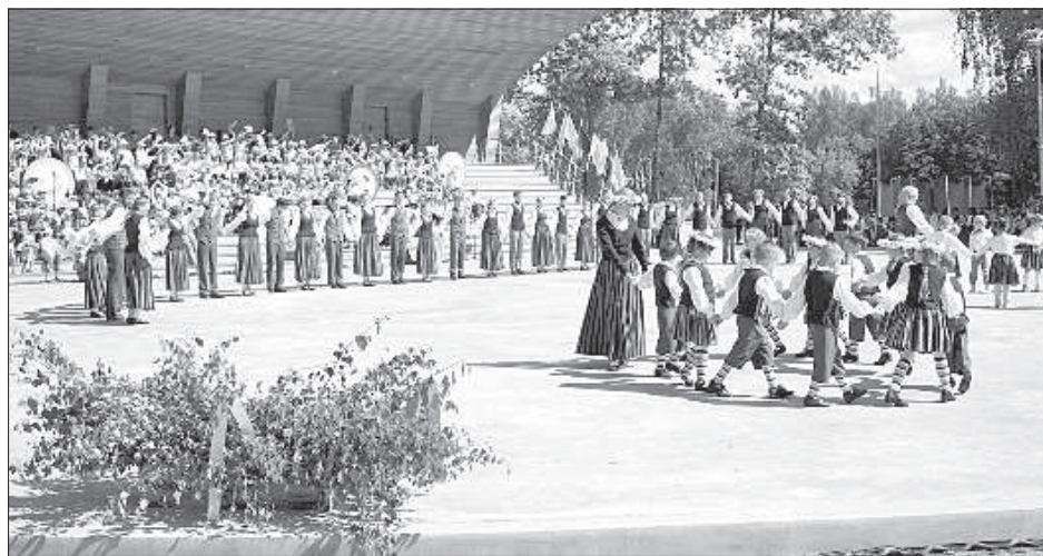
На Вишкской эстраде встретились 720 учащихся Даугавпилсского края.