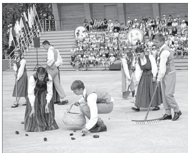
Учащиеся специальных школ подготовили театрализованное представление.

Латвии, и призывала достижения этого года посвятить столетию государства.