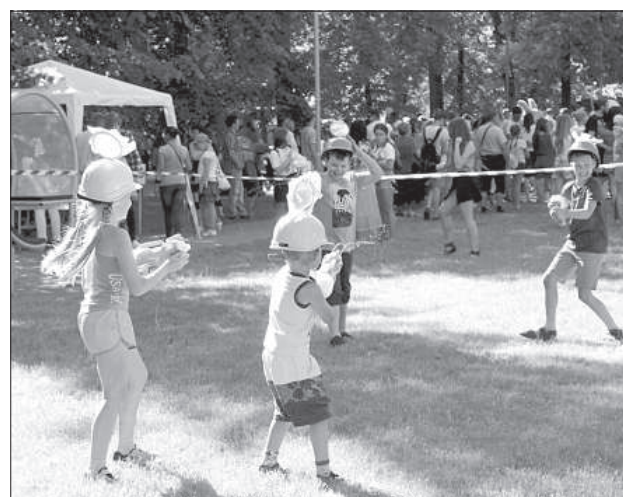
Командные водные стрельбы вызвали у детей особенный восторг.