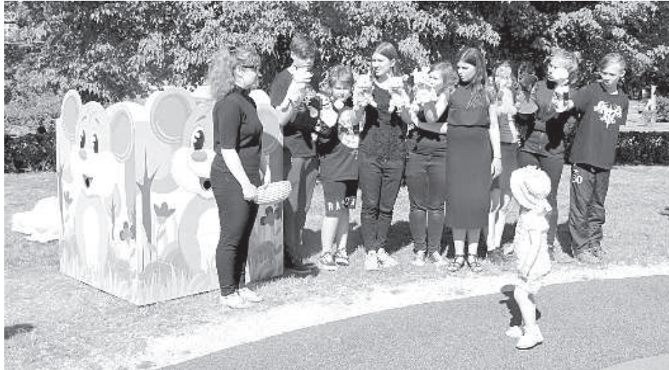
В Центральном парке появилась мышка, помогающую малышам расстаться с сосками.