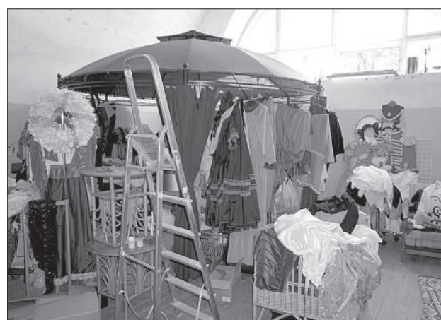
Переезд выставки старинных платьев – в процессе.

7 июня в 18:00 на первом этаже бывшего провиантского магазина Даугавпилсской крепости (ул. Николая, 9) состоится открытие новой студии-салона «Белый конь», в которой будут представлены работы членов Даугавпилсской ассоциации художников. В этом здании практическое применение найдется и для других помещений.