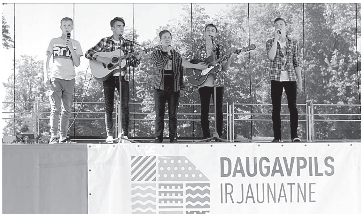
Выступление вокального ансамбля Центра культуры Даугавпилсского края «Vārpa» «Stage On».