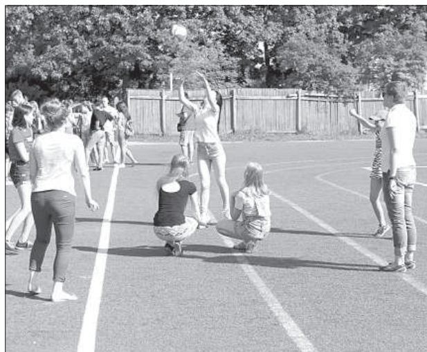
«Горячая картошка» – еще один забытый вкус детства.