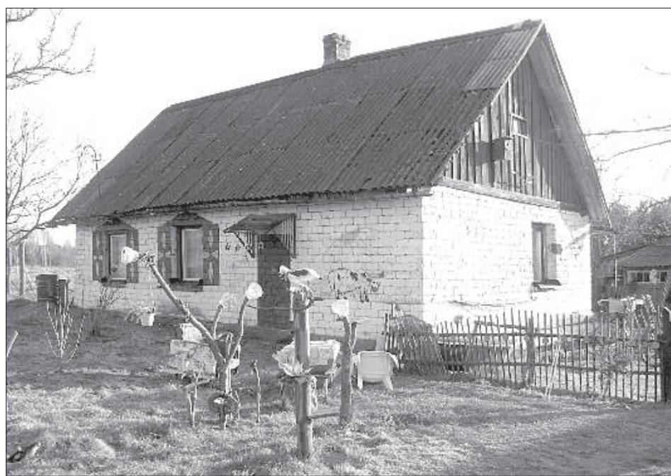
Дом построен руками хозяина.

Спортивные соревнования для собак организует Алуксненское кинологическое общество «REMIS». ■