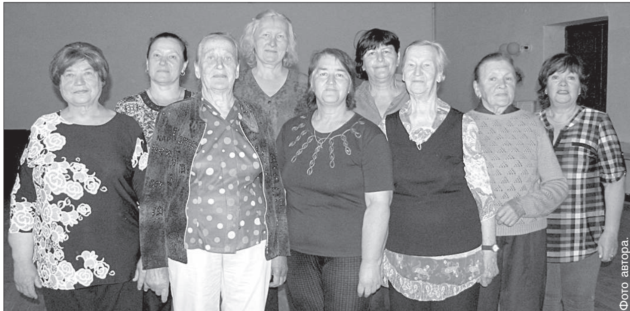
Все певицы — удивительные люди.