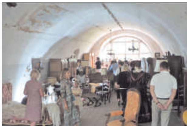
Каждый уголок заставлен мебелью и костюмами.

последних года занимаюсь этим на коммерческой основе. В основном, все наши вещи мы ищем и покупаем у частных лиц в Бельгии, Голландии, Германии и Франции. Причем я беру только качественные предметы и никогда – выброшенные на улицу».