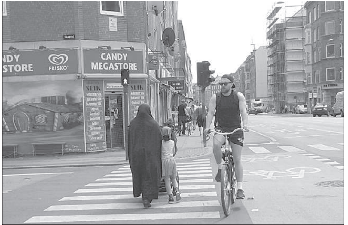
Контрасты района Нерребро.