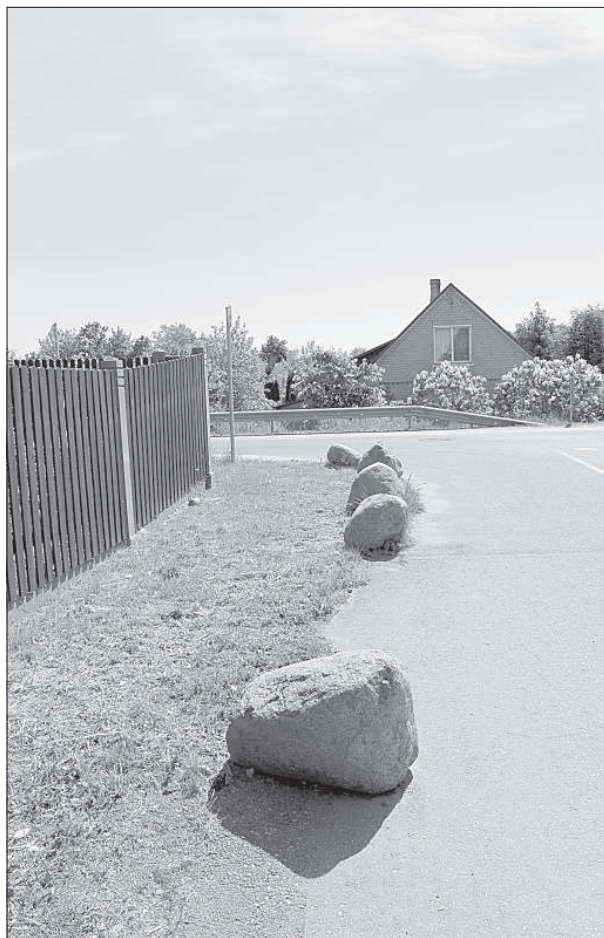
«Каменный» забор на ул. Транспорта.