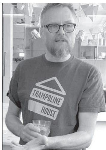
Молтен Голл: «Седативные вещества и марихуана – опасная смесь».

черту отстраненности от датского общества, изоляции. Сделать это не так просто, так как этому препятствуют не только языковые барьеры, но и холодное отношение датчан к представителям других культур. М. Голл отмечает – «Дом-трамплин» помогает беженцам не только изучить датский язык, понять принципы демократии, но что особо важно – развить самоуважение после бегства из своей родины.