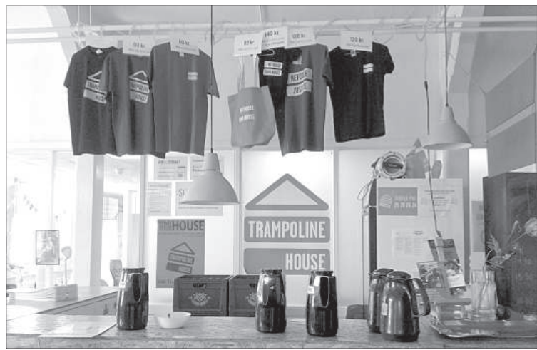
Благотворительный магазин «Trampoline House» – все полученные средства используются для работы НГО.

не сами решают, сколько, когда и каким образом принимать беженцев. Во-вторых, Дания и ранее имела далеко не самый приятный образ страны для мигрантов. Поэтому большинство беженцев рассматривали ее лишь как промежуточный пункт остановки перед намного более лояльной Швецией. В-третьих, дебаты вокруг темы мигрантов в Дании, в основном, строятся вокруг противостояния либералов и консерваторов.