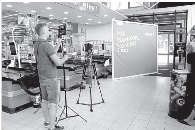
Очереди из желающих передать привет латвийским певцам и танцорам не было.

В преддверии Вселатвийского праздника песни и танца сеть магазинов «Rimi» и TV3 проводит акцию «Передай привет участникам праздника».