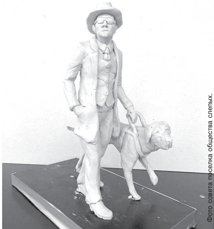
Фото совета поселка общества слепых.