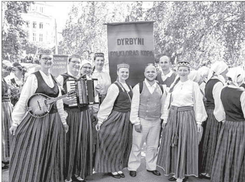
Коллектив Центра культуры Даугавпилсского края «Vārpa» «Dyrbūni» в Риге.

Фестиваль «Baltica 2018», посвященный такому астрономическому событию, как самый длинный день в году, состоялся в этом году под девизом «Янов день. Цветение». Мероприятия прошли по всей Латвии, в том числе в Даугавпилсе и в Дагде.