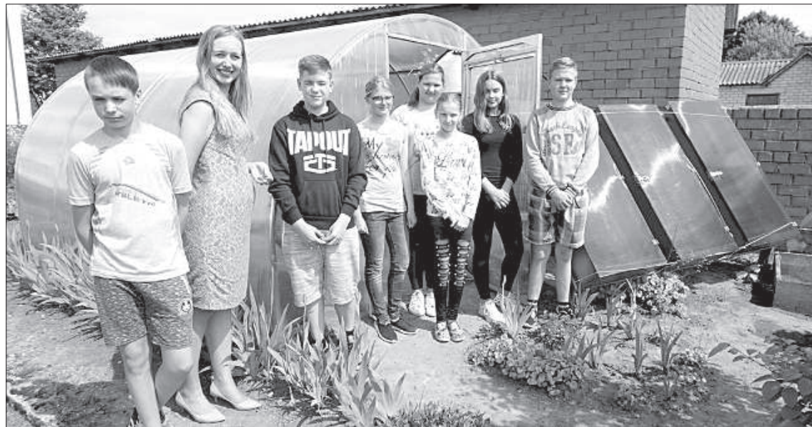
У 14 школьников в рамках проекта была возможность поехать в Норвегию, Кипр, Испанию и Словению.

Практично и без лишнего хвастовства в Пелечской основной школе в течение последних трех лет испробованы разные возможности использования солнечной энергии. Благодаря участию в проекте ERASMUS+ «The Sunny Side Up» со своими идеями учителям и школьникам удалось поделиться своим опытом в поездках по обмену на Кипр, в Испанию, Словению и Норвегию.