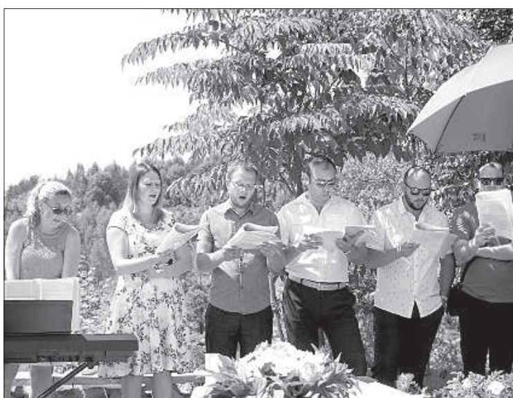
Родители гордятся, что у их детей есть высшее образование в музыке.