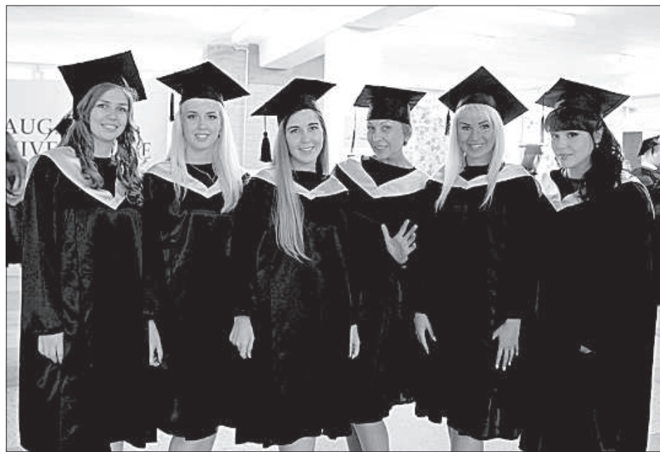
Экономисты в ожидании получения заветного диплома.

Больше всего радости по причине окончания уче-