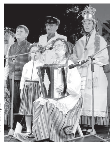
Лиго-песни на языке ливов от рижского коллектива «Livlist».