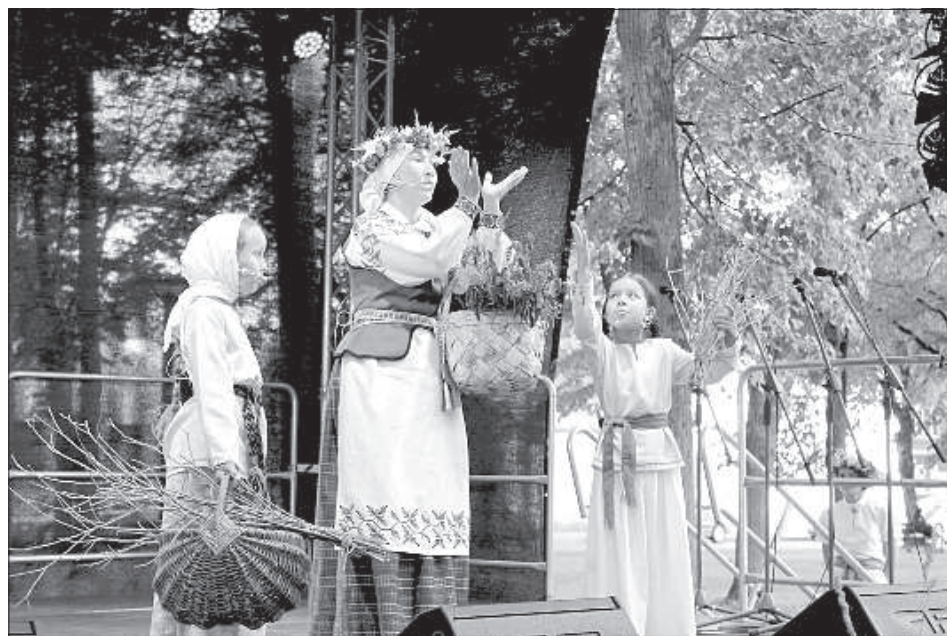
Сценки-юморески от коллектива Центра белорусской культуры «Паулинка».