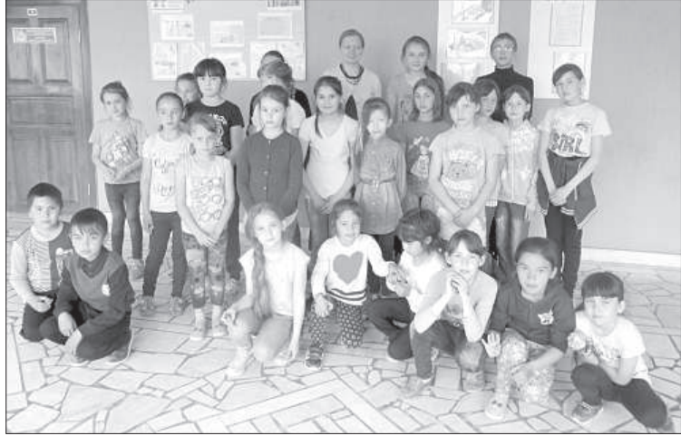
С детьми из школы в деревне Максима Горького после занятия.