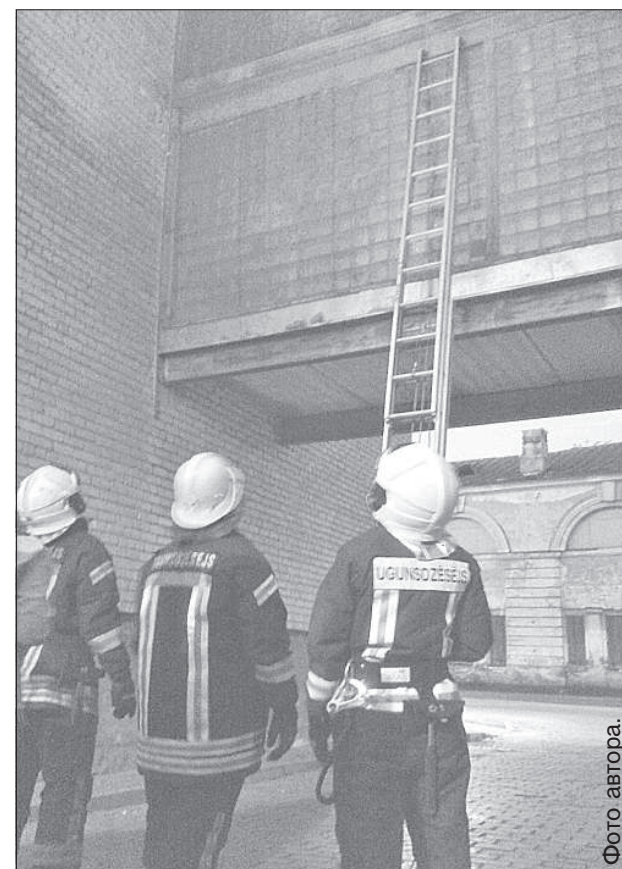
Лестница регулярной пожарной машины оказалась короткой.

ления одного несчастного стрижа. Ведь пока специалисты выполняют эту задачу, где-то может произойти трагедия, и транспорт попросту не успеет на более важный вызов. Тем не менее, перевес оказался на стороне друзей природы, а птичка была быстро освобождена под громкие аплодисменты собравшихся. Жильцы дома пообещали, что свяжутся с предприятием жилищно-коммунального хозяйства и попросят о том, чтобы защитная сетка была зафиксирована иным образом. В противном случае, новых жертв избежать вряд ли удастся. ■