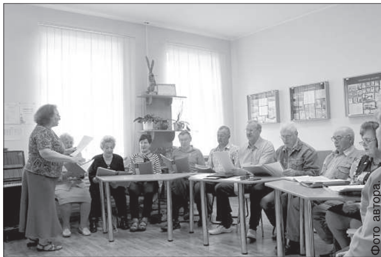
Репетиция ансамбля «Sudraba ābele».

Общество «Sudraba ābele» официально было зарегистрировано в 2006 году. Но, по словам его председателя, существует оно намного дольше, долгие годы в городе действовал клуб пенсионеров-педаго-