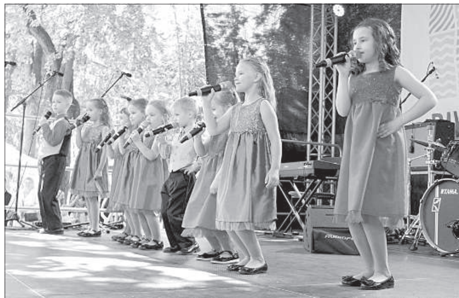
Младшая группа «Pērlītes» на прошедшем празднике города.