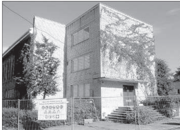
Боксерский зал на ул. Циетокшня, 61.

● Сохранить ранее заявленную сумму на разра-