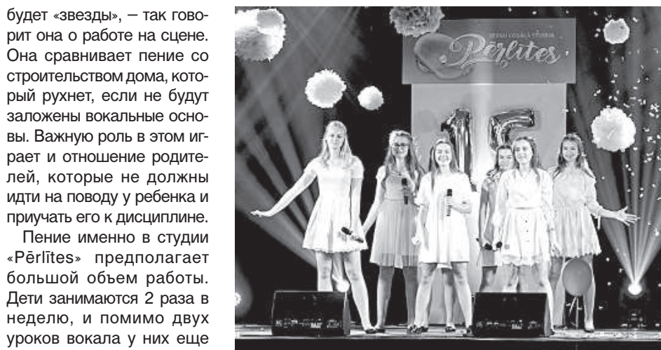
Выступление средней группы студии на праздновании пятнадцатилетия «Pērlītes».