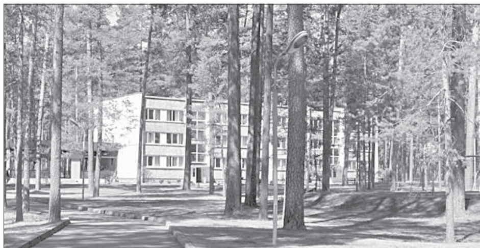
Спортивная база «Дзинтариныш» (ул. Кримулдас, 41).