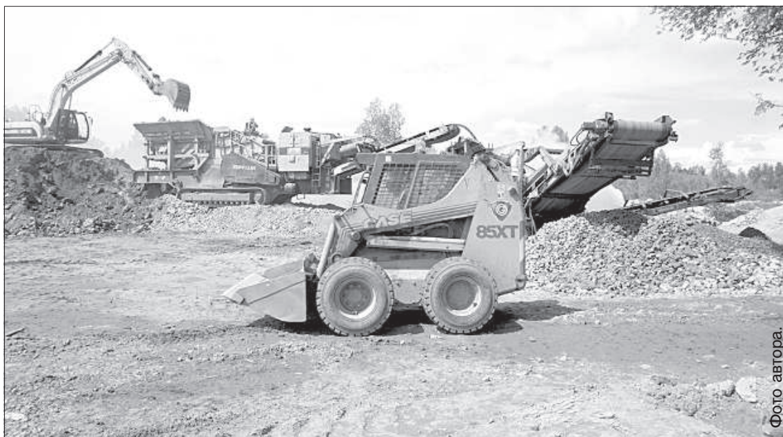
«Latraps» уже начал возводить свой комплекс в микрорайоне Крыжи.