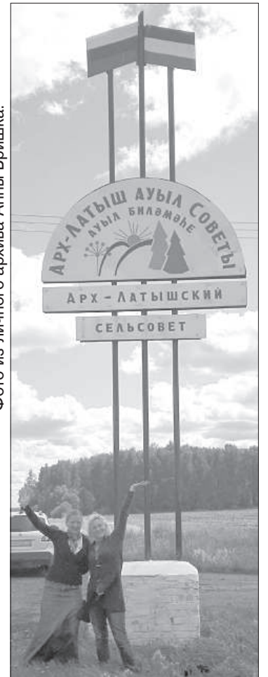
Дорожный знак вблизи деревни Максима Горького свидетельствует о прежнем названии поселка.

ка. Установить этот рекорд помогла и делегация из поселков Максима Горького и Бакалдина, где были представлены латыши, одетые в народные костюмы разных краев Латвии. Анна в Уфе представляла Латвию в народном костюме Видземе. Интерес окружающих был огромный, поскольку латышские народные костюмы очень отличаются и выделяются.