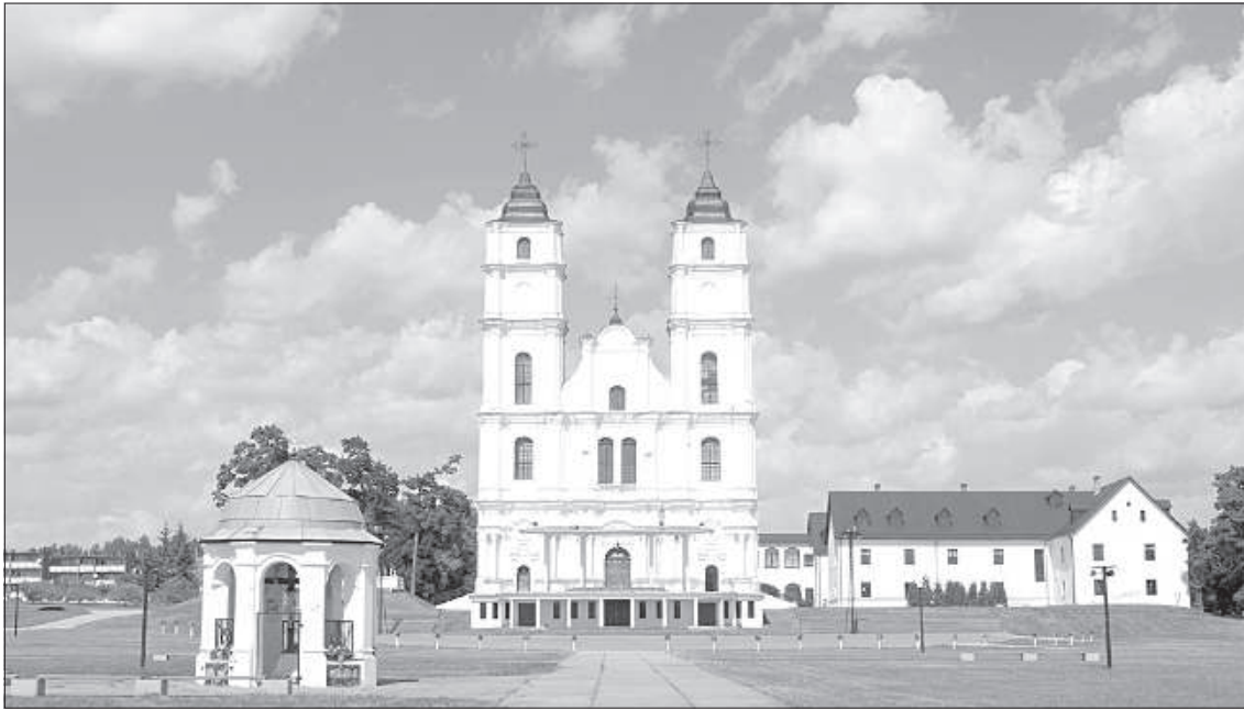
Аглонская базилика Вознесения Святой Девы Марии в ожидании высокого гостя.

Так как мероприятие представляет особенную важность не только для страны, но для