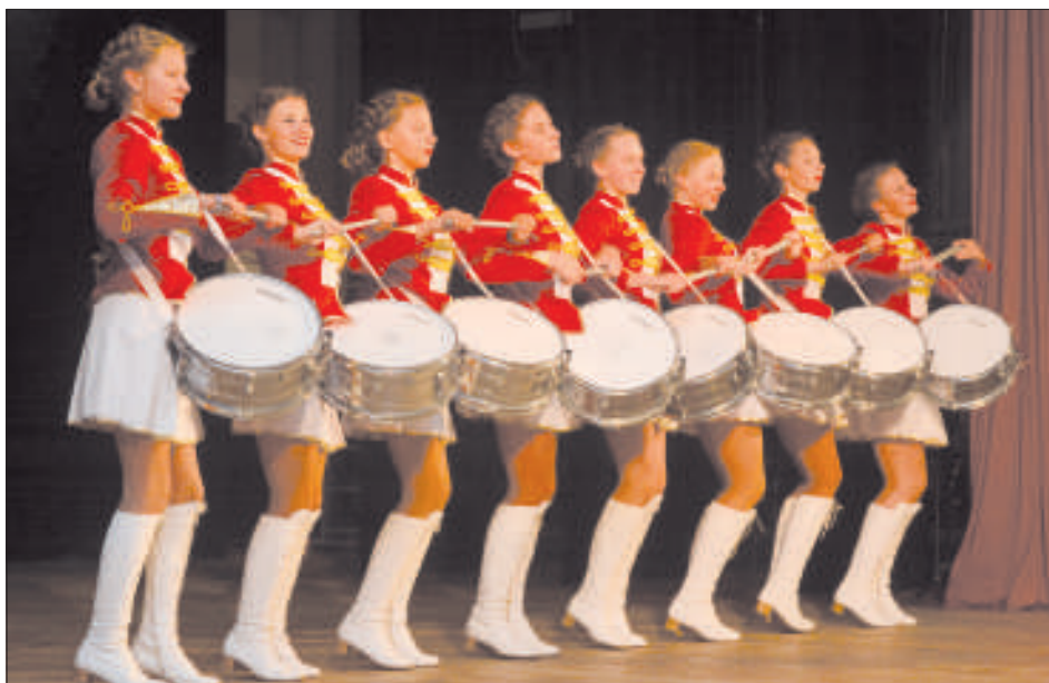
Прием сопровождался выступлением ансамбля барабанщиц из Браслава.