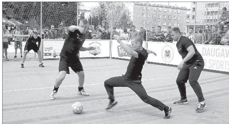
На поле команды «Devona» и «Safe 17».