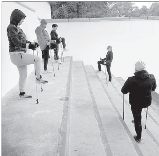
Занятие по скандинавской ходьбе.