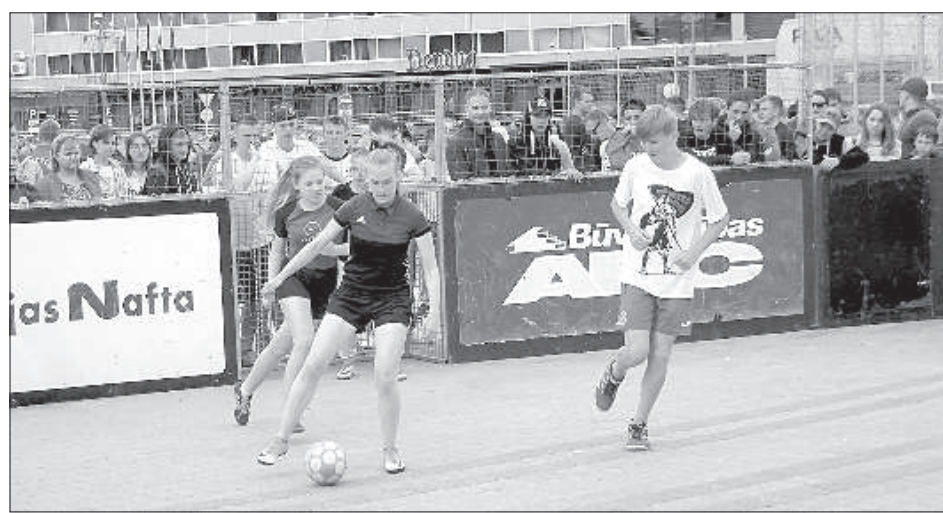
Единственная команда девушек «Акулы-сухопутки» получила широкую поддержку публики.