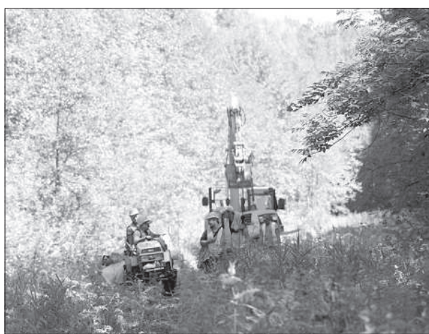
Работники предприятия «Сопехус» в зоне сервитута.

пользования тракторной колеи, которая визуальнo находится на стыке зон сервитута и частной собственности.