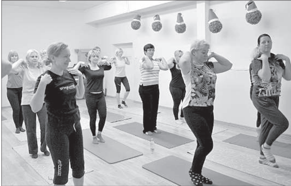
Если расширить реабилитационное отделение, занятия гимнастикой можно устраивать отдельно для женщин и мужчин.