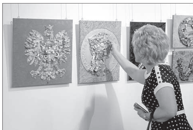
К «Культурному коду» можно прикоснуться.