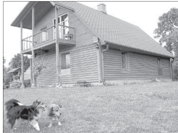
Этот дом супруги строили своими руками.

швец, и жнец, и на дуде игрец. Весь диковинный уличный интерьер – фигуры людей и зверей, вырубленные из дерева, прочие поделки и хозяйственные сделаны руками Петра.