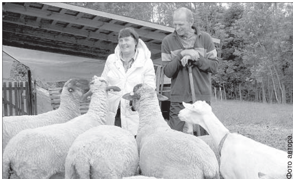
Овцами занимаются оба хозяина.