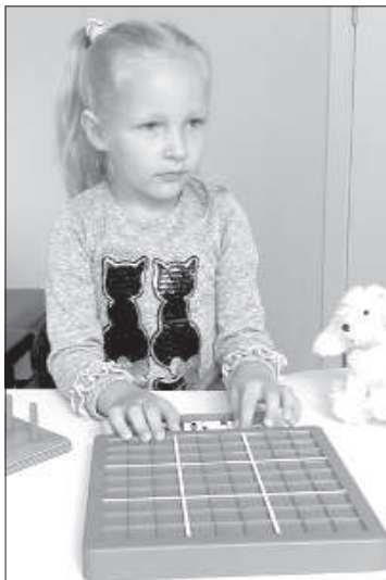
Высоту стола в кабинете эрготерапевта можно регулировать.