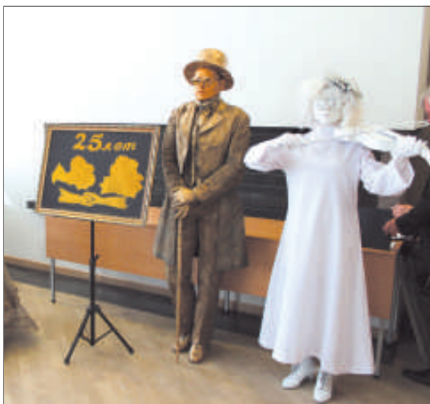
Браславские «живые» скульптуры и подарок – картина, созданная у всех на глазах.

Все присутствующие отметили огромную работу, проделанную консульством как в Даугавпилсе, так и во всей Латгалии. За 25 лет между Латвией и Республикой