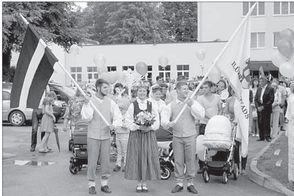
Первыми за флагами Латвии и края в шествии отправились самые маленькие жители Илукстского края.