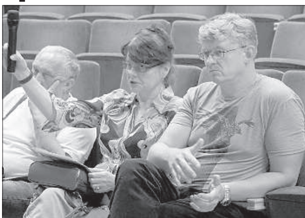
Жителей с улицы Яньогу интересовал вопрос сохранения подъездных дорог.

Часть присутствующих выступила с критикой всего проекта. По их мнению,