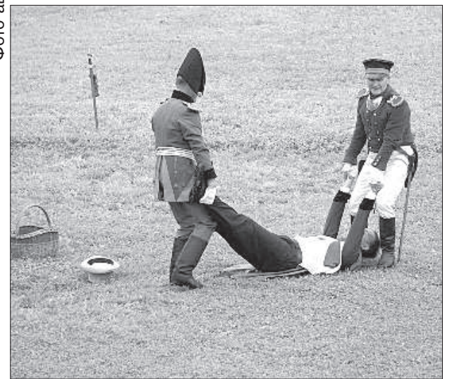
Дуэль на пистолетах: обидчик пал от пули офицера.