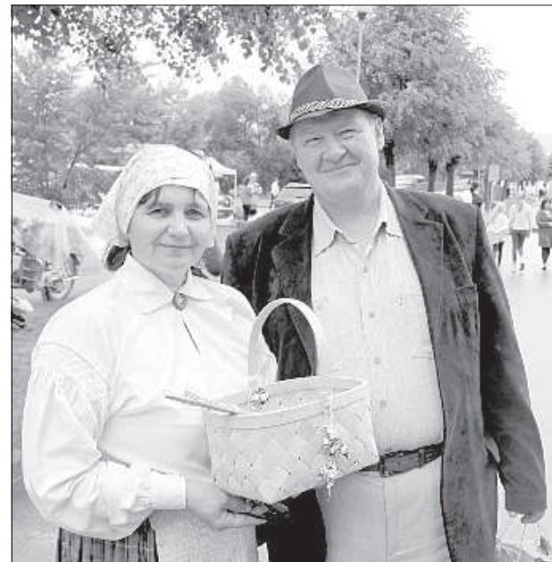
Участники любительского театра Илуксте позаботились, чтобы каждый посетитель ярмарки выиграл «свое счастье».

В рамках праздника состоялось третье туристическое ралли «Иное путешествие». Оно завершилось на эстраде, на которую после награждения самых быстрых и удачли-