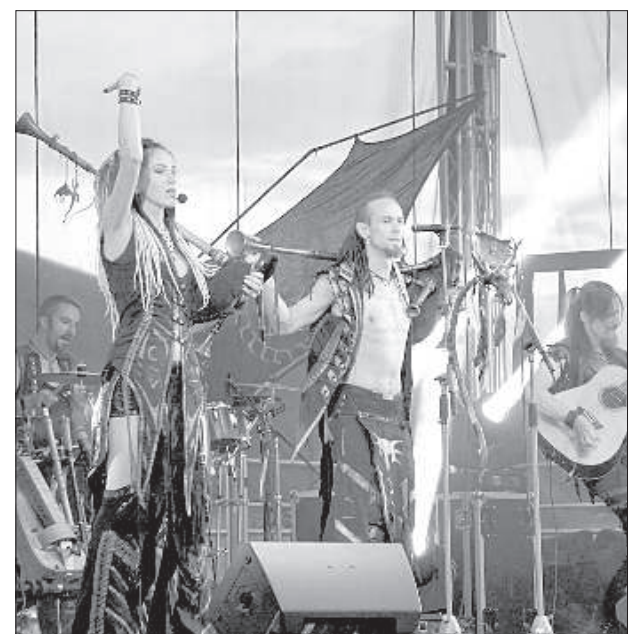
Группа «Irdorath» устроила зажигательный вечер тяжелой фолк-музыки.