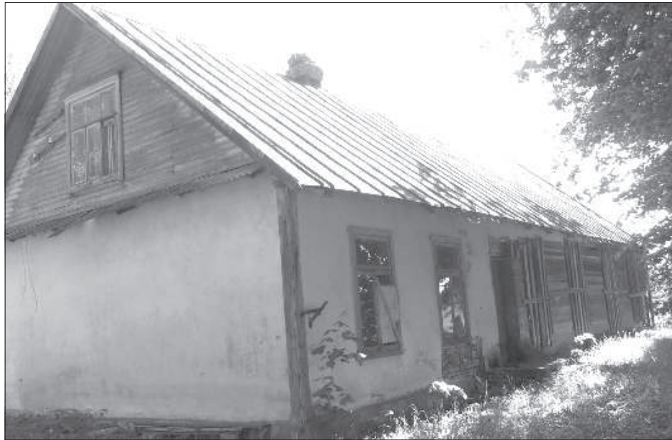
Здесь был магазин.