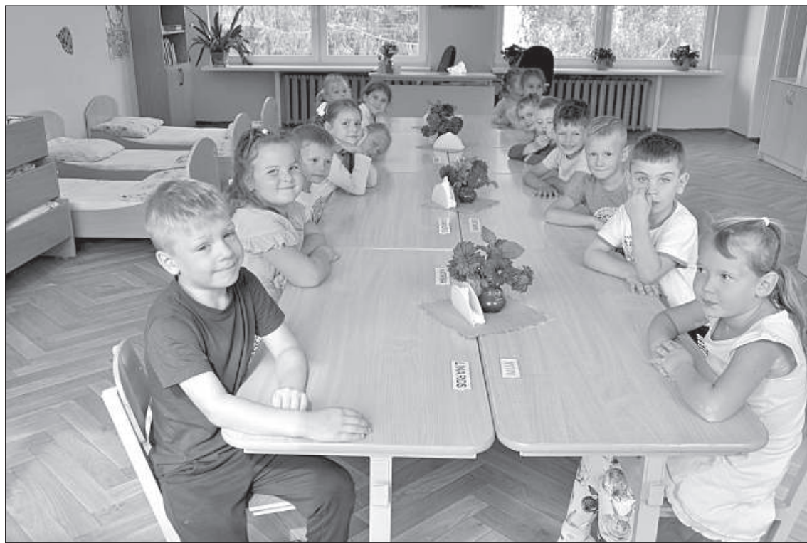
Выпускники ницгальского детсада «Sprīdītis» будут учиться в школах других волостей.