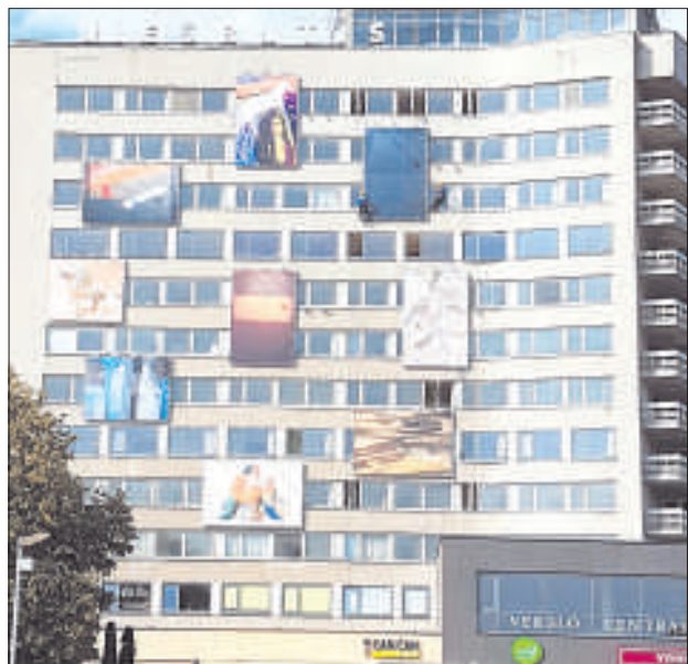
Фото Центра искусств Марка Ротко.

Сегодня, 7 сентября, в Паневежисе откроется необычная выставка – на фасаде здания бывшей гостиницы будут экспонироваться работы девяти мастеров, непосредственно связанных с Даугавпилсом.