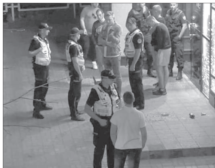
Фотокадры из видео очевидцев.