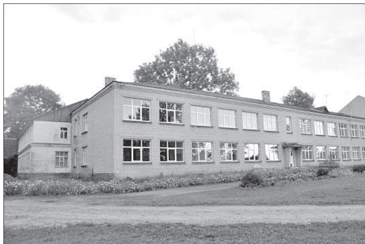
Здание Аулейской основной школы ждет покупателя.

Жительница Ницгале, внучка которой учится в другом крае, сказала, что государство, финансирующее зарплаты педагогов, должно взять на себя обязанности по содержанию школ, иначе село останется без школ, и война самоуправлений за учеников никогда не закончится.