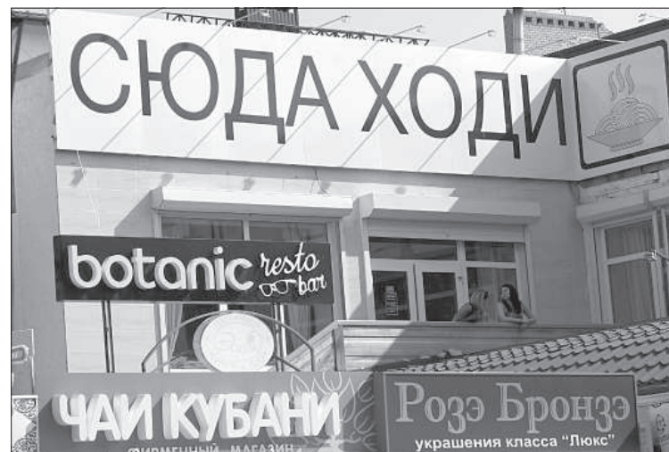
Названия некоторых магазинов восхищают.

На латвийско-российской границе хорошие впечатления от поездки подпортил наш чрезмерно добросовестный таможенник. Он обыскал машину, нас – с головы до ног, заставил вывернуть наизнанку сумки и карманы... Добро пожаловать домой. ■