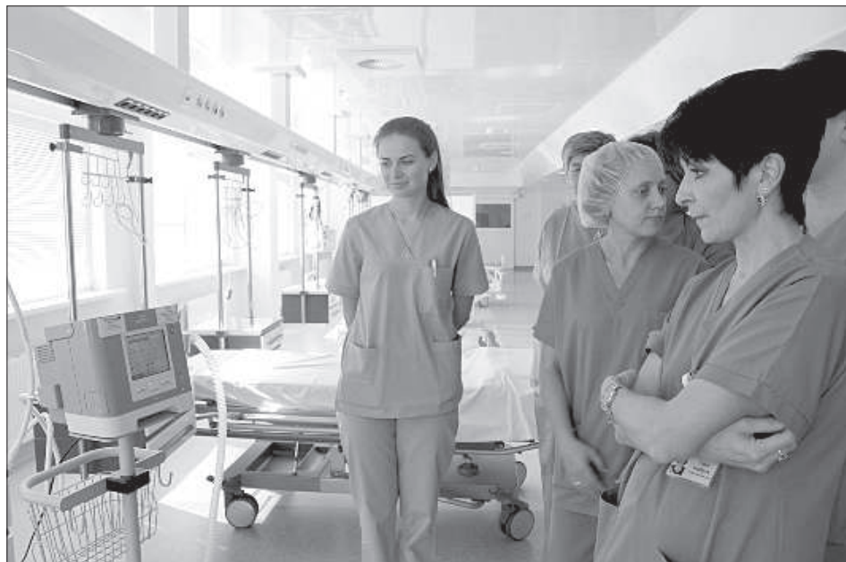
Персонал отделения интенсивной терапии знакомится с устройством и работой портативного аппарата для искусственной вентиляции легких.

автоматического измерения свертывания крови позволяет достаточно быстро установить состояние гемостаза пациента перед, во время и после операции. Наличие подобного анализатора особенно важно в случае большой кровопотери у пациента, например во время родов, тяжелых обширных травм и т. д. «Результат проб крови при использовании тромбозластометра готов в течение 10 минут, — рассказывает о действии прибора Анатолий Туронк. — В то время как лабораторный анализ крови может занимать от 30 до 40 минут, которые могут стоить жизни человека». Благодаря скорости получения анализа крови врач, в свою очередь, своевременно может реагировать и контролировать состояние пациента, назначая соответствующие препараты: для разжижения крови или наоборот.