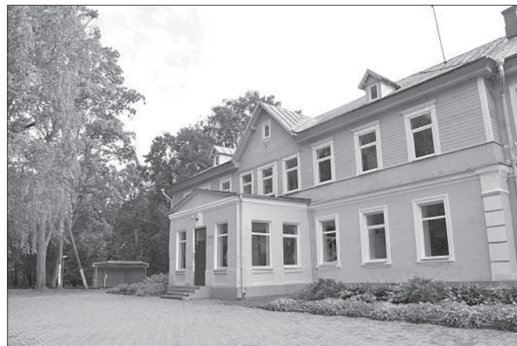
Таборская основная школа стала общественным центром.