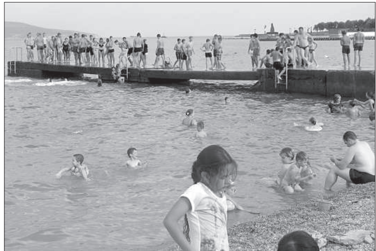
На пляже в Новороссийске.

Одно дело съездить в Европу, где, пересекая границу одной страны, сразу и не поймешь, что попал в другую. И совсем иное отправиться в Россию, во многом непредсказуемую и агрессивную, как считают во многих странах. Автор пробыл в России почти два месяца и вернулся с массой приятных и не очень впечатлений.