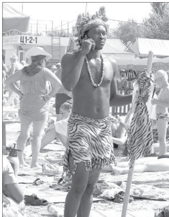
Чернокожий студент предлагает сфотографироваться.