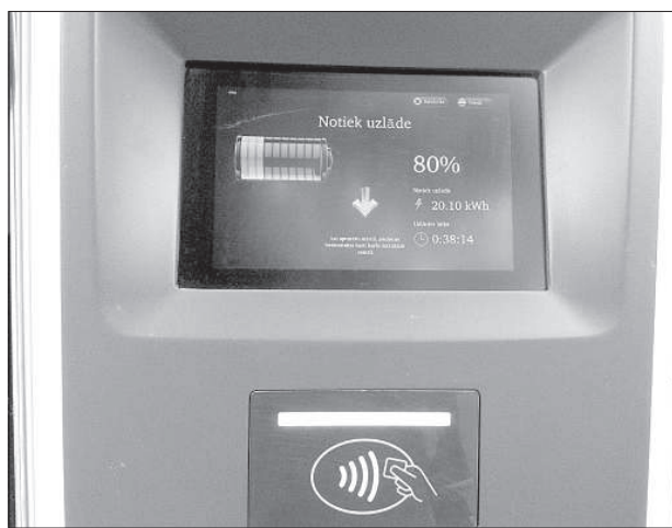
Терминал станции подзарядки.