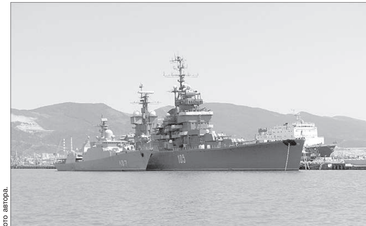
Новороссийск. Крейсер «Михаил Кутузов» – корабль-музей.