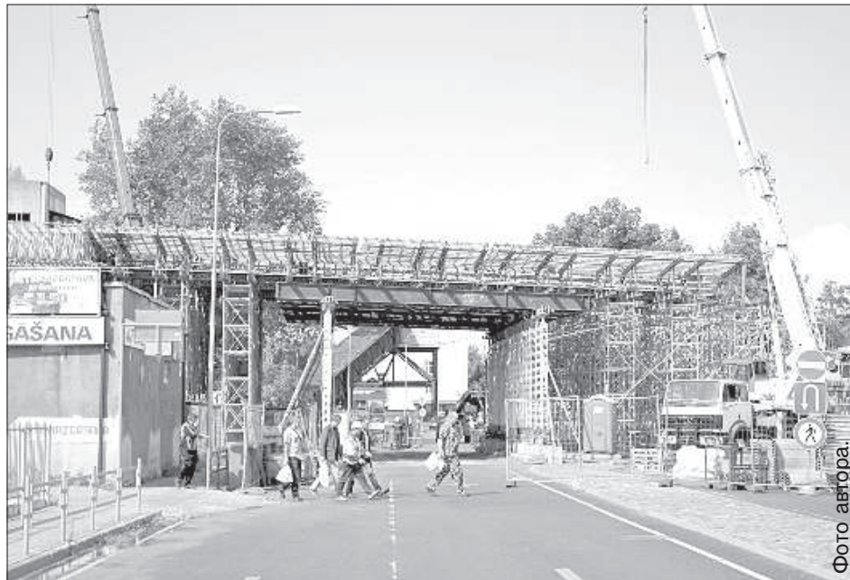
Процесс строительства – вид с улицы Варшавас.

Литовское предприятие тогда отметило, что их инженеры-сметчики не учли факт увеличения взноса социального страхования в Латвии и роста цен на металлические конструкции. Новая смета подразумевала удорожание их части проекта на 1 млн евро. Со своей стороны второго исполнителя работ SIA «Binders» также могли возникнуть финансовые трудности. Причина тому – промедление при строительстве окружной дороги у города Пярну