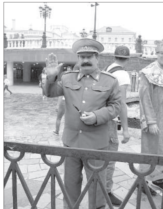
На Красной площади в Москве встречает товарищ Сталин.