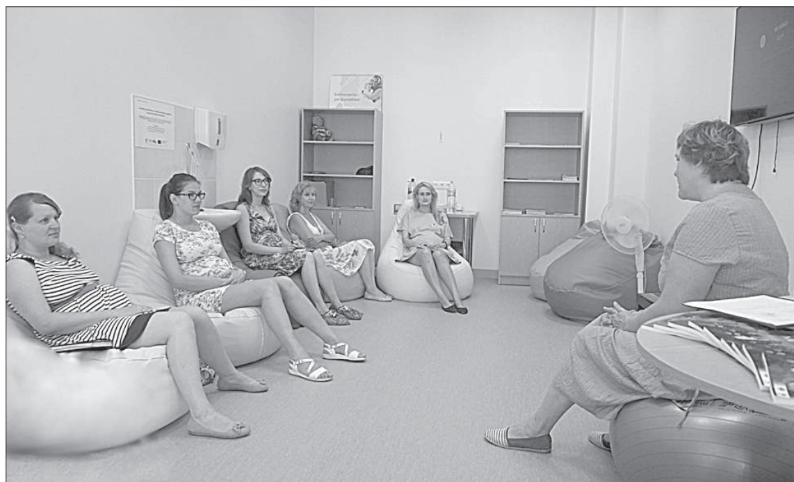
Недавно поменяли помещения для занятий.

Школа будущих мам в Даугавпилсской региональной больнице работает полтора года. В январе было подсчитано, что за первый год школу посетили около 300 будущих мам. Это почти третья часть принятых в Даугавпилском родильном отделении родов в 2017 году.