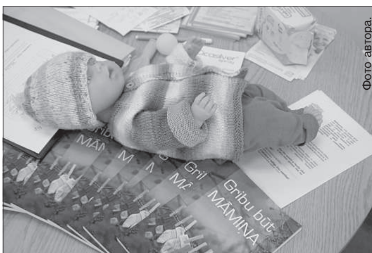
Для показательных выступлений используются куклы.

«Главное, чего хотим добиться этими занятиями — снизить чувство страха родов», — акушерка заметила, что даже вскользь услышанный совет зачастую осень полезен. Целью сотрудников также является способствовать узнаваемости отделения и созданию положительной репутации. И. Жилвинска слышала фразы: «раньше роды принимали хуже, теперь лучше», но она считает, что изменились не медики или пациенты, а отношение к родам. Оно стало более открытым, но в то же время более интимным событием в семейной жизни.