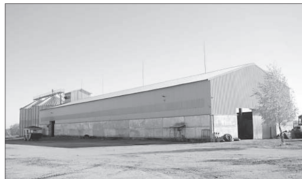
Ангар создан на базе бывшего аэродрома сельскохозяйственной авиации.