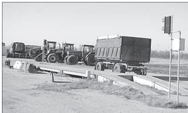
Новые технологии позволили не утратить темп после расширения.