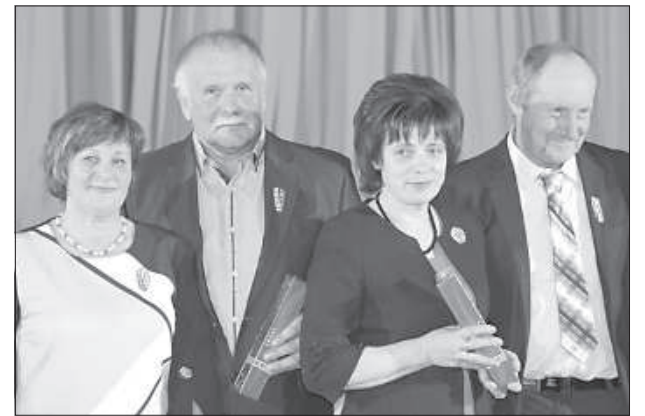
Крестьян чествовали за их самоотверженный труд на протяжении многих лет.