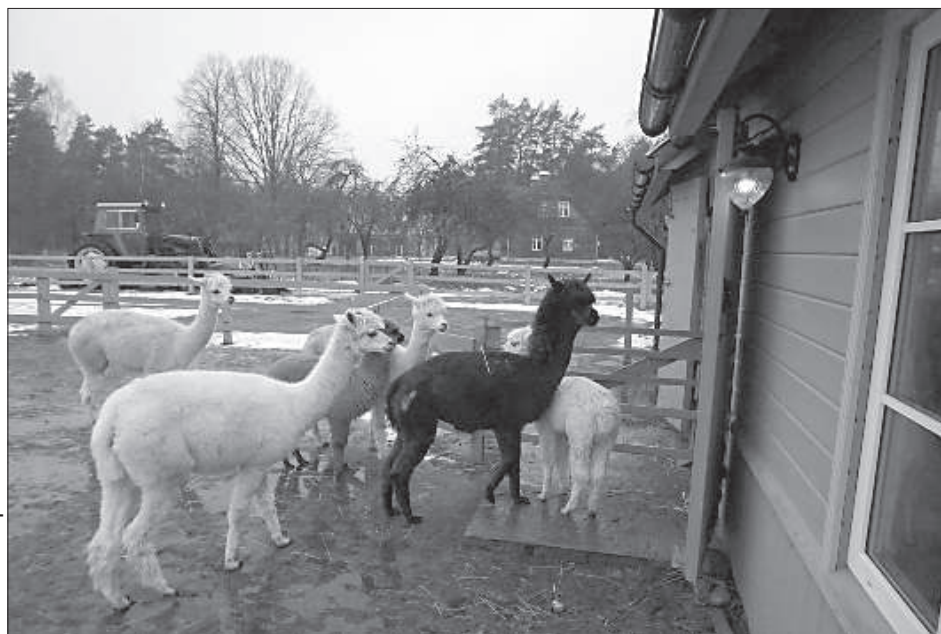
Дом альпака охраняют самцы Сапнис и Негро.