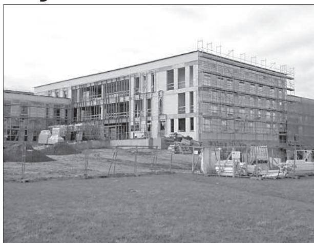
Строительство суда происходит между жилыми массивами на левом берегу Даугавы.

ции и Центра госязыка. Позже в комплексе может быть размещена Служба госдоходов, Агентство социального страхования, Агентство занятости и Служба поддержки села. Данный проект считается одним из самых крупных