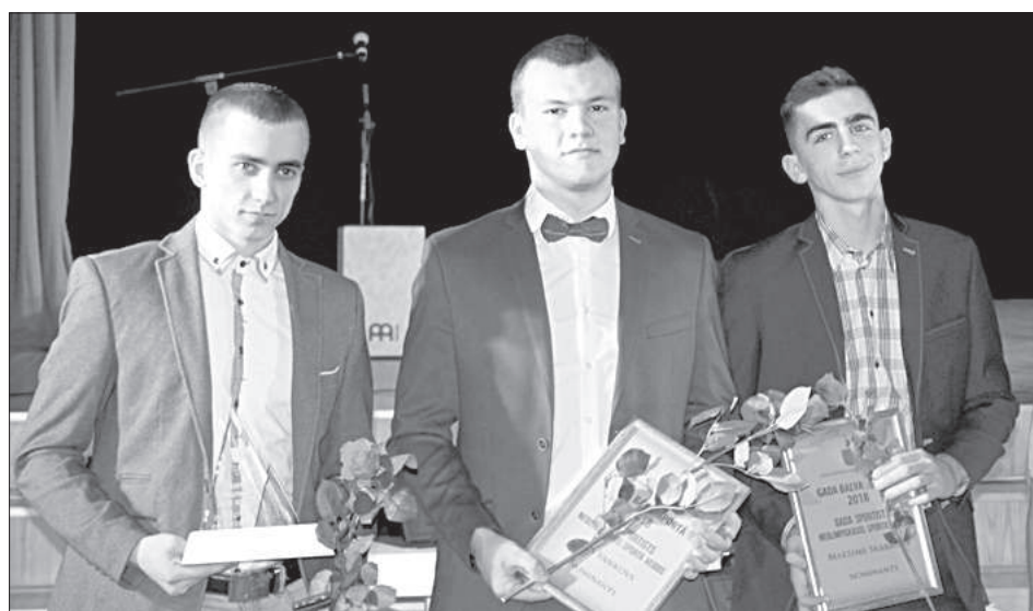
В неолимпийских видах спорта Даугавпилсский край представлен в спидвее и гиревом спорте.