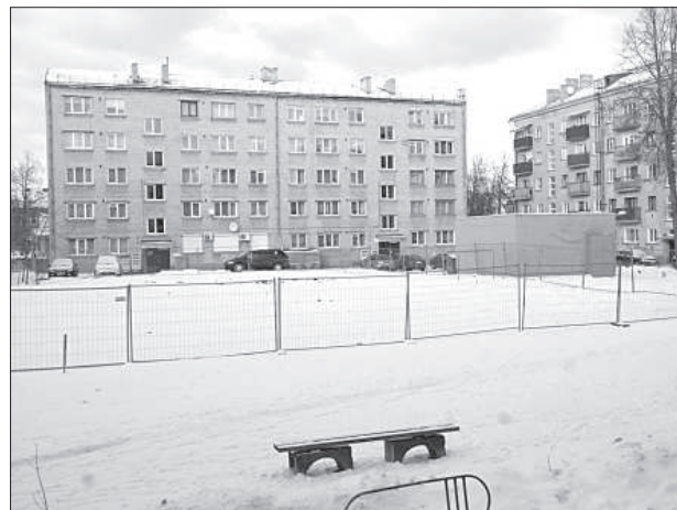
Вместо развалин будет детская площадка.

Самоуправление Даугавпилса продолжает заниматься деградировавшими постройками и зданиями в черте города.