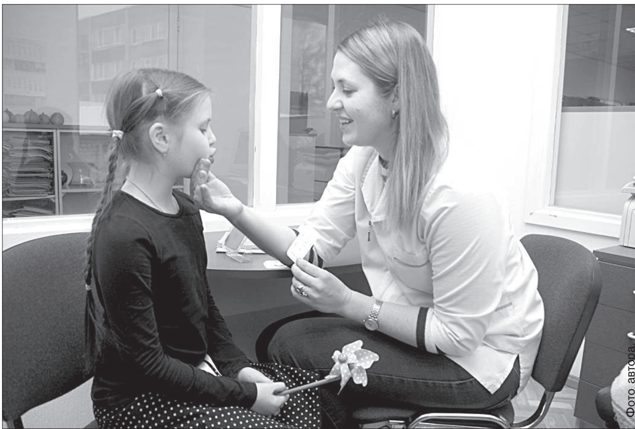
Аудиологoped работает с детьми.