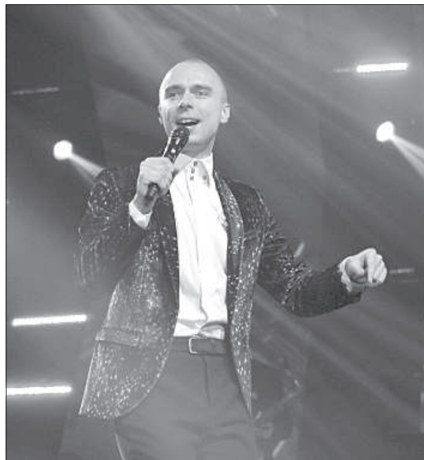
В зрительском голосовании в лидеры стабильно вышли две песни, но по общей сумме с оценкой жюри второе место заняла композиция «Salauzta sirds» Донса и Озолса.