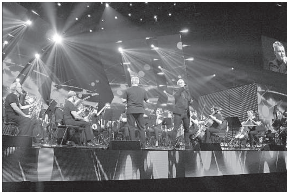
Шоу открывали даугавпилчане: рок-группа «Eira», камерный оркестр «Daugavpils Sinfonietta», смешанный хор «Daugava», профессиональный духовой оркестр «Daugava».