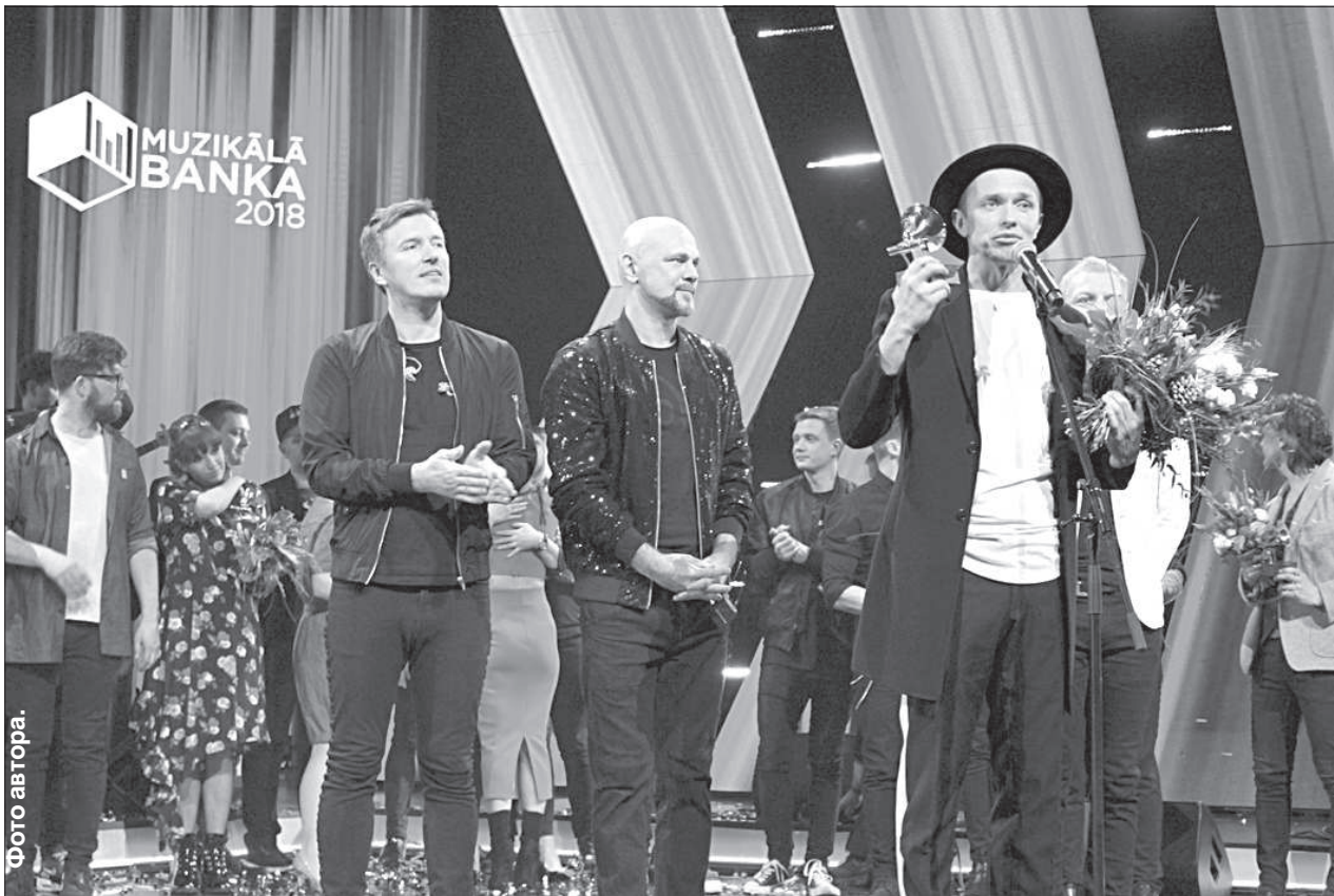
Титул самой ценной песни «Музыкального банка 2018» получила песня «Ogles» в исполнении «Prāta vētra».