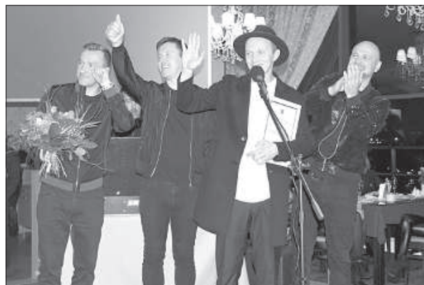
После финального шоу музыканты собрались на ночном банкете.

Решетина, очаровали даугавпилсские трамваи. «Если было бы время, покатались бы на катке на площади Виенибас. Классно, что у вас в городе такой есть», — отметил Иво. Только дорога в Даугавпилс его разочаровала, потому что не удалось найти место, где перекусить. Ехав по указаниям GPS-навигатора, музыкант поехал вдоль литовской границы, а вдоль этой дороги не нашел ни одного кафе или магазинчика.