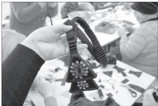
Каждая деталь лестовки несет сакральный глубокий смысл, ее треугольники, например, обозначают скрижали, полученные Моисеем на Синае.

В староверии всегда огромное значение занимали особые сакральные атрибуты, связанные с моментом сотворения молитв и богослужений. В Науенском краеведческом музее прошел первый специальный мастер-класс по созданию старообрядческих лестовок, подрушников и поясов, в котором приняли участие жители волостей Даугавпилсского края.