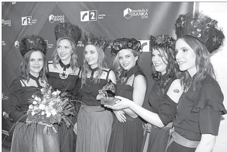
Третье место заняла песня «Sadziedami» — для коллектива «Tautumeitas» это был дебют в «Музыкальном банке».

В марте в концертном зале «Gors» соберутся латвийские звезды хип-хопа