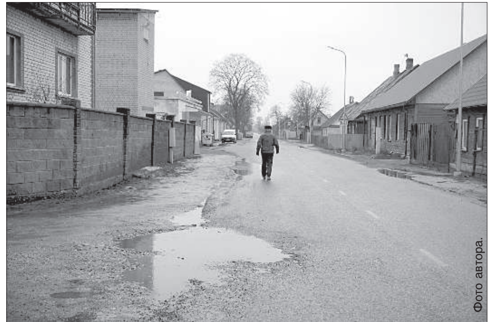
Пешеходы по ул. Лиела идут по проезжей части.

Улица Лиела при въезде на Юдовку и до самого ее конца представляет собой участок, не слишком пригодный для безопасного и комфортного дорожного движения для всех его участников. С обеих сторон проезжей части дороги, самой по себе довольно узкой, располагаются так называемые пешеходные зоны — тонкие полоски грязи и луж. До первой остановки на Юдовке, улицы Земниеку, по левой стороне дороги пешеходная дорожка, не очень презентабельная, но есть. Но после остановки тротуара больше нет. Летом, по словам местных жителей, когда более-менее сухо, по этим «тротуарам» еще можно передвигаться, но