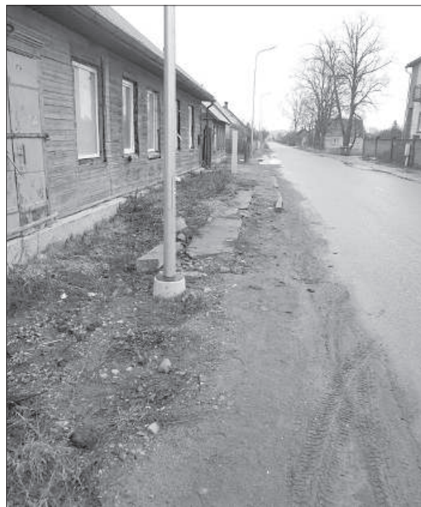
Тротуар планируется построить только тогда, когда будут проложены системы водоснабжения и канализации.

На 1 января 2019 года долг жителей фирме «Ornaments» составлял 306 000 евро, на 1 января 2018 года это были 277 000 евро.