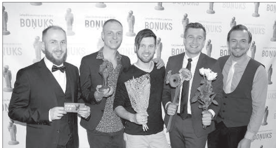
Группа «Bez PVN».