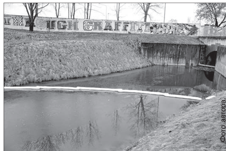
На реке Шунце установлены абсорбирующие боны.