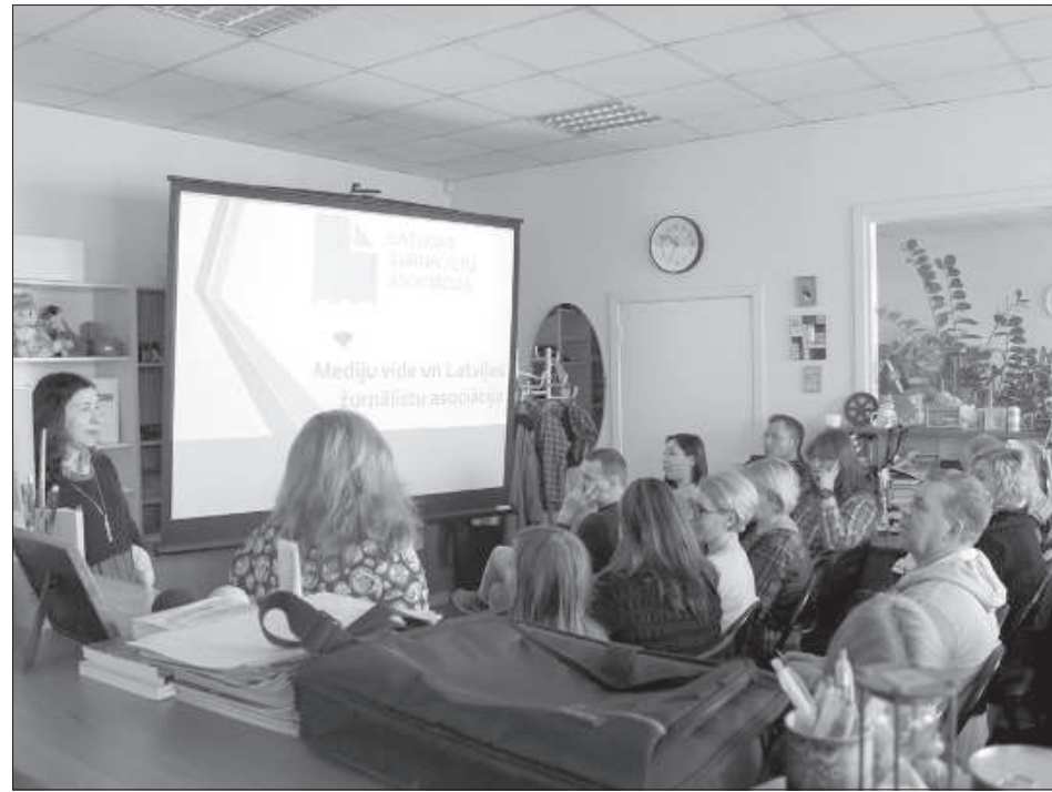
Семинар в редакции «Латгалес Лайкс».

22 февраля более 20 представителей СМИ Латгальского региона собрались в редакции «Латгалес Лайкс» на семинар, организованный Латвийской ассоциацией журналистов и посольством США в Латвии «Практические советы и опыт в работе редакции региональных СМИ». Во время обсуждения выявились следующие ключевые моменты: информационные издания самоуправлений портят рынок СМИ, политизирование изданий в интересах их владельцев, неспособность привлечь новую аудиторию и вызов конкурировать с ложными новостями в соцсетях.