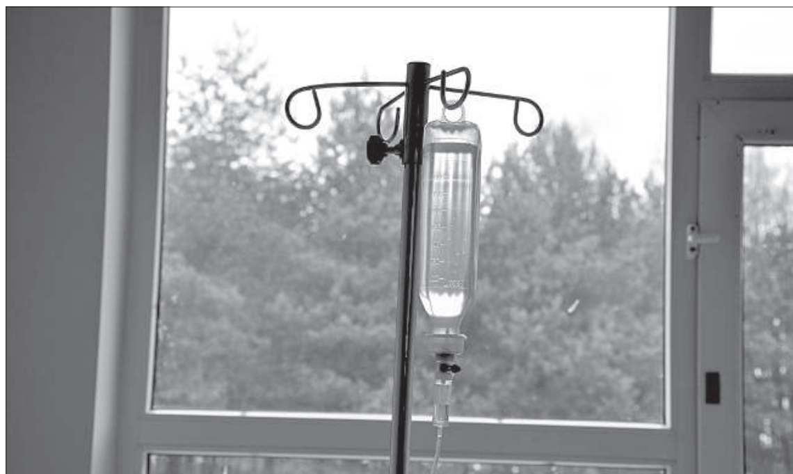
Интоксикацию из организма выводят с помощью физраствора.