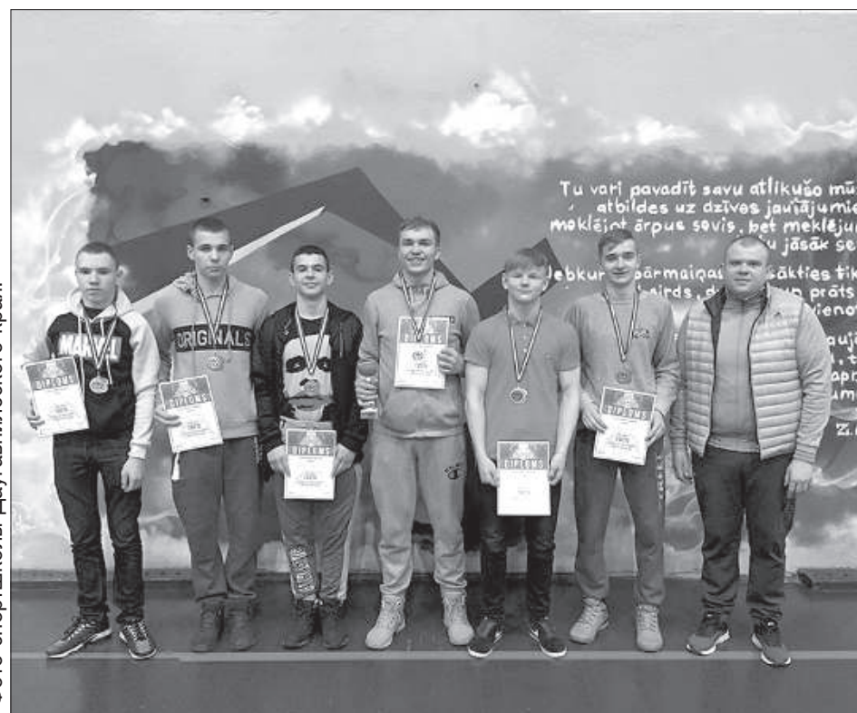
Фото спортшколы Даугавпилсского края.

В результате Даугавпилсский край обосновал-