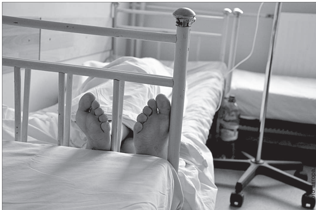
В палате отдыхает очередной клиент.