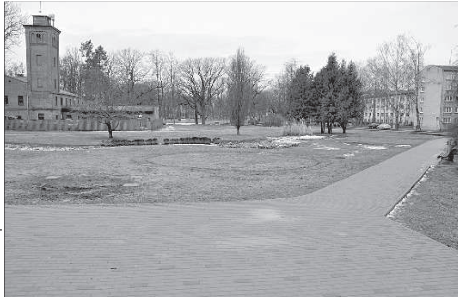
На этом месте планировалось установить памятник в честь столетия Латвии.