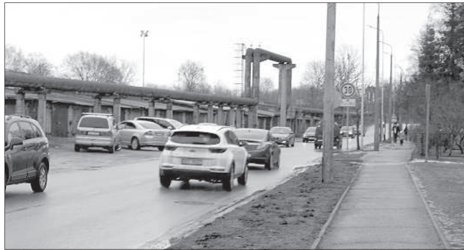
Родители с детьми лавируют между машин.

На некоторые участки улицы Стацияс жители Даугавпилса жалуются постоянно. Особенно много возмущений вызывает участок от железнодорожного вокзала до улицы Райня, где движение очень интенсивное, а условия для пешеходов и автоводителей опасны. Последний вопрос от жителей города, относящийся к этой улице, касался проблемы пешеходного перехода возле детского сада №1.