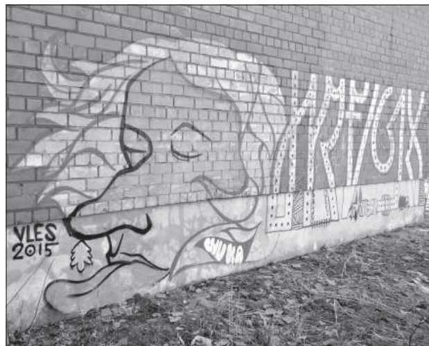
Заброшенные здания украшает граффити.

Вскоре после распада Советского Союза развалился и Даугавпилсский Всеобщий строительный трест. Профилакторий приобрели себе в собственность частные лица. Как и каждому учреждению, профилакторию для нормального функционирования нужно было достаточное финансирование и нагрузка, чего новым владельцам, оче-