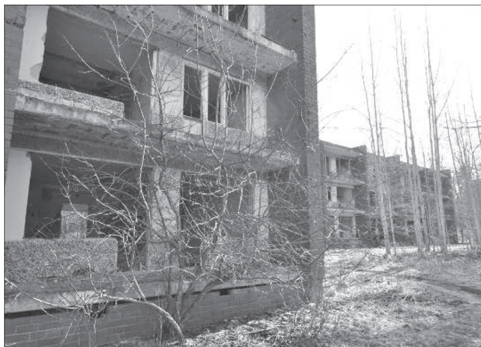
Так сейчас выглядят окрестности профилактория.