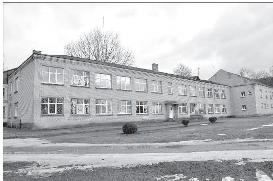
Аулейская основная школа закрыта в 2017 году.

тельно сокращается количество учеников в Робениекской основной школе, хотя у нее есть своя ниша — это ЭКО школа с интернатом, там дети могут жить рабочую неделю, также там есть специальные образовательные программы. Школа может существовать, если в классе минимум 14 детей», — пояснила Л. Миглане.