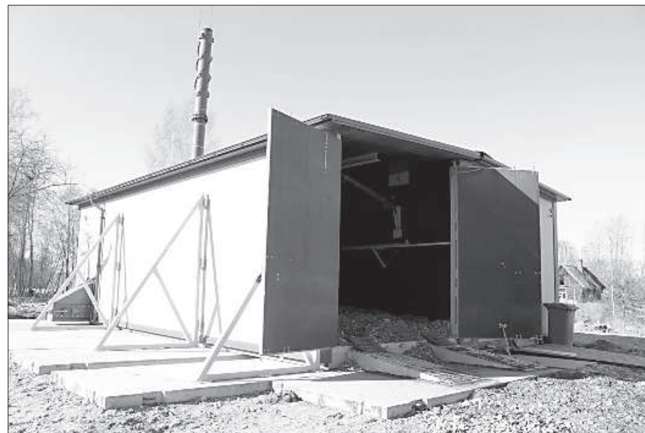
В новой котельной крыша имеет гидравлический подъемник.

Шпогская котельная обеспечивает отоплением только 4 здания – Шпогскую среднюю школу, Шпогскую музыкальную и художественную школу, Вишское волостное управление и один многоквартирный жилой дом. Раньше к центральной системе отопления были подключены и другие здания, К. Путниньш говорит, что жителям постарше становится все труднее самим заготовить дрова, чтобы отапливать свою квартиру самостоятельно. ■