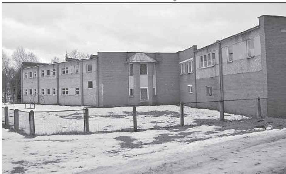
Саулескалнская начальная школа в Комбульской волости ликвидирована в 2017 году.

«В Индре есть общеобразовательная и художественная школа, куда приезжают дети из соседних волостей. На год отложен вопрос о закрытии Извалтской основной школы. Очень стреми-