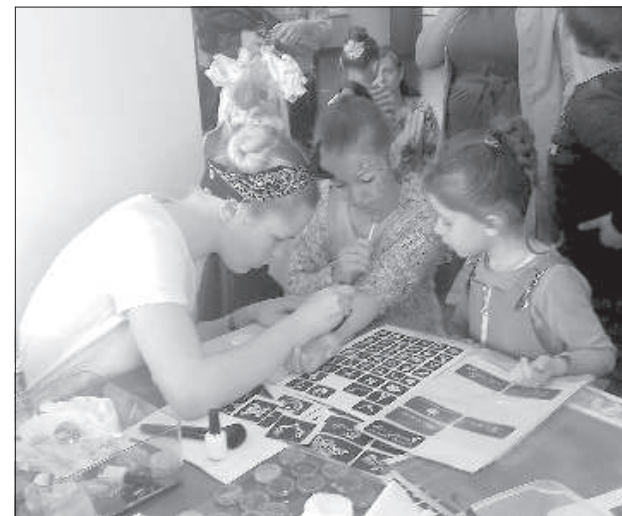
Дети выстраивались в очередь на аквагим.

Для участников выступили коллективы Даугавпилса и края. Дети вместе играли, участвовали в конкурсах, танцевали. Всего на мероприятие съеха-