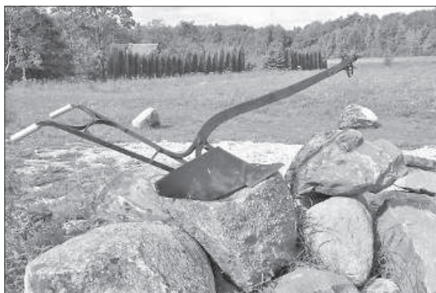
Сделанный Эдгаром объект среды.