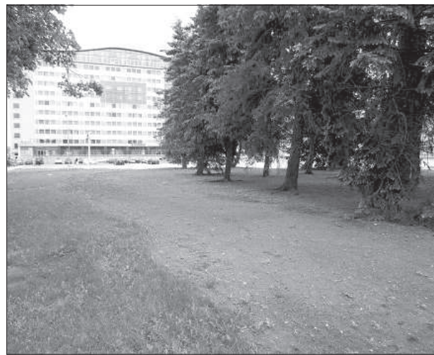
То, что осталось после «ледовой трассы».