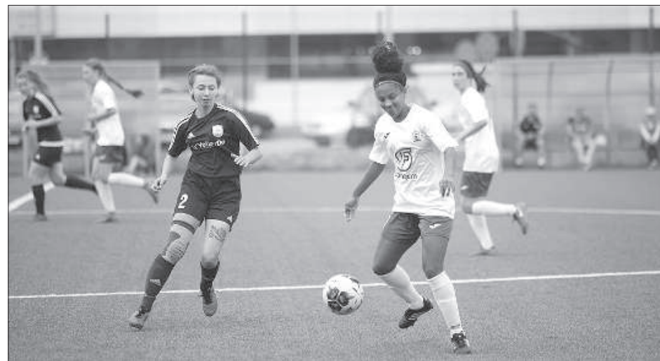
Чемпионат Латвии – 2019. Высшая лига