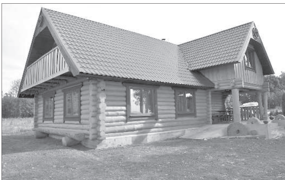
Дом отдыха «Saullēkti ozolos» – это семейное предприятие.