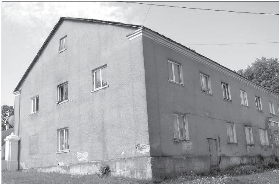
Дому более 100 лет.