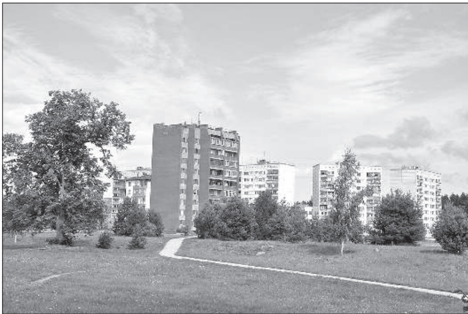
Построенный для строителей ГЭС «Поселок энергетиков».

мя от времени всплывают, в основном перед выборами. Эксперты даже предложили уменьшить высоту дамбы до 10 метров и