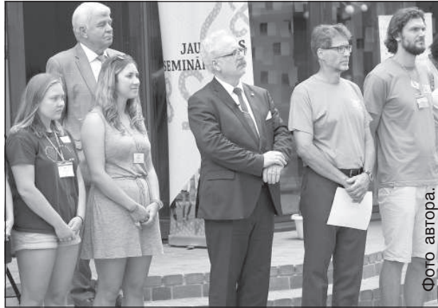
На открытии лагеря латышской молодежи 2x2 в Вишках.

«То, что есть приграничные территории, где информационное пространство Латвии не покрывается даже сейчас, 30 лет спустя после восстановления независимости, неприемлемо», — сказал «Латгалес Лайкс» Э. Левитс. Новые ретрансляционные вышки должны эту проблему решить. Для одной вышки, которая будет располагаться недалеко от Виляки (в поселке Айзпурвес) в эту пятницу, 2 августа, планируется залить фундамент. В Индрском доме культуры, где о планах более подробно рассказывали представители ЛГЦРТ, президент подписал послание для капсулы времени, которую планируется замуровать в фундамент вышки. Такое же послание, но подписанное другими должностными лицами, будет вмуровано в ос-