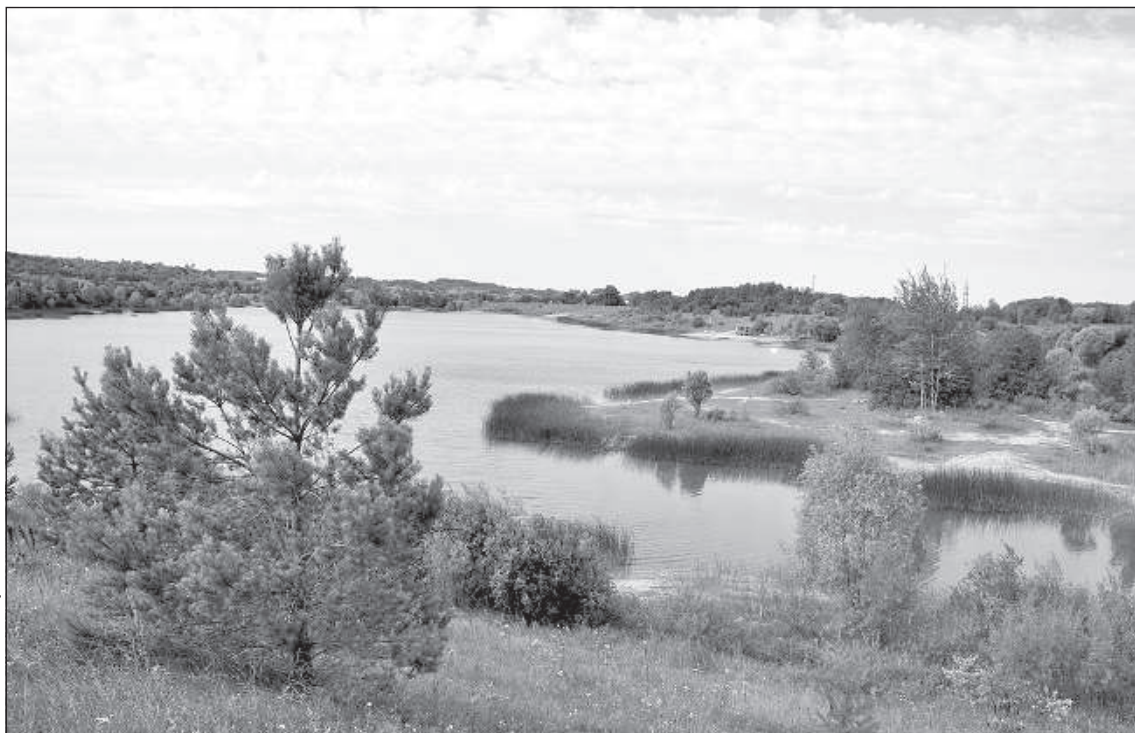
На месте строительной ямы для дамбы образовался Ругельский котлован.