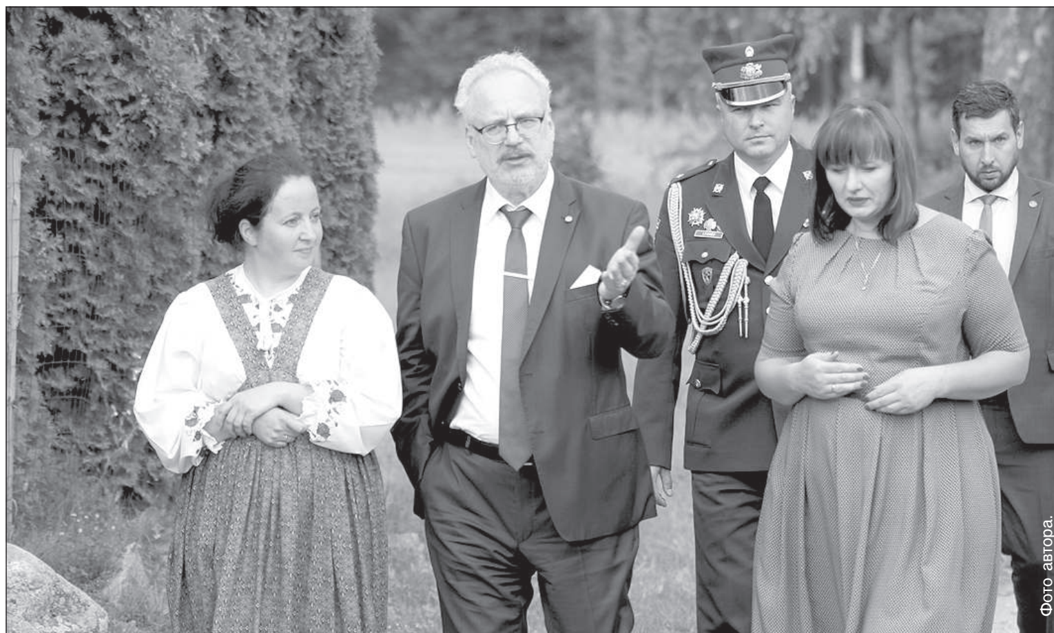
В Слутишках президент познакомился с наследием староверов.