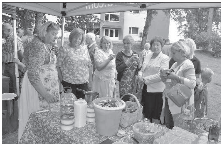
Зелтите Кавиере рассказывает рецепты мази и настоя из ноготков.