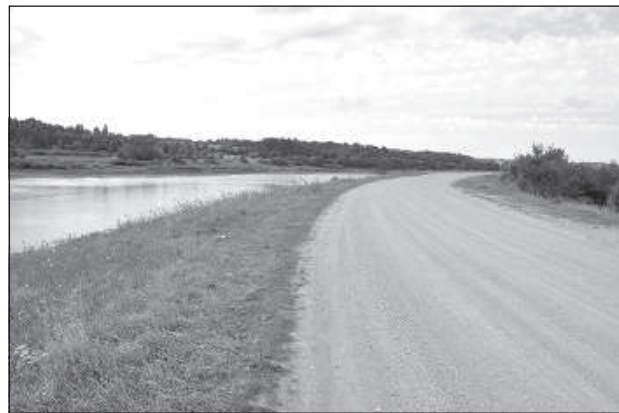
По верху насыпи, отделяющей водохранилище от Даугавы, пролегает дорога.

Чтобы ликвидировать причиненные природе разрушения, сохранить природные и культурно-исторические ценности и