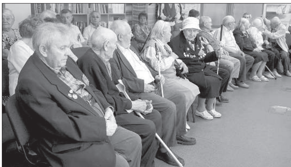
Освободители Белоруссии, проживающие в Даугавпилсе.