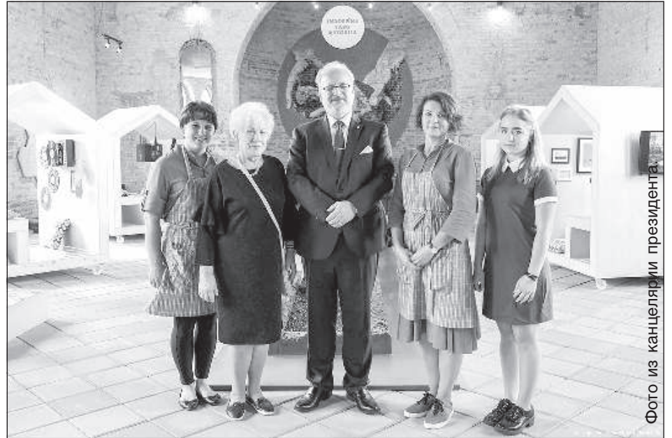
Президент в Музее счастья в Индре.

ЛГЦРТ предоставляет услуги электронной связи в Латвии, и отвечает за обеспечение доступности вещания телевидения и радио на государственной территории. По наблюдениям в конце 2018 года, на данный момент сигналы ловятся на 99,6% территории Латвии, а в домашних хозяйствах, которые находятся на этих 0,4% территории, доступность национальных электронных средств массовой информации ограничена. Дис-