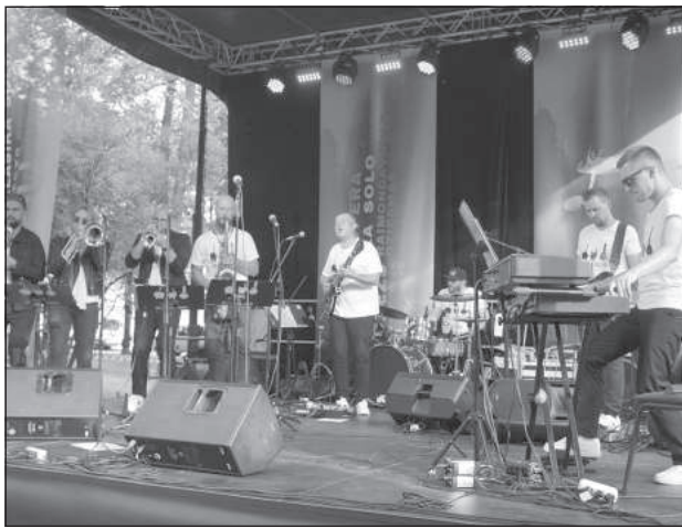
Группа «Very Cool People».

По традиции каждый четверг последнего летнего месяца на одной из музыкальных площадок города проходит какой-нибудь концерт. Данное мероприятие всегда поражало разнообразием жанров и направлений, а также количеством музыкантов и исполнителей, приглашенных организаторами — Центром латышской культуры (ЦЛК). В этом году август начался с таких музыкальных жанров, как инструментальный джаз-фанк и фьюжн, в которых работает группа молодых и талантливых рижан «Very Cool People».