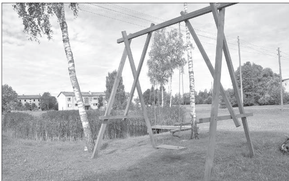
На качелях дети катаются редко, потому что в Кепове их совсем мало.