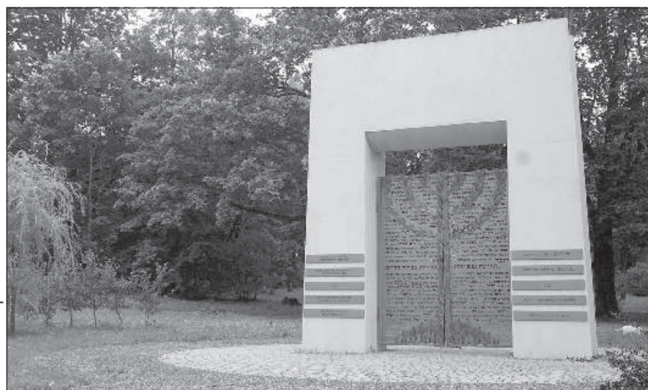
С 2015 года о жертвах холокоста в Прейли напоминает особое памятное место — белая арка, располагающаяся у входа на еврейское кладбище и образующая единый комплекс с Прейльским мемориалом жертв холокоста, открытым в 2004 году.

«Всего в более и менее масштабных акциях уничтожения евреев (27 июля, 9-10 августа) 1941 года убито более 900 человек, проживавших в Прейли и окрестностях. Однако, точное количество убитых, как и места расположения ям их захоронения, до конца не известны — летом 1944 года, когда немцы отступали, ямы раскапывались, трупы сжигались, отдельные ямы были забыты и те-