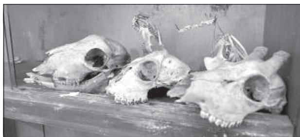
В кабинете биологии.