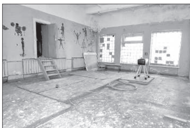
Здесь занимались гимнастикой.

Сейчас помещения Межциемского училища пребывают в весьма удручающем состоянии, и интереса к ним никто не проявляет. На восстановление здания потребуется внушительное финансирование. ■