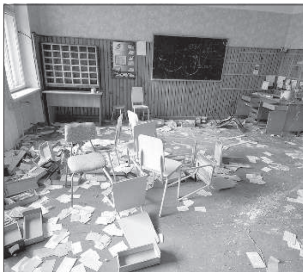
Когда-то здесь кипела школьная жизнь.