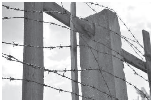
Колочая проволока напоминает о том, что здесь была колония.