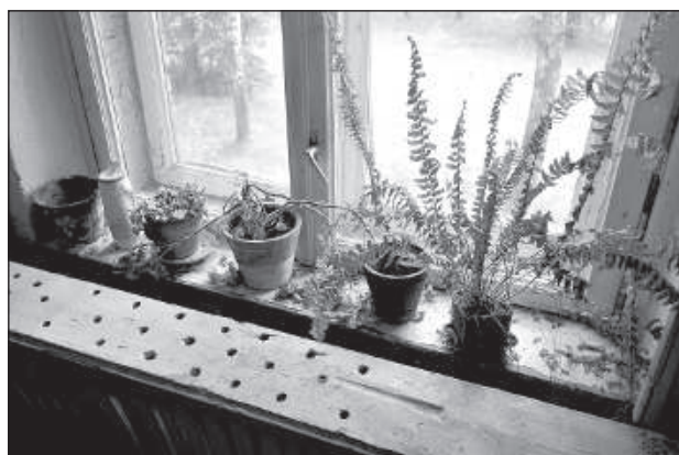
Цветы «украшают» подоконники.