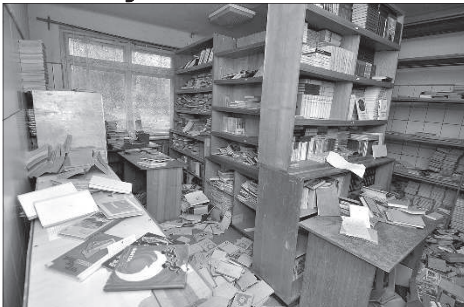
В школьной библиотеке разбросаны книги.

Сначала в школе училось около 300 человек, но затем коррекционные программы стали осуществлять другие учебные учреждения, и количество учащихся в Межциемском училище начало уменьшаться. Вместе с сокращением количества учеников сократился объем предоставляемого школе финансирования, в результате чего стали накапливаться долги. Наиболее проблематично в режиме строгой экономии было обеспечить отопление на 7700 квадратных метрах учебных помещений. В пос-