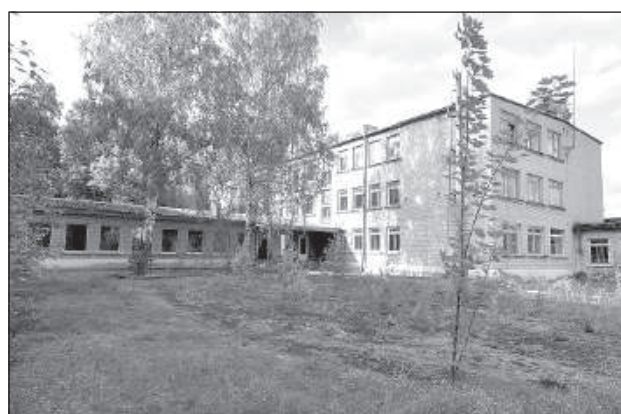
Во дворе школы.