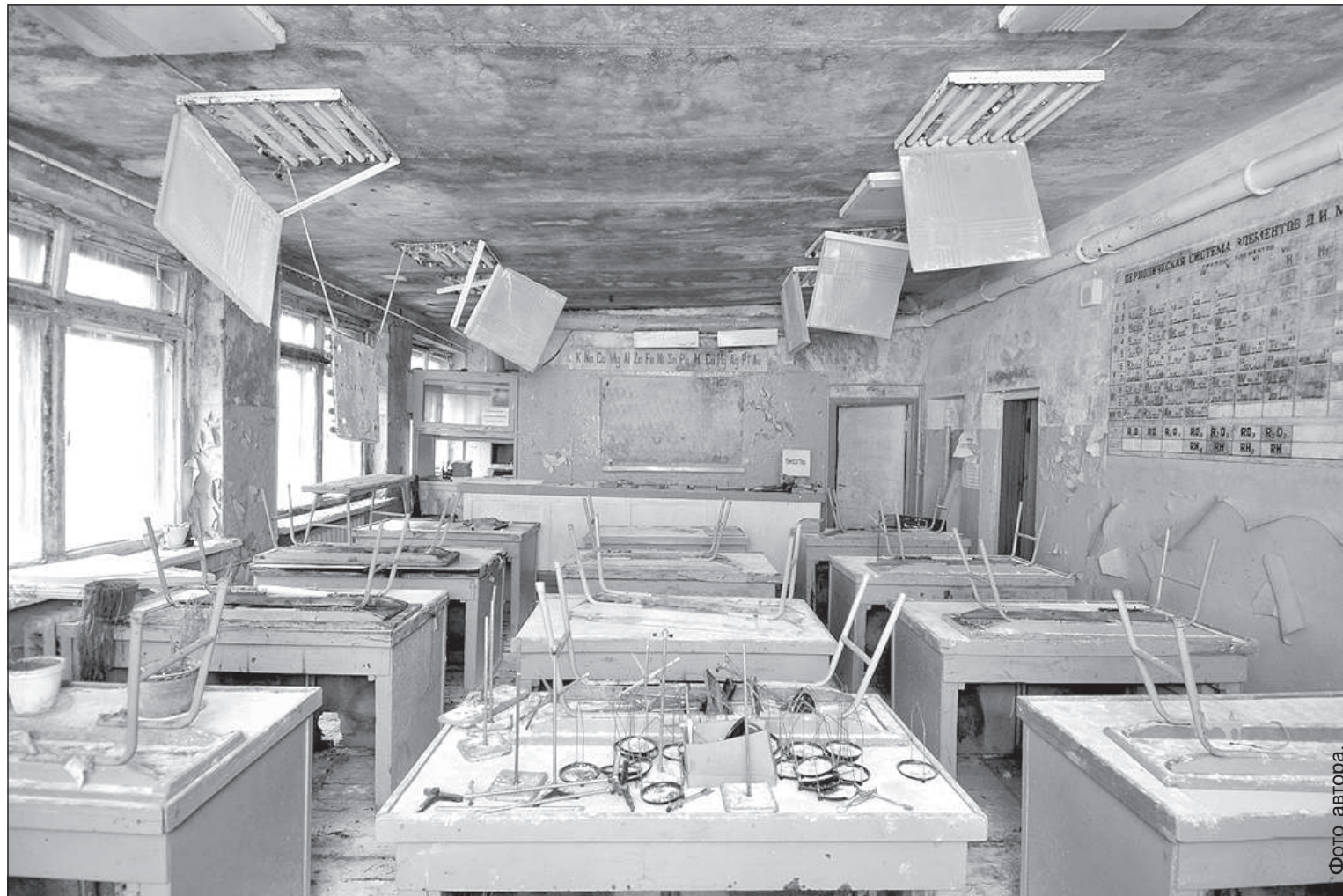
Так сейчас выглядит кабинет химии.