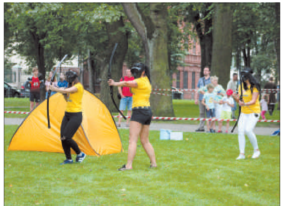
Команда «Klondaika», состоящая только из представительниц прекрасного пола, достойно сражалась и заняла почетное 3-е место.