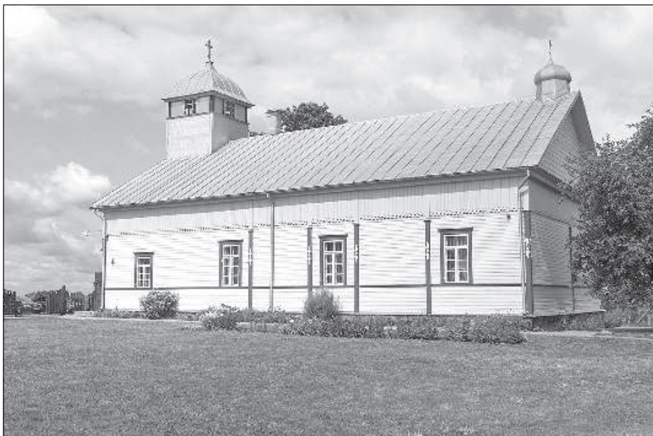
Храм был построен 142 года назад.

В начале августа Москвинская община отметила 290 лет с начала своего образования. В деревне со звучным названием Москвино в Прейльском крае собрались прихожане общины, представители местного самоуправления и староверы со всей Латвии и даже из-за рубежа.