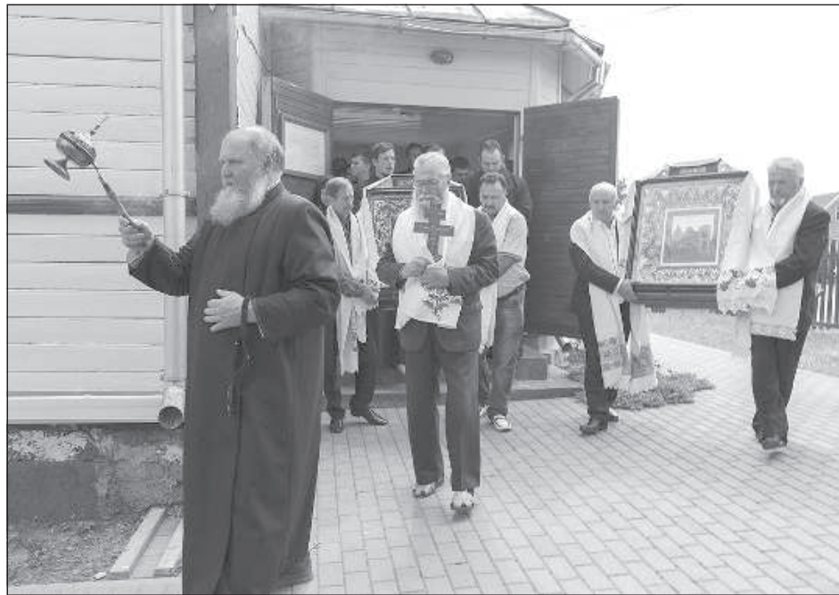
Крестный ход в честь юбилейного торжества.