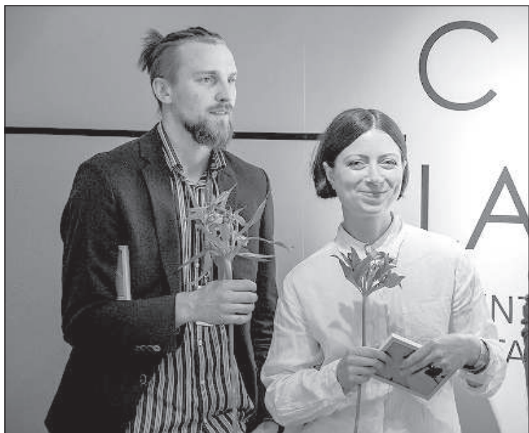
Симпозиум в Центре искусств Марка Ротко летом 2019 года.