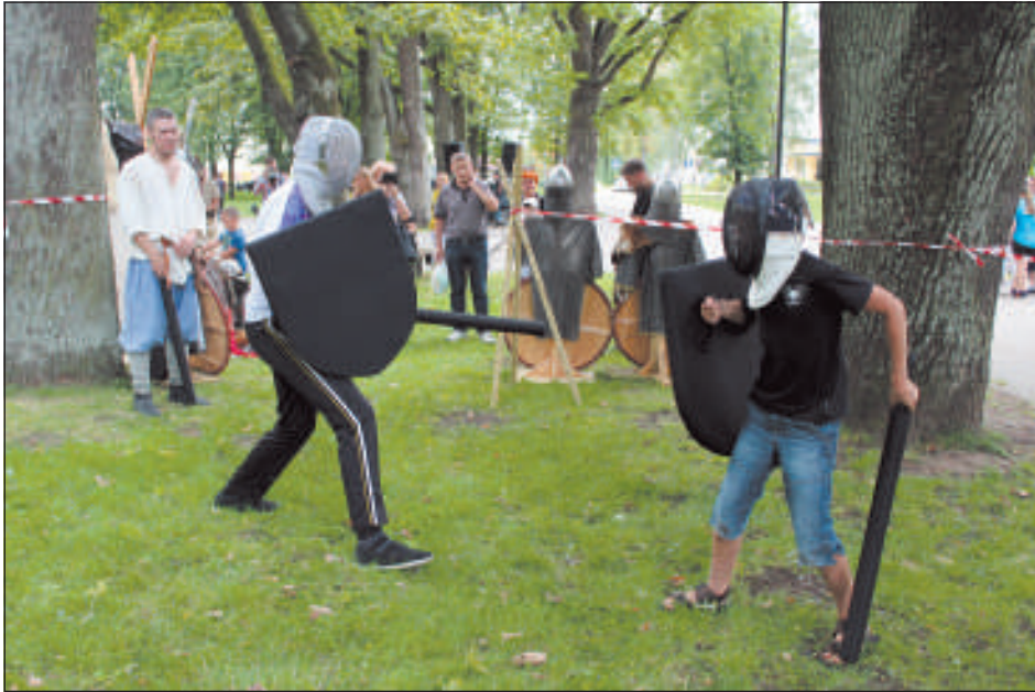
Любой желающий мог примерить на себя роль рыцаря, пускай и с безопасными «мягкими» щитом и мечом.

В Международный день молодежи, 12 августа, в городе состоялись «Бои лучников».