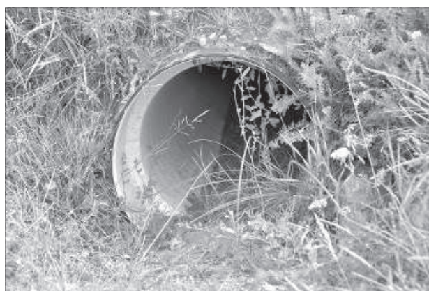
Жители сами стараются укрепить трубу камнями и очистить ее от песка.

жет, если бы сровняли ямы и впадины, и положили еще один слой асфальта, то дорога была бы хорошей».