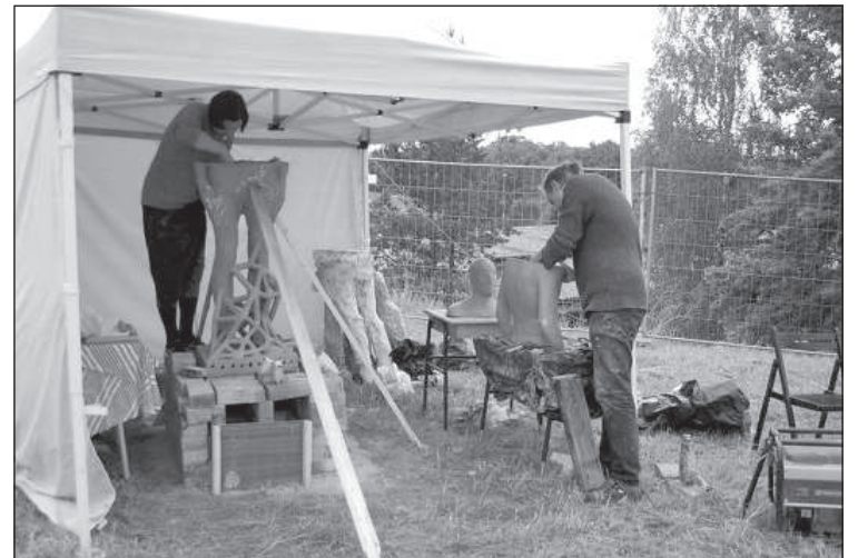
Совместное изготовление огненных скульптур.