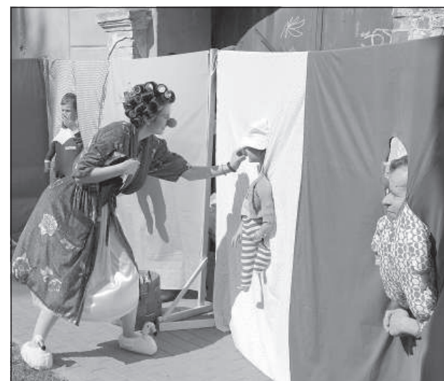
На улицах Крепости было много интерактивных развлечений, в которых могли принять участие все желающие.