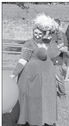
Внимание зрителей привлекала яркая актриса из московской клоун-группы «Оп-Па».

В свою очередь, женское клоун-трио «Клавы», называет свое занятие только профессией. И не только потому что они «учились на клоунов» в известном театре «Лицедеи» и играли в нем некоторое время, но еще и потому, что у них большой опыт клоунады, работа с разными залами и аудиториями. «Нас можно назвать великими импровизаторами, потому что