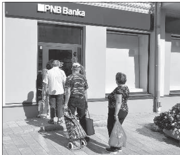
Даугавпилсский филиал банка «PNB».

Банк «PNB» не согласен с таким решением, считает, что действовал в соответствии с регулирующими