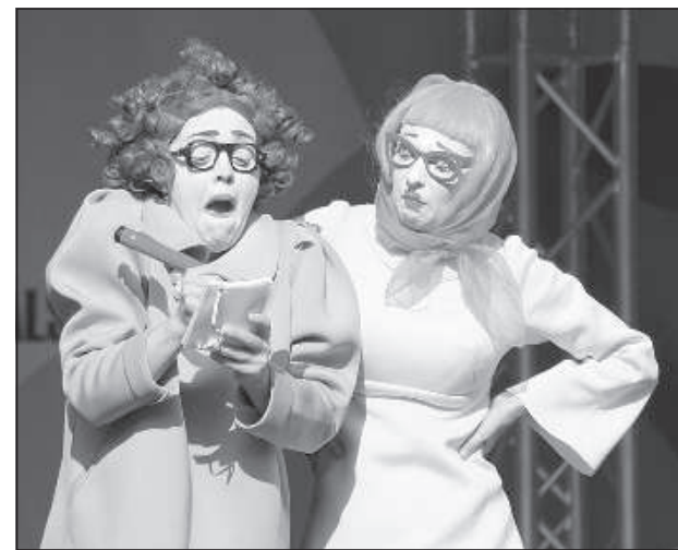
Женское трио из Санкт-Петербурга «Клавы» показали свой номер «Клавы в любви».