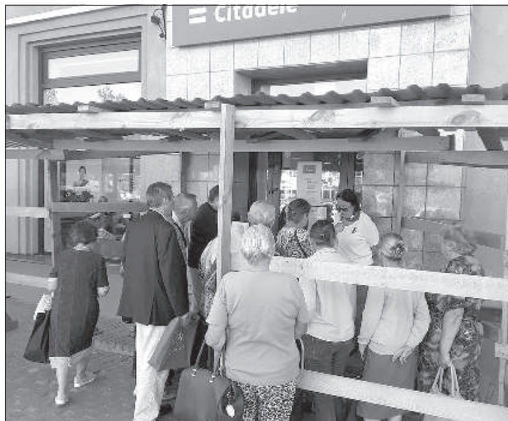
Люди собрались около филиала банка «Citadele».