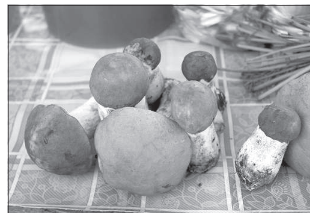
Такая горка из пяти-шести подосиновиков на рынке продается за 2 евро.

Количество грибов определяет и их достаточно высокую цену. Ведерко грибов объемом в 1 литр,