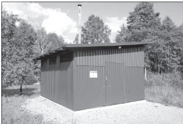
Перед постройкой здания нужно было обустроить площадку и построить подъездную дорогу.

Стоимость кремации зависит от веса животного. Домашним любимцем может быть не только кот или собака, но также хомячок или хорек. Крематорий выдает сертификат о смерти,