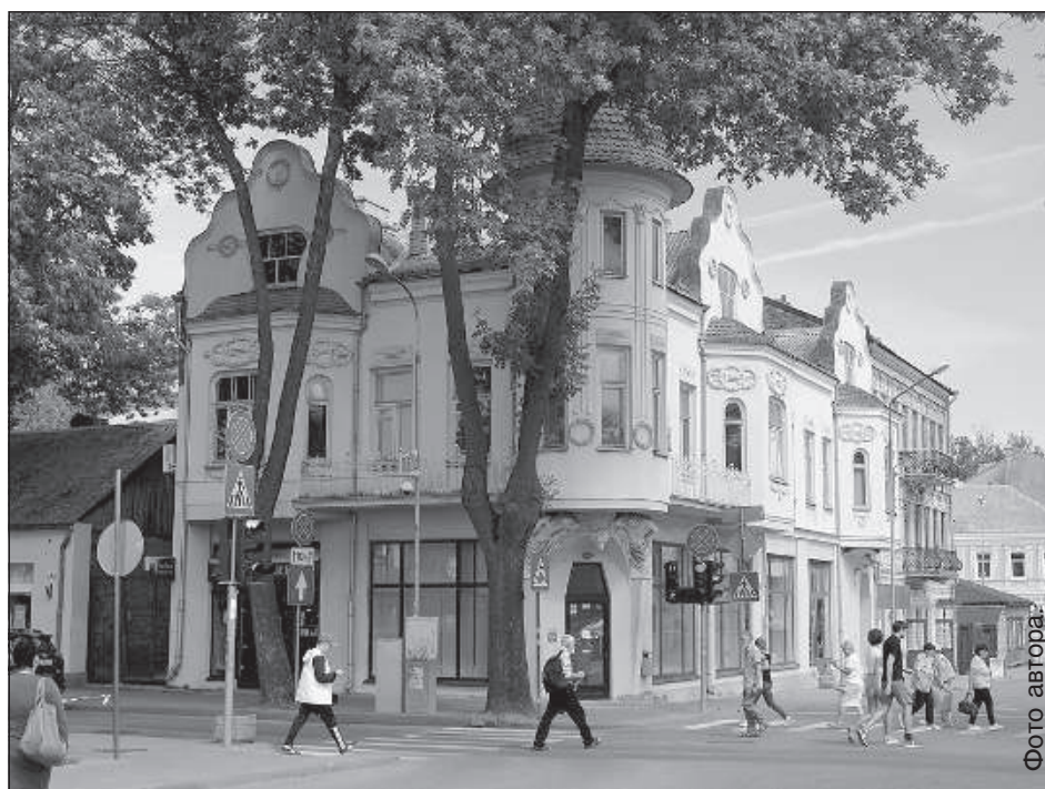
Богато украшенное лепниной здание на ул. Саулес, 55 всегда использовалось для коммерческих целей — многие помнят магазин игрушек «Буратино», находившийся здесь в советское время.

Еще под контролем градостроительного департамента может быть вид коммерческого использования здания или отдельного помещения в нем. Об этом собственник обязан сообщить в департамент планирования и градостроительства. Пока что юридическое лицо, владеющее зданием на Саулес, 55, ни о чем таком не сообщало. ■