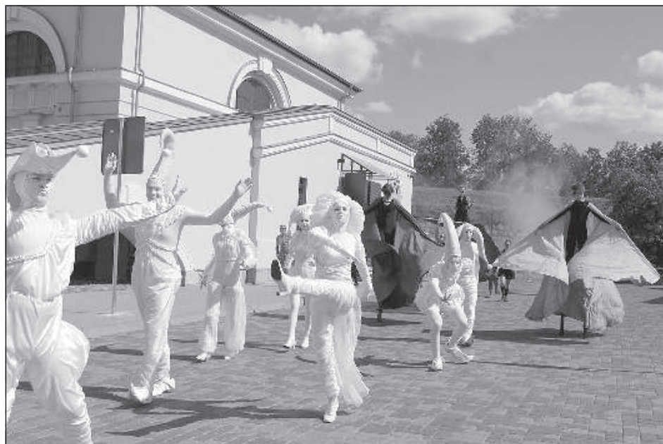
Открыл фестиваль парад клоунов.

Участие в фестивале приняли как профессиональные клоуны и артисты, так и любители из шести стран — Латвии, России, Белоруссии, Бельгии, Эстонии и Литвы. Латвийский дуэт клоунов, называющий себя «Полная импровизация», говорит, что клоунада для них — это увлечение, которому они посвящают все свободное время. «Мы этим не зарабатываем, в обычной жизни работаем бухгалтерами, а «клоунская жизнь» — это только хобби, а точнее сказать, порыв души», — говорят Ана-