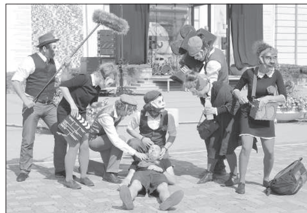
«Киношная» группа «Странствующих кукол господина Пэжо» активно вовлекала в клоунское шоу всех зрителей.