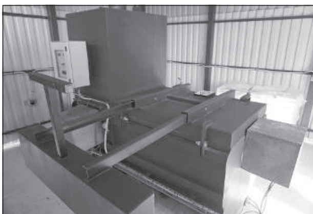
Главное оборудование для кремации — печь, заказана за границей.