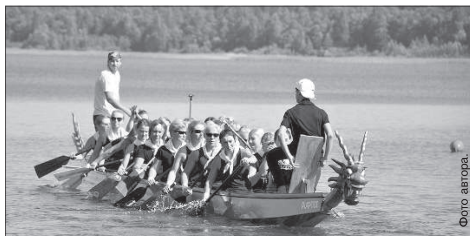
Гребут девушки «Visaginas Super», мужчины рулят и «отбивают ритм».

В женской группе в нелегкой борьбе победила команда «Visaginas Super» (Литва). На втором месте команда «Dinaburg», а на третьем – «Visaginas Extra». Среди мужчин непревзойденными остались гребцы «Atom Visaginas» из Литвы. 2-е место завоевала команда «Dinaburg», а 3-е – «Melnā Haizivs». В группе «Mih», где в командах были и женщины, и мужчины, лавры победителя пожинала команда