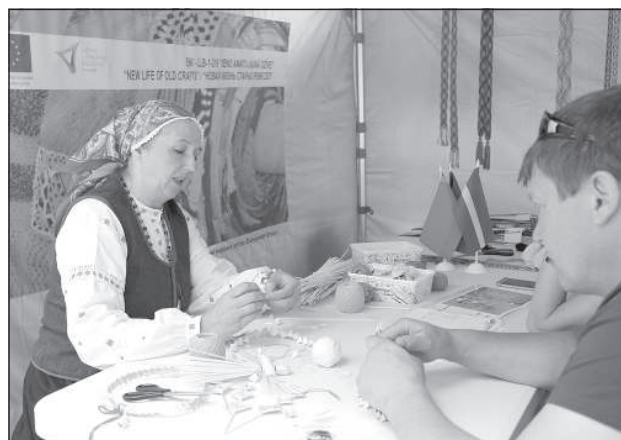
В «городке ремесленников».