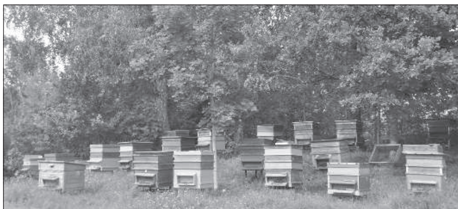
На пасеке живут более 50 пчелиных семей.