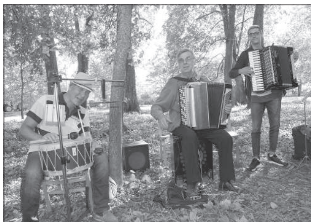
«Красивые музыканты» из Медумской волости.