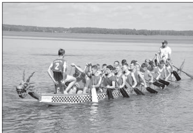
Заезд окончен, команда возвращается к берегу.

Всего в соревнованиях участвовали 3 женских, 7 мужских и 11 смешанных («mix») команд – более 400 участников, среди которых были профессиональные спортсмены, любители и приверженцы активного образа жизни. Участников соревнований поддерживали несколько сотен болельщиков.