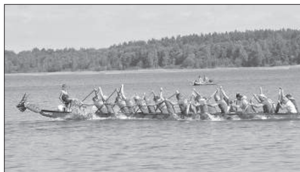
Лодка победителей-мужчин из команды «Atom Visaginas».

1-й Международный фестиваль лодок-«драконов» «Dragon Boats» организовал Латгальский центр водных видов спорта «Dinaburg».