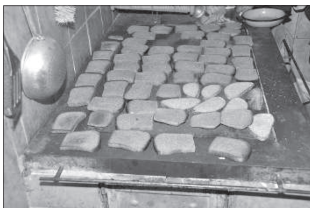
Высушенный на печи хлеб – лакомство как для овец, так и для коров.