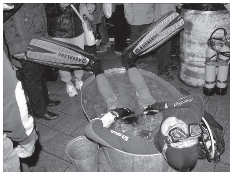
С аквалангом в тазик!