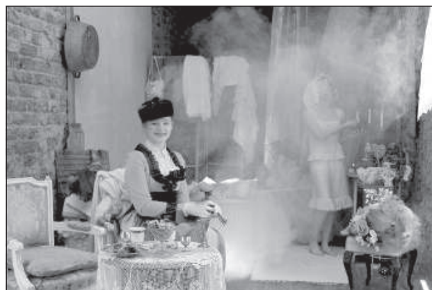
Водные процедуры в старинном стиле от «Сундука воспоминаний».

Вода и все, что с ней связано, предстало во всем своем великолепии — аквариумы, фонтаны, рыбы, живые и нарисованные, кораблики, водные лилии, даже аквалангисты занимались погружениями прямо посреди главной улицы города. А даугавпилские клоуны в честь праздника переоделись в пиратов. На воде танцевали, под звуки воды умудрялись петь — стихия господствовала во всех видах искусства.