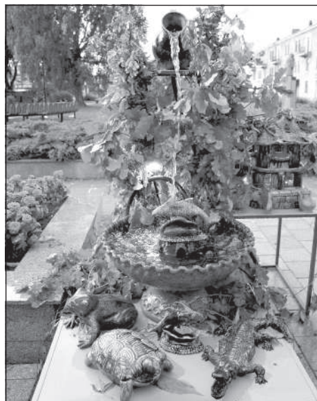
Тему воды раскрыл Центр гончарного искусства.

Традиционно на празднике проходит парад ретро-машин. В этом году в ряду этих машин можно было увидеть транспорт, непосредственно связанный с этой водой. Специальную технику показал юбиляр этого года — предприятие «Daugavpils ūdens». Считается, что ровно 130 лет назад несколько зданий в Двинске получили воду из городского