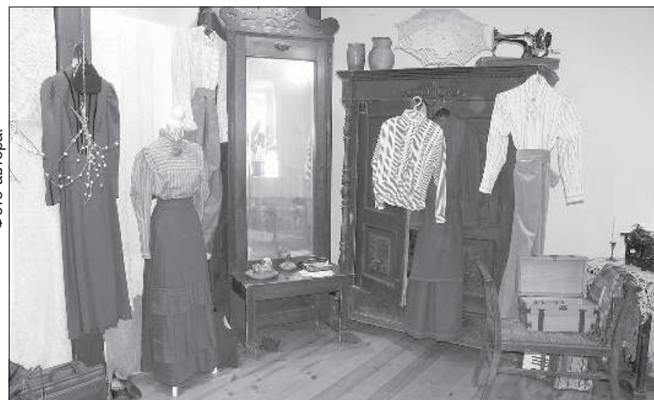
Комнату Лизе планируется использовать как музейную экспозицию и как новое экскурсионное предложение для «Латвийской школьной сумки».

Игру и экскурсию по музею сотрудницы учреждения для ранденских школьников провели в старинных нарядах. Похожие костюмы были у участников детско-юношеской театральной студии «Berķeneles Kamoliņis» на празднике