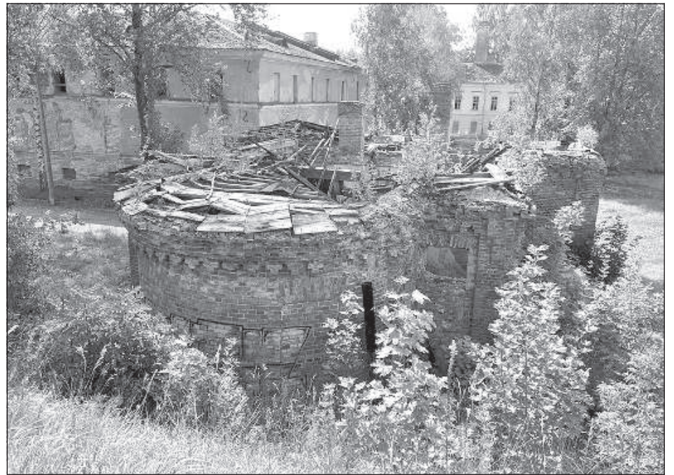
Бывшая капелла на ул. Александра, 5а.

Оба упомянутых здания являются частью исторического комплекса крепости и, по мнению членов совета, находятся в достаточно хорошем состоянии и в будущем могут быть