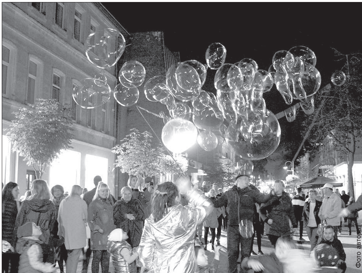
Вокруг аттракциона с мыльными пузырями собрались дети и взрослые.