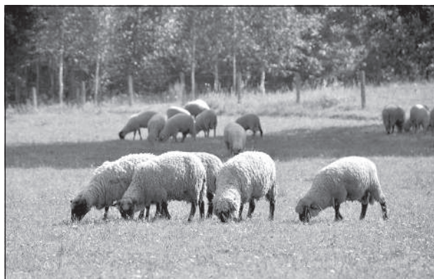
Стадо началось с латвийских темноголовых, но спустя несколько лет стали доминировать гибриды.