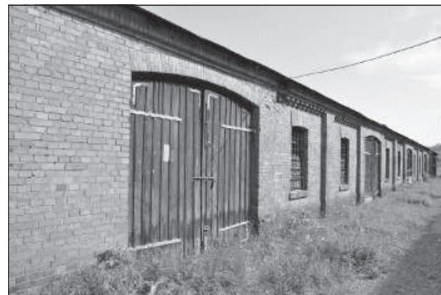
Здание на ул. Александра, 11.

восстановлены. Зданию на ул. Александра, 11 может найтись применение в проекте Моторного музея, который начнется уже в этом году.