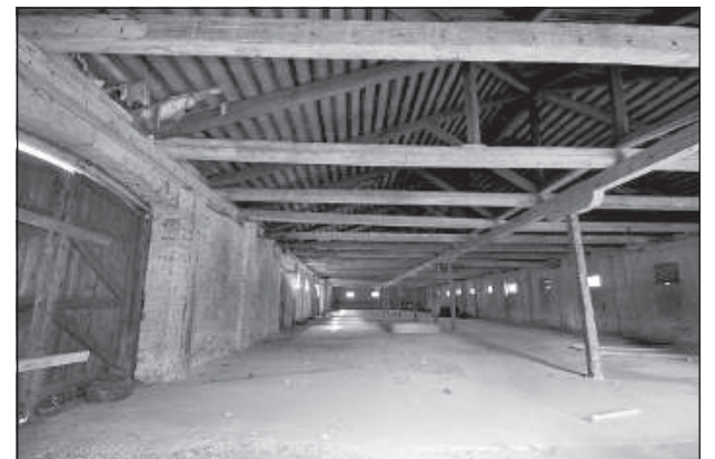
Просторные помещения в здании на ул. Александра, 11.

ГАО «Valsts nekustamie ģirāsumi» принадлежит много зданий в Даугавпилсской крепости, в том числе оба упомянутых, а также находящееся в аварийном состоянии здание из силикатного кирпича на ул. Геккеля, 3, снос которого Совет по сохранению и развитию Даугавпилсской крепости поддерживает. Эта постройка располагается недалеко