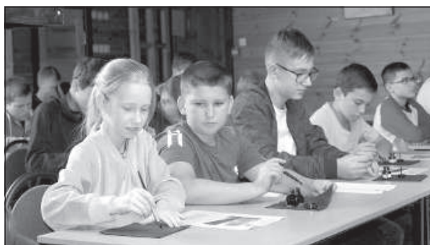
Пером и чернилами, как Райнис в свое время, школьники перед игрой писали письма друг другу.

В игре используется оригинальный текст писем, а в завершении каждого письма в паре предложений «Post Scriptum» дан указатель, как решить загадку, чтобы получить следующее указание. Чтобы выполнить задание, нужно внимательно прочесть все письмо. Нужно обращать пристальное внимание, как на текст, так и на детали в убранстве комнаты. «Чего мы хотим добиться этой мастерской? Развивать умение читать, знание