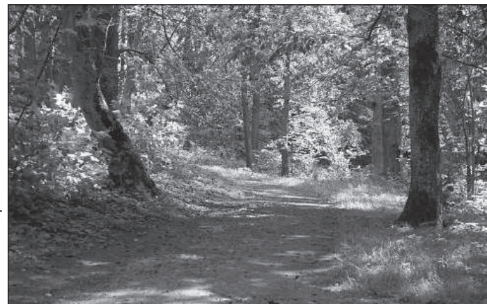
После информационной части участники собрались в Юнсвентском парке, чтобы дополнить его новыми насаждениями – декоративным кустарником.

тор исследовала, что помещики при необходимости велели слугам вынести фонарь или воткнуть в землю факелы. Неоднозначно оценивается выкладка парковых дорожек брусчаткой, поскольку во времена поместий хватало посыпать тропинку гравием. А вот пышными клумбами поместья украшали с заднего двора, а не с парадного входа.