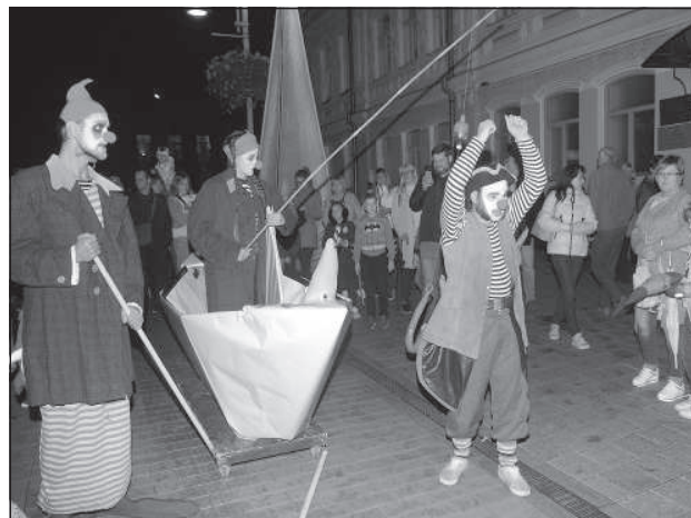
«Водное» представление от артистов Даугавпилсского театра.