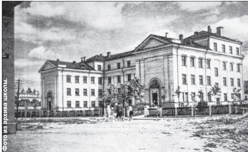
Школа 70 лет назад.