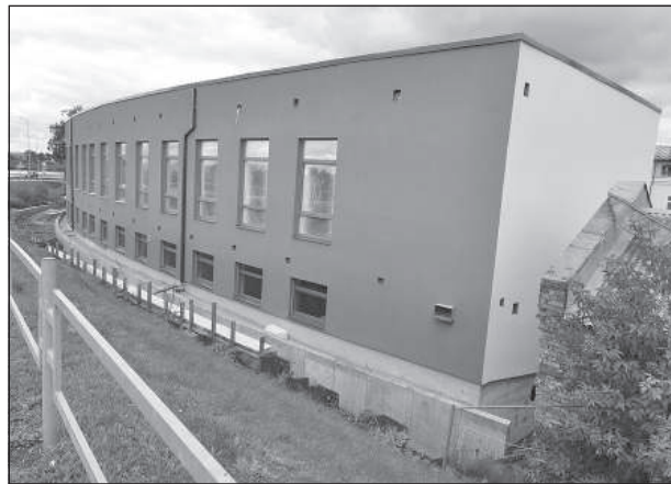
Новый корпус школы «Саулес».

Дополнительно требуется около 700 000 евро. Удорожание проекта возникло в связи с той частью, где предусматривалось использовать существующее здание, которое все же пришлось снести, вместе с чем появились достаточно большие дополнительные объемы строительных работ.