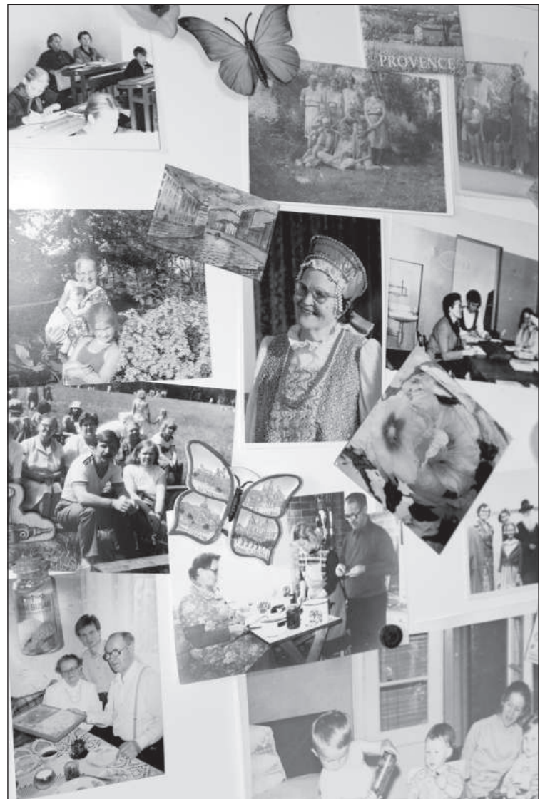
Коллаж — экскурс в историю — подарок к юбилею от внуков.