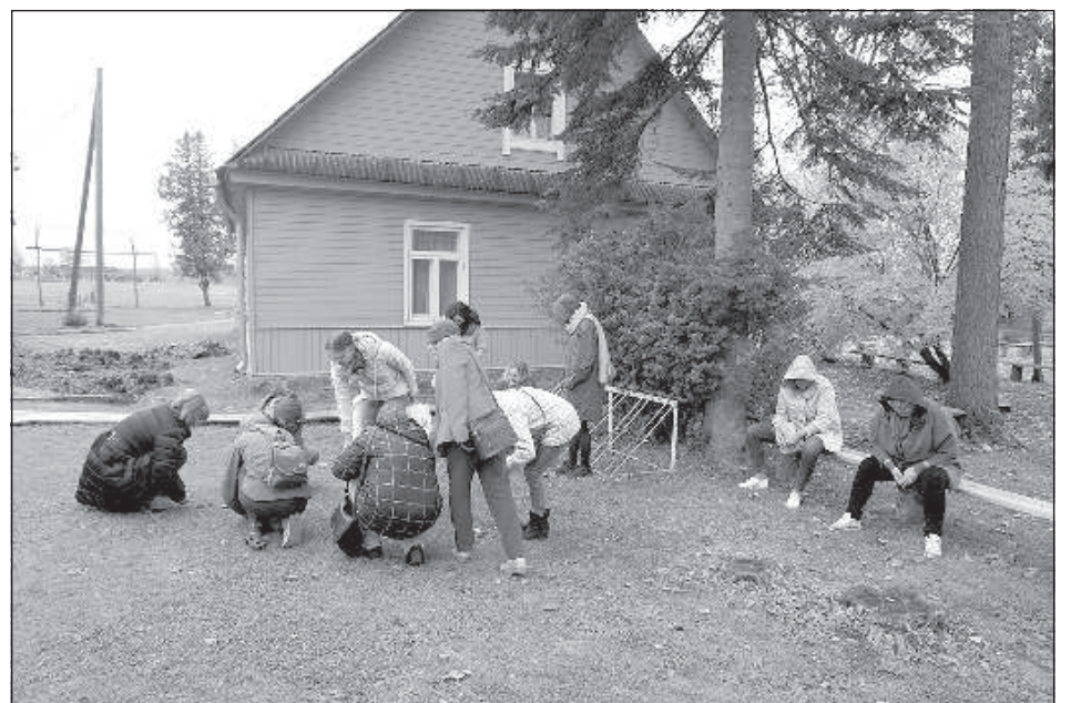
Участники семинара посетили Селию в ветреный осенний день.