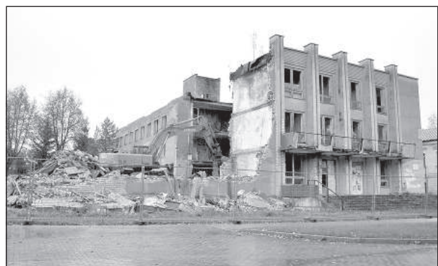
Сносится здание на ул. Гекеля.

В Даугавпилсской крепости продвигаются работы по демонтажу опасного здания из силикатного кирпича на ул. Гекеля, 3. Предприятие «Valsts nekustamie īpašumi» демонтирует свое здание за собственные средства.