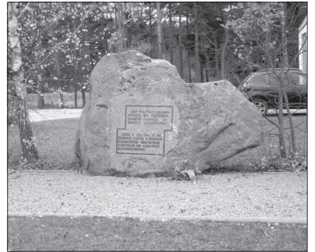
Памятник военнопленным уже давно стоит неподалеку от места, где нашли тела.