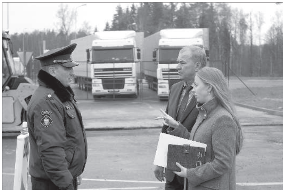
Представители Белорусского таможенного комитета и Латвийской погранохраны.