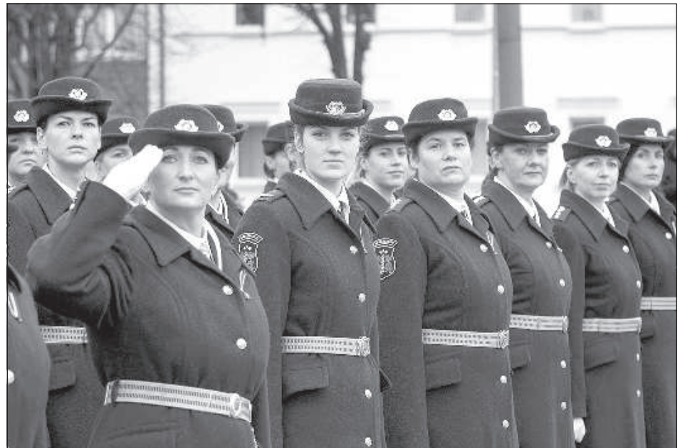
В параде участвовало также женское подразделение латвийских пограничников.

Также во время праздника в Фестивальном парке Резекне прошли различные информативные мероприятия, демонстрация экипировки, техники и оружия, которой пользуется погранохрана Латвии.