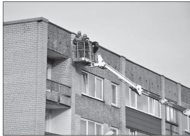
Мастера ПЖКХ осматривают жилой дом.

Удорожание расходов на различные строительные работы планируется покрывать из средств, которые будут сэкономлены после оптимизации работы предприятия и своих ресурсов.