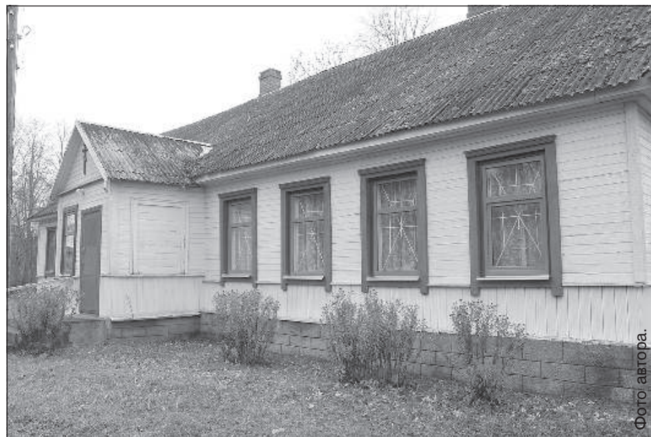
Молитвенный дом приведен в порядок.

Школа, которая когда-то служила идеальным образцом сосуществования в Латгалии нескольких народов, и в которой выучилось несколько поколений местных жителей, теперь