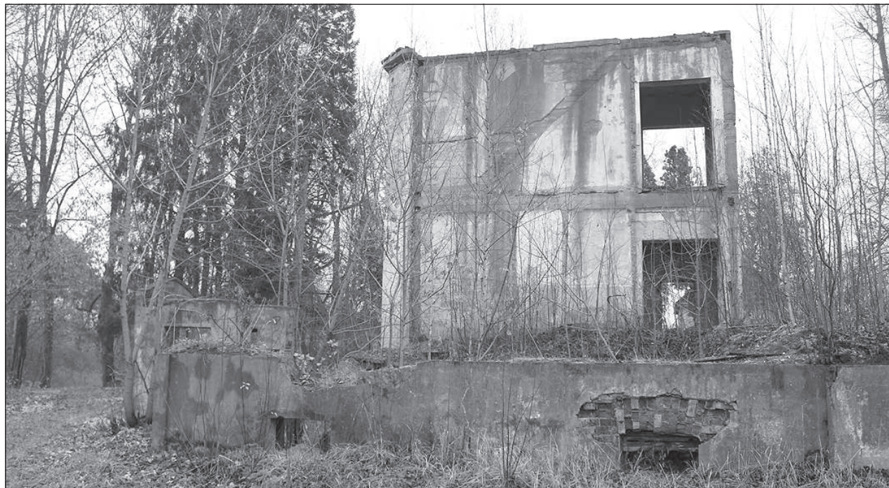
Аварийное здание привлекает детей и молодежь.