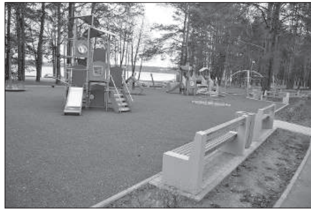
Детская площадка возле озера.