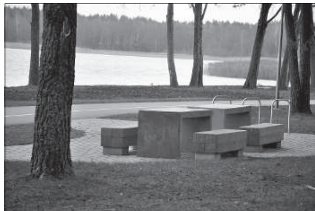
На променаде установлены столики со скамейками для отдыха.