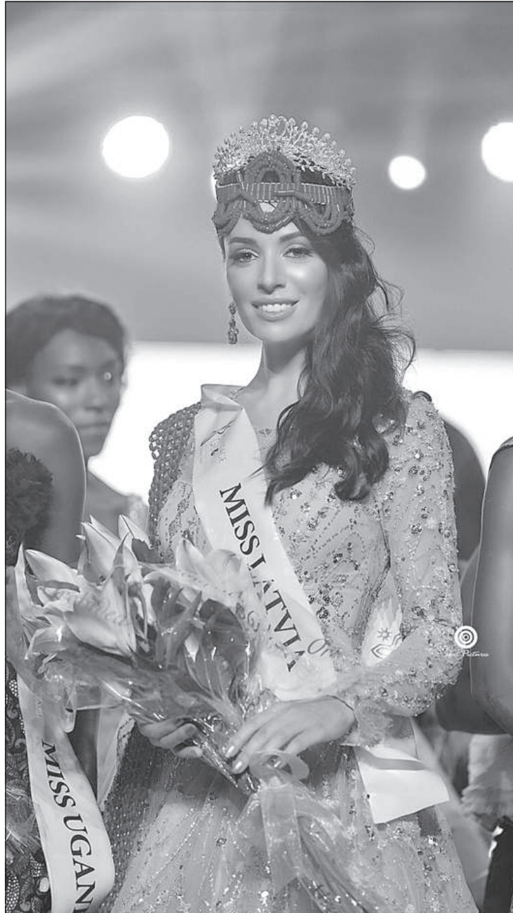
Победа на конкурсе «Miss Heritage Global 2019» в Гане.