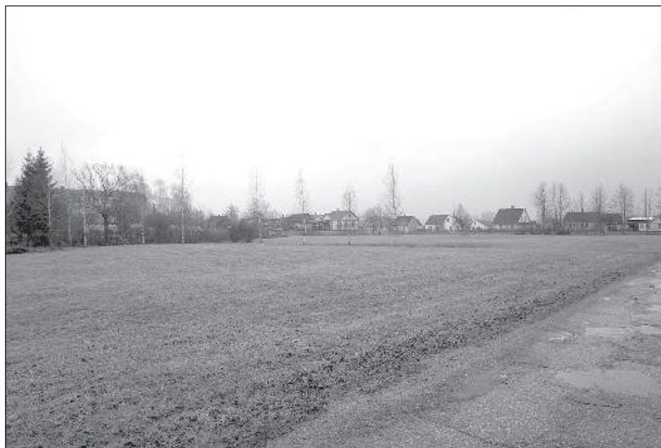
Территория возле перекрестка улиц Пилскалнес и Земниеку выбрана как наиболее подходящая для постройки футбольного поля.

«Чтобы вложить настолько крупные инвестиции, нужны займы (из Го-