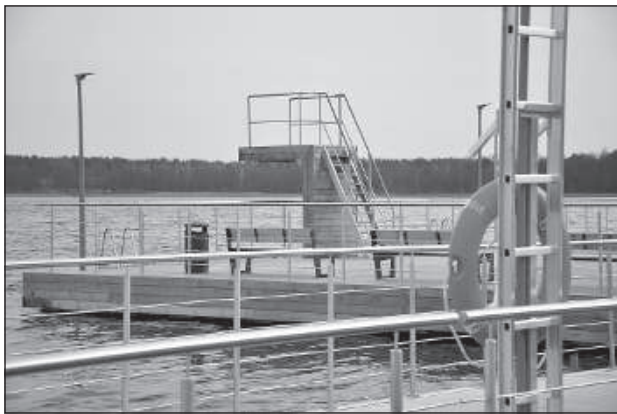
Плавающая конструкция на Стропском пляже.

за свои средства, поскольку европейское финансирование для подобных объектов Латвии в этом году было недоступно. Общая стоимость строительных работ составила... евро.