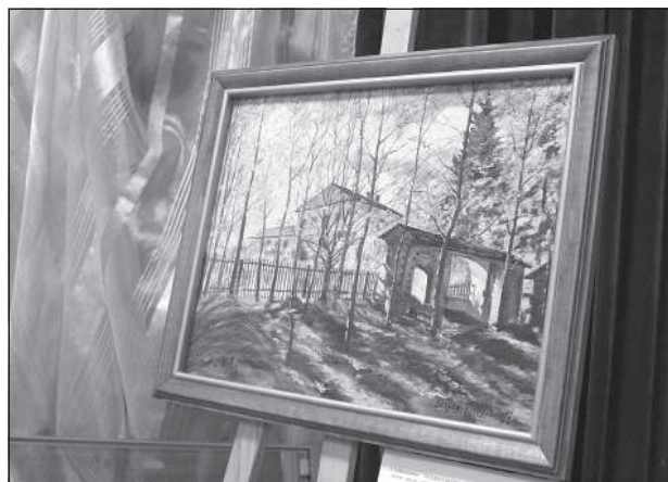
Копия картины «Усадьба осенью», сделанная Л. Мудраковским.

подряд вместе с учениками своей студии художник приезжал в имение Лоборж, которое находится недалеко от Резекне. Это имение семьи Воцининых было своеобразным культурным центром тогдашней Латвии, притягивающим местную творческую интеллигенцию. Существует картина Виноградова 1925 года «Усадьба осенью», на которой художник изобразил дом, старинный парк и главные ворота имения. Также в Латгалии был создан ряд и других его по-