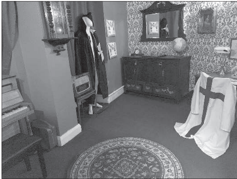
Так выглядит квест-комната.

На данный момент на предприятии Яниса работают 20 человек, часть из них члены семьи Лачплесисов, фирмой он руководит вместе с женой Ласмой Рачкауской. Ласма родом из Курземы, и сначала здесь работала на типичной для приезжих работе – собирала клубнику. Отказалась от изучения психологии в Латвии, чтобы исполнить мечту жить в Лондоне. Недавно 7 игровых комнат, рас-