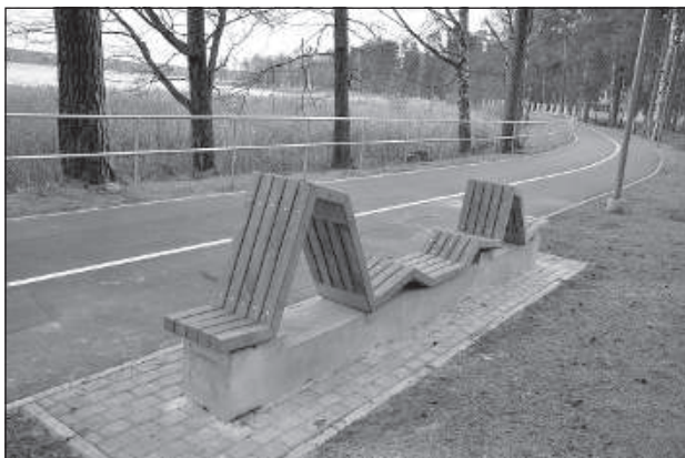
Вдоль променада расположены оригинальные скамейки.