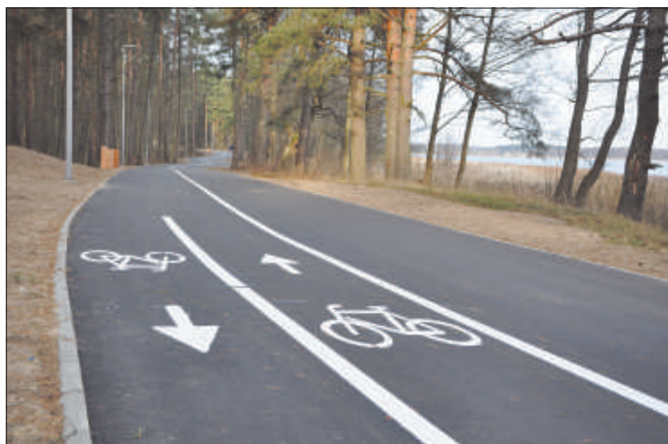
Променад пролегает вдоль берега Стропского озера.

На берегу Большого Стропского озера закончено строительство променада. Общая протяженность пешеходной дорожки, начинающейся от Даугавпилсской региональной больницы и заканчивающейся возле пляжа «Stropu vilnis», составляет 3 километра.