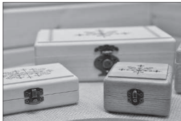
Деревянные шкатулки ливанского резчика по дереву Яниса Спуриньша.

«Идея здания, где можно было бы в домашней обстановке не только посмотреть, но и приобрести изделия латгальских ремесленников, появилась 5 лет назад. Это было хозяйственное здание моей семьи, где размещался курятник и хлев, а также стоял легковой автомобиль. Написали проект, и за неполные 2 года реализовали задумку, привлекая финансирование из Европейского сельскохозяйственного фонда и частные вложения — 100 000 евро. Нас