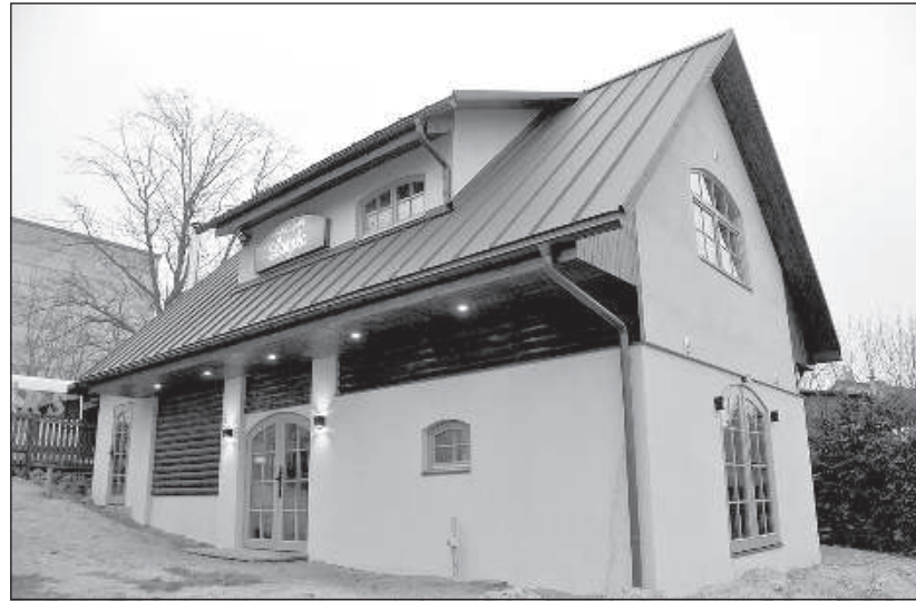
Сотрудники балвской фирмы «BTRS» перестроили хозяйственное здание в туристический объект.