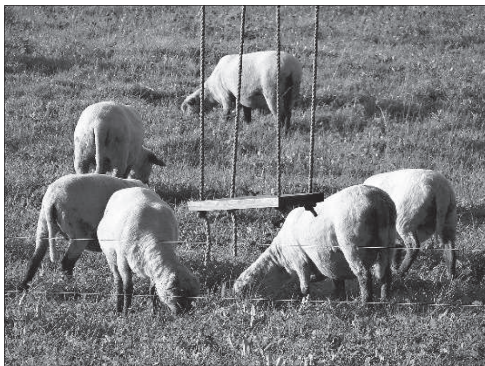
В стаде примерно 80-90 овец.

БПБК сообщило, что в период времени с 6 до 7 августа 4 должностных лица Прейльской краевой думы при поддержке еще 2-х должностных лиц Прейльской краевой думы, возможно, подделали акт о сдаче в эксплуатацию отремонтированного здания Прейльской краевой думы. Данный акт должностные лица Прейльской краевой думы предъявили строителю инспектору Государственного бюро по контролю за строительством 7 августа 2019 года, который и провел внеочередную проверку постройки. ■