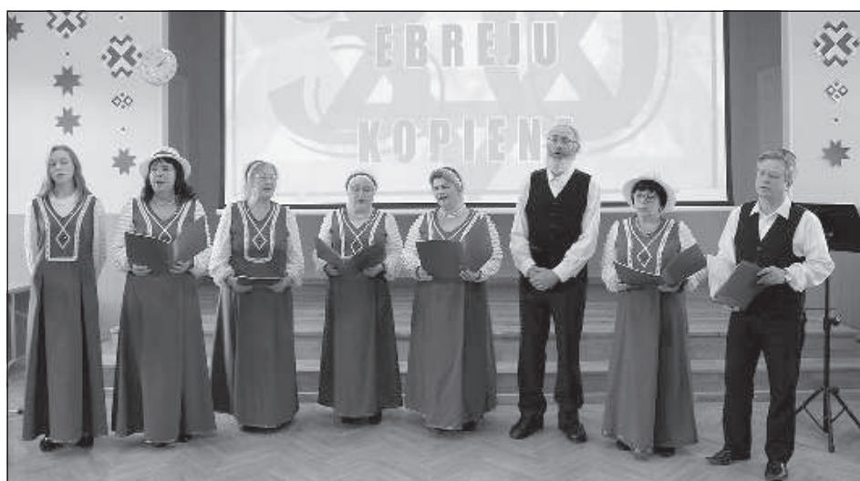
Вокальный ансамбль ДЕО «Мазл тов» тоже удостоился награды от руководства города.

нальных творческих коллективов и многое другое. На мероприятии по случаю 30-летия Даугавпилской еврейской общины побывало и руководство города, которое не только поздравило общину с юбилеем, но и вручило грамоты членам общины за активное участие в ее жизни и приверженность национальным традициям. В их