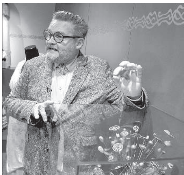
Иголка для дамской шляпки могла использоваться для самообороны.

У участников мероприятия была возможность отправиться на познавательную экскурсию вместе с историком и подробнее узнать о моде югендстиля в период с 1890 до 1914 года. На выставке можно посмотреть 100 аутентичных нарядов югендстиля, которые создавали дизайнеры, портные и мастера по вышивке в известнейших Европейских домах моды. Зрители смогут увидеть ткани, кружева, вышивки, аппликации и