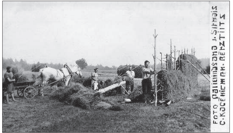
Старинные традиции толоки.

Идея создать такую энциклопедию у И. Плича появилась в процессе размышления над фразой, вскольз произнесенной неизвестным человеком на каком-то публичном мероприятии: «В истории деятельности латгальских фотографов много белых пятен». «Вот я уже и рабо-