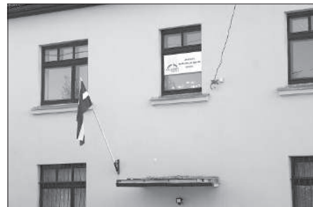
Теперь молодежь Калкунской волости собирается здесь.