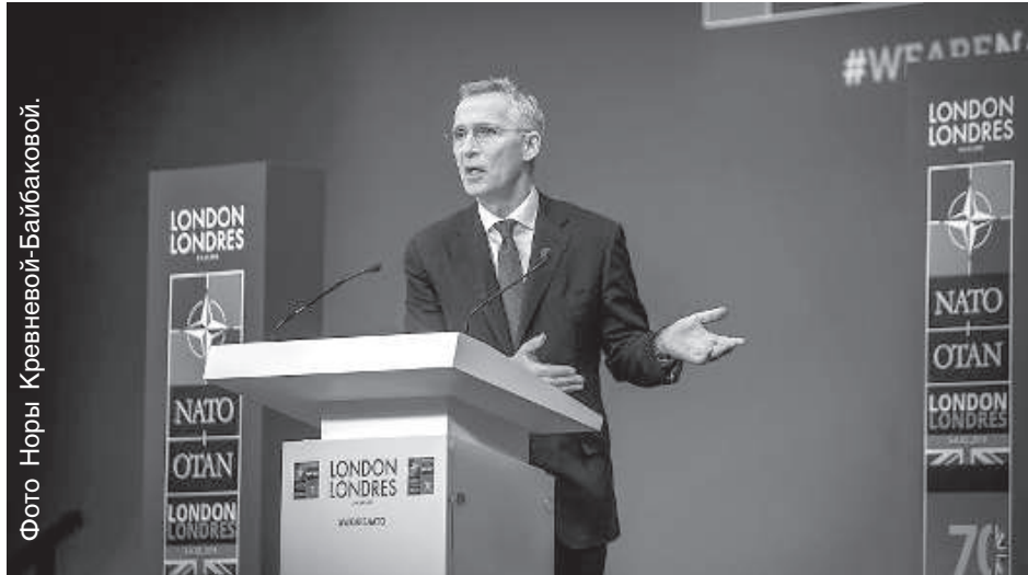
Генеральный секретарь НАТО Йенс Столтенберг.

Несмотря на все эти «неприятные моменты», итоги саммита оцениваются как положительные. Генеральный секретарь объявил журналистам и всему миру, что дискуссия была важной и хорошей, и что альянс остается крепким. «Мы едины, один за всех и все за одного», — заявил Й. Столтенберг. — Наша приверженность пятой статье альянса — положению о коллективной обороне нашего Североатлантического союза, является нерушимой». К тому же, по его словам, единение помогло принять лидерам ряд целых важных стратегических решений. Во-первых, НАТО повысит свою боеготовность — в те-