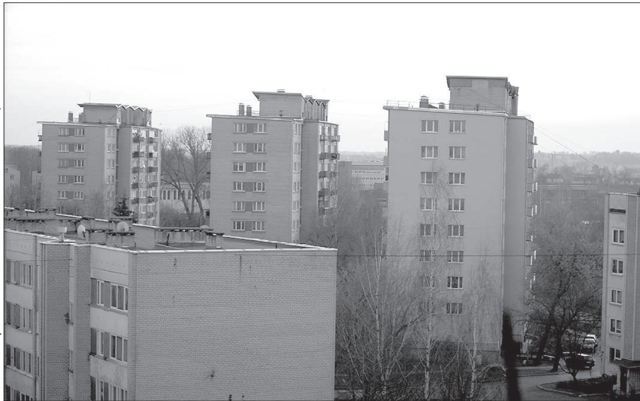
Жители многоквартирных домов сами выбирают обслуживающую организацию.