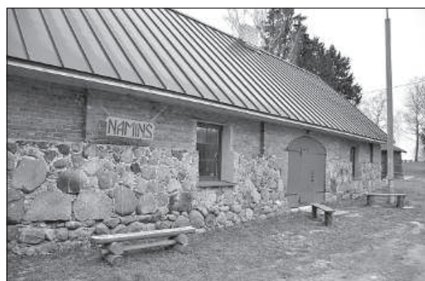
Домик охотничьих трофеев.