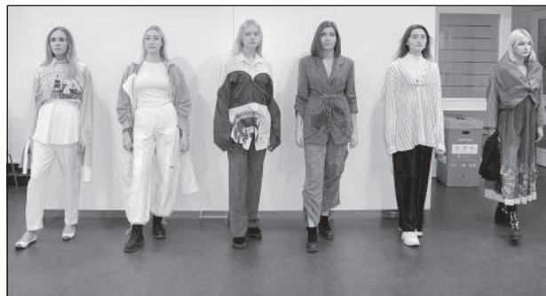
Образцы «второй жизни» использованной одежды от школы «Saules».

и одежда составляет 5% мировых отходов. В результате, индустрия моды считается одной из самых больших «загрязнителей» мира.