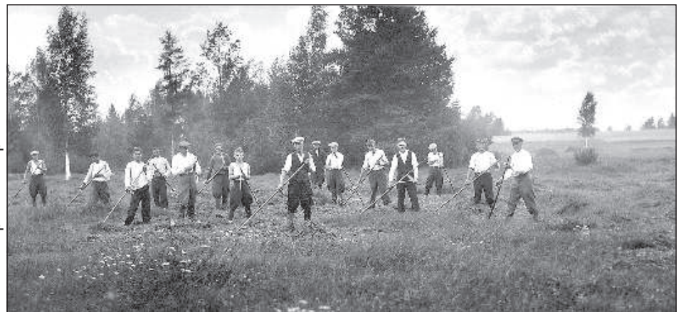
На фотографии запечатлены полевые работы в Каценах около 100 лет назад.

таю 6-й год, чтобы доказать Латвии, что история деятельности латгальских фотографов — это не совсем белое пятно», — подчеркнул И. Плич.