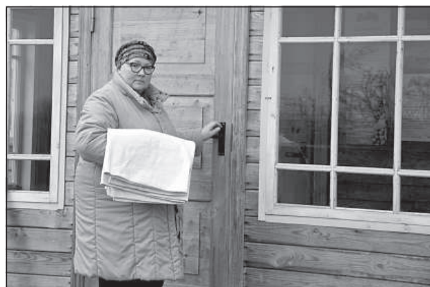
«Ambeļu skreine» — дом латгальских традиционных ремесел.