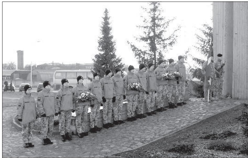
Почетный караул в Слободке от подразделения Яунсардзе.