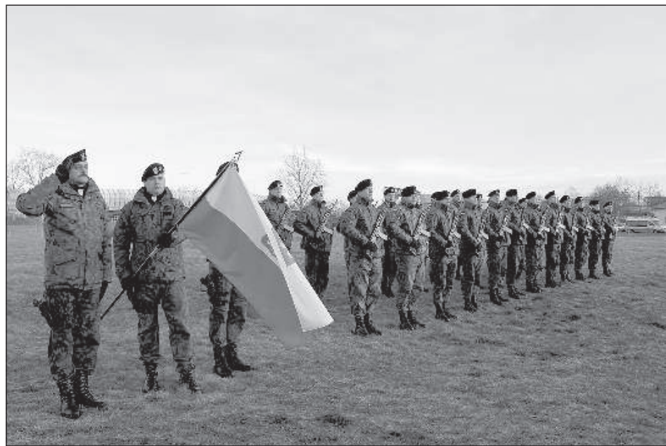
В памятных мероприятиях принимал участие отряд вооруженных сил Польши.

Воспоминания обо всех участниках тех событий, по мнению Г. Сомса, зависели от власти и политических веяний в Европе. Например, до 30-х годов, пока Польше не стала угрожать фашистская Германия, в Латвии не вспоминали о поляках. Именно тогда, в 1935 году, в городе появилась первая памятная табличка. О том, что в боях за Даугавпилс 100 лет назад участвовали литовцы, было забыто вообще, и только в последние десятилетия чтут могилы литовских солдат, освободивших город. ■