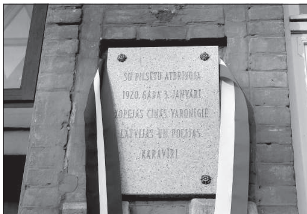
Восстановленная памятная табличка на здании Даугавпилсской думы.

был еще Двинск, предшествовало 4 месяца боев. В течение всего этого времени было 3 крупных боя, в том числе и 3 января 1920 года, но, даже не считая этих схваток, город обстреливался практически все время. «Историками было подсчитано, что только 12 дней за тот период в городе была тишина», — рассказывает Г. Сомс.