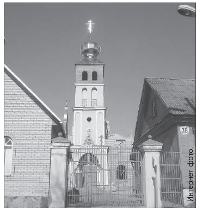
Старофорштадтская моленная открыта для прихожан каждый день с 9:00 до 15:00.

В светлый праздник Рождества Андрей Григорьевич призывает людей придти в моленную к Богу с открытой душой и открытым сердцем и просит не поддаваться греху уныния. ■