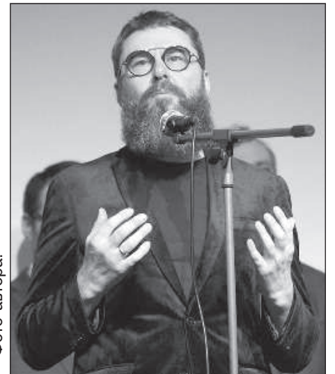
Режиссер Виестурс Кайришс.

для латгальцев и других людей во всем мире. Будем показывать его по телевидению, чтобы народ лучше осваивал культурное пространство Латгалии, но одновременно понимаю, что все подтексты, вплетенные в повествование, смогут понять интеллектуалы».