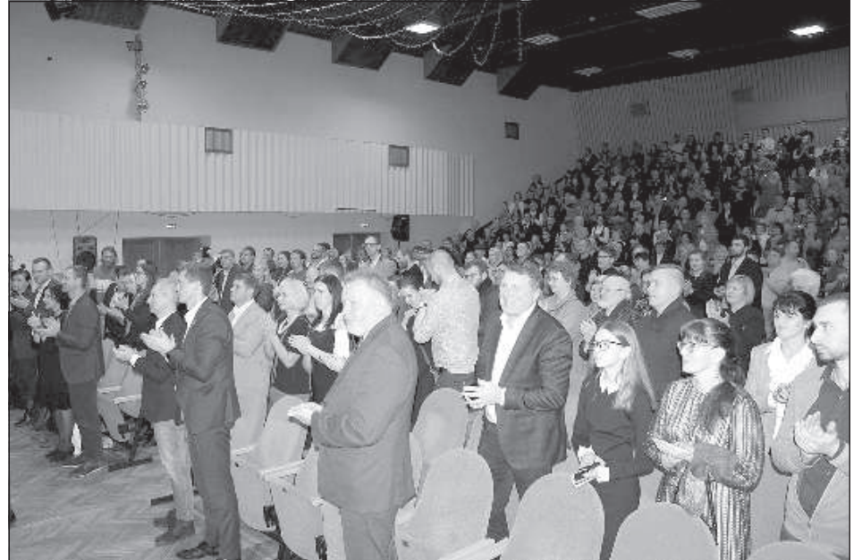
Премьеру посетили масса гостей, в том числе действующие министры, экс-президент Латвии Раймонд Вейонис и другие.

В то же самое время, несмотря на то, что Ансис настоящий латгалец, не старался это как-то выделиться. Присущие ему черты характера могут быть у многих других людей, не думаю, что человечность – это узко национальная вещь. Такой герой мог жить в любой точке Европы. Фильм предназначен