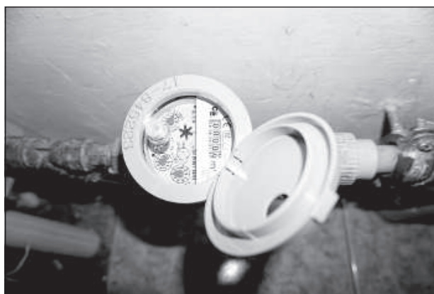
Нововведения Кабинета министров не избавят от платежей за неучтенную воду.

— распределение в соответствии с числом квар-