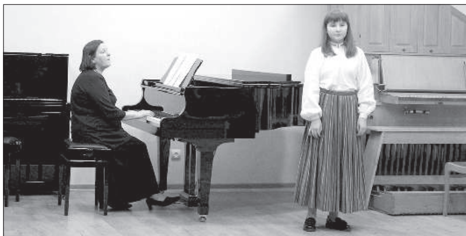
В программу конкурса входит исполнение определенной народной латгальской песни.