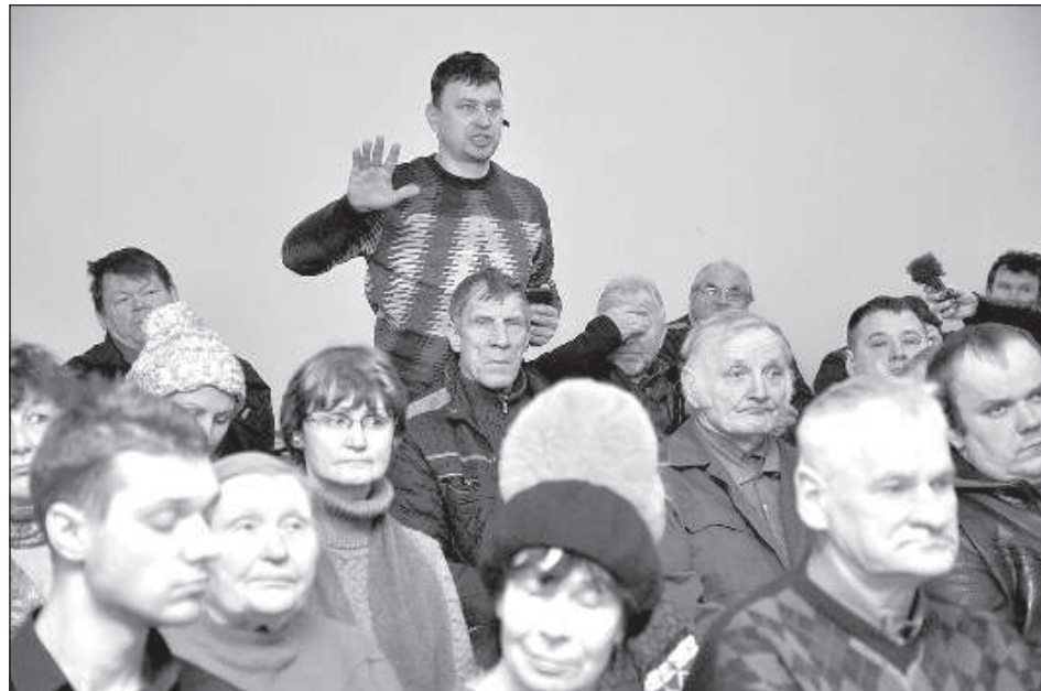
Жители активно участвовали в обсуждении идеи расширения полигона.