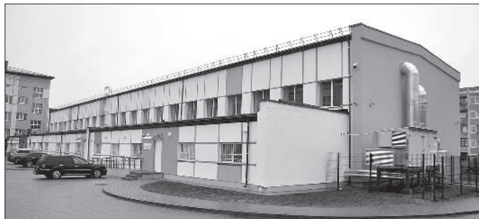
Утепленный легкоатлетический манеж.

Фирмы «Vapro un Nordserviss» закончили утепление здания Даугавпилсского спортивного манежа на ул. Валкас, 4В, сообщили «Латгалес Лайкс» в городской думе.