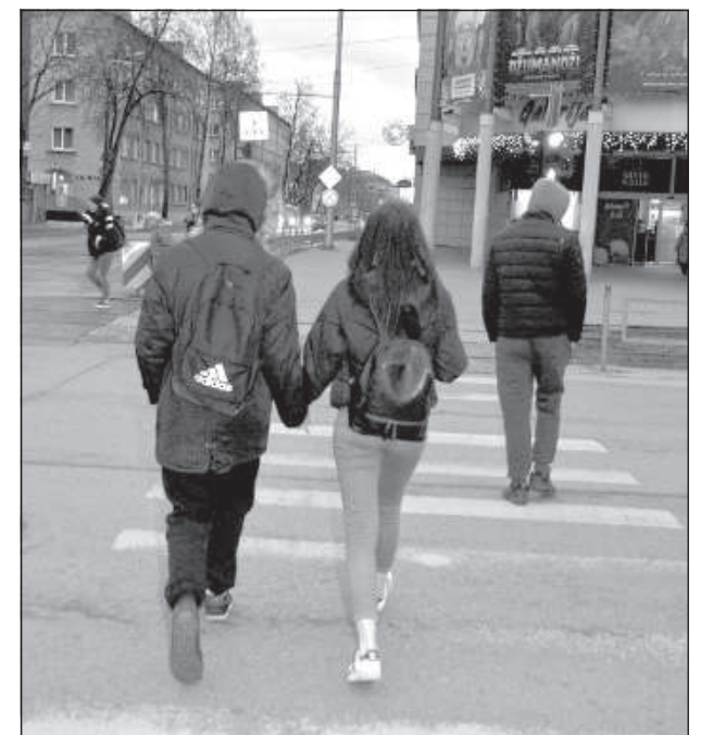
В темноте или сумерках парня заметят, поскольку у него есть светоотражающая надпись на одежде, а вот девушку не видно.