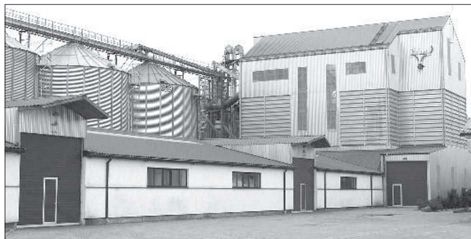
Комплекс зданий к/х «Kotiņi» наиболее быстро рос именно в последнее десятилетие.