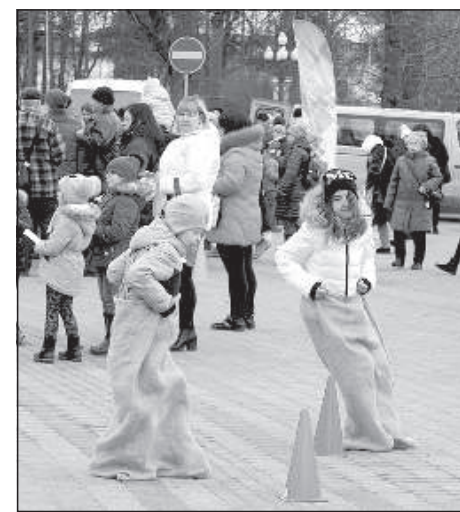
За участие во всех спортивно-игровых состязаниях детей ожидал поощрительный приз.