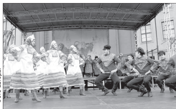
Зажигательный народный танец от коллектива Даугавпилсской Технологической школы-лицея «Балагуры».