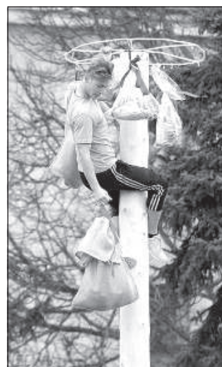
С «ледяного» столба были сняты все подарки.