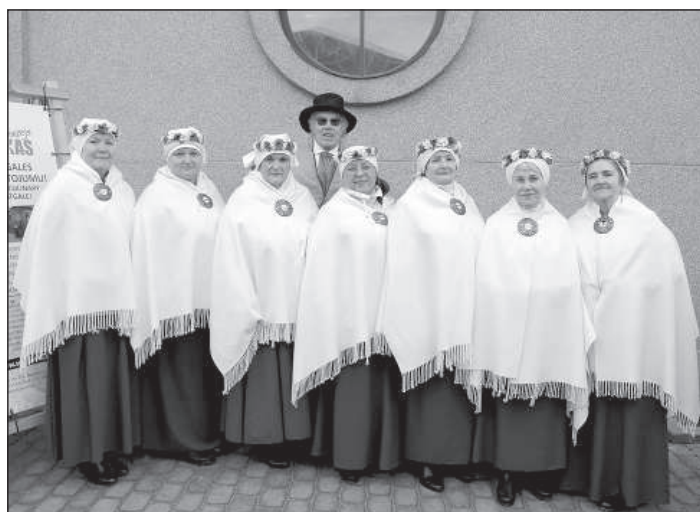
В праздновании Масленицы приняли участие разные национальные коллективы города, например, ансамбль «Ретро» Центра латышской культуры.